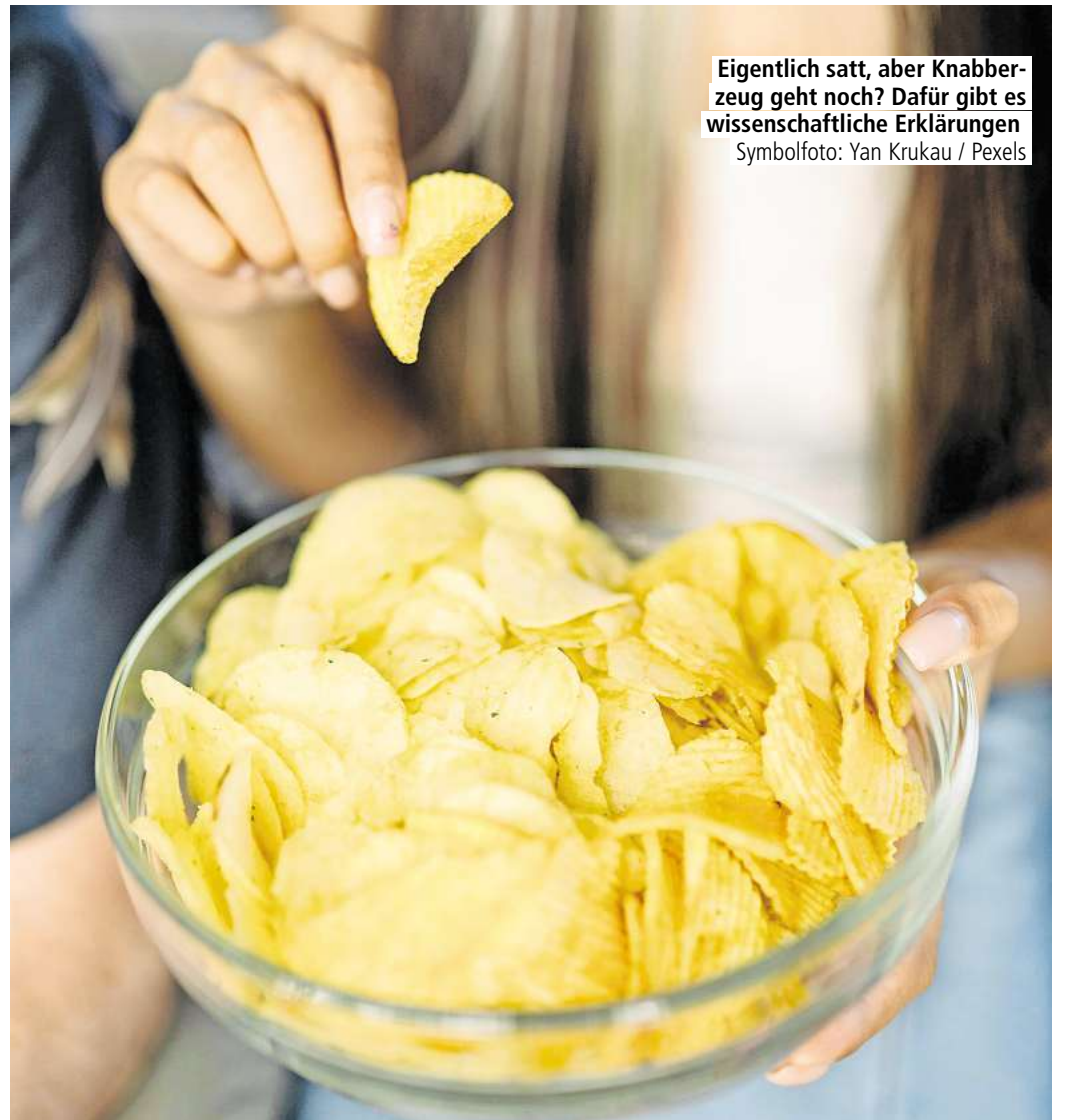
Eigentlich satt, aber Knabberzeug geht noch? Dafür gibt es wissenschaftliche Erklärungen.

Reaktionen auf die Reize von Schokolade, Chips und Co. unabhängig von bewussten Entscheidungen wie Gewohnheiten funktionieren. Vor diesem Hintergrund sei es „kein Wunder, dass es sich unmöglich anfühlen kann, einem Donut zu widerstehen“, so Sambrook.