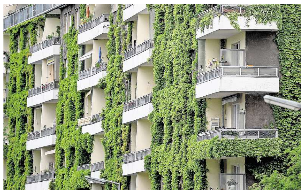
Gute Planung ist alles: Pflanzen an der Fassade sorgen im Sommer für Schatten und im Winter für zusätzliche Dämmung.

Grundsätzlich gibt es laut VFF zwei Formen: Entweder wachsen Kletterpflanzen vom Boden