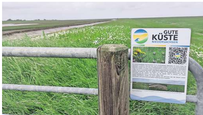
Die Feldstudie fand auf einem Deich in Butjadingen an der niedersächsischen Nordseeküste statt.