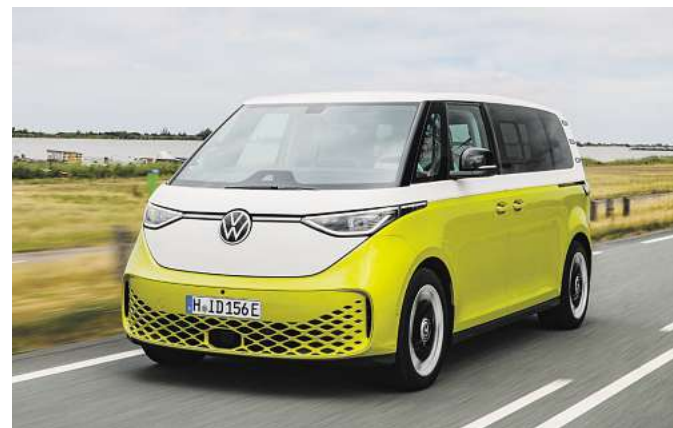
Der ID. Buzz bietet viele attraktive Modellvarianten

Entwickelt wurde diese Lösung gemeinsam mit dem niederländischen Unternehmen Snoeks Automotive. Die Trennwand wird direkt bei der Neuwagen-Kon-