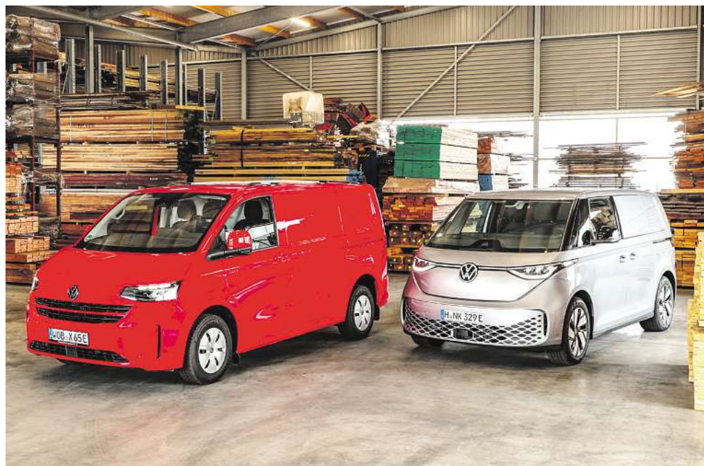
Bereit für nützliche Aufgaben: Der e-Transporter (links) und der ID. Buzz Cargo