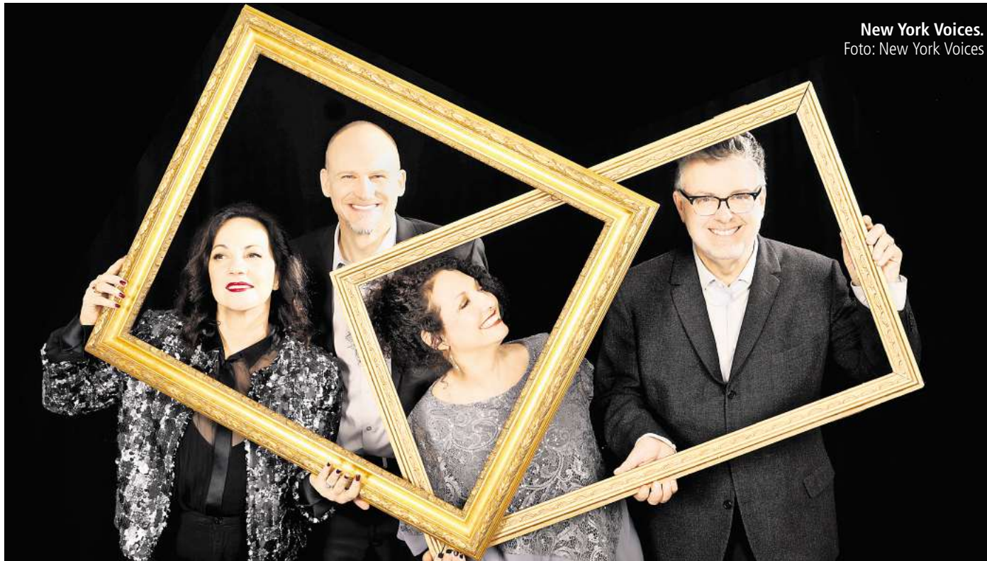
New York Voices. Foto: New York Voices

gehen die Hannoveraner von Maybeop am 2. Mai im Theater am Aegi an den Start und haben ihre Show in kürzester Zeit ausverkauft. Eine weitere Chance, Maybeop zu sehen, haben Fans aber beim großen Abschlusskonzert im Kuppelsaal. Dort werden die vier Typen gemeinsam mit calens vocalensemble, Of Cabbages and Kings (AUT/UK/GER) und den New York Voices (USA) für ein würdiges Finale sorgen.