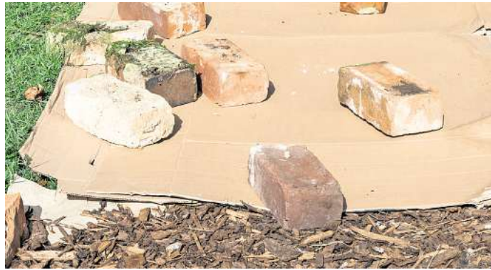
Als Basis: Die Pappe soll Licht unterdrücken und das Sprießen von Unkraut verhindern. Es gibt auch spezielle Pappe im Gartenbedarf.

Für viele Gartenfans beginnt das Frühjahr traditionell mit dem Spaten in der Hand: Erde lockern, Beete umgraben, den Boden fit für die neue Saison machen. Doch immer mehr Menschen verzichten auf diese schweißtreibende Routine. Statt schwerer Arbeit setzen sie auf ein Prinzip, das einfacher, schonender und auch noch erstaunlich effektiv ist. Beim No-Dig-Gardening, dem Gärtnern ohne Umgraben, bleibt der Boden weitgehend unberührt. Genau das sorgt für verblüffend fruchtbare Ergebnisse.