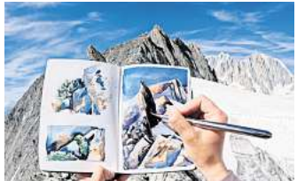
Eine berührende Spurensuche in der Mont-Blanc-Region: „My Grandmother's Sketchbook“.