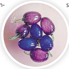
Exponate schwedischer Glaskunst aus dem Studio Bo