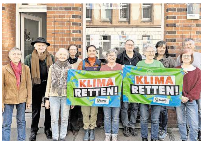
Das Klimabüro hat in Linden seinen neuen Standort bezogen.

tag von 14 bis 18 Uhr sowie Mittwoch von 10 bis 14 Uhr – soll mit dem neuen Angebot dauerhaft ein Ort entstehen, an dem Beratung, Austausch und praktische Unterstützung rund um den Klimaschutz in der Stadt Hannover gebündelt werden. RED