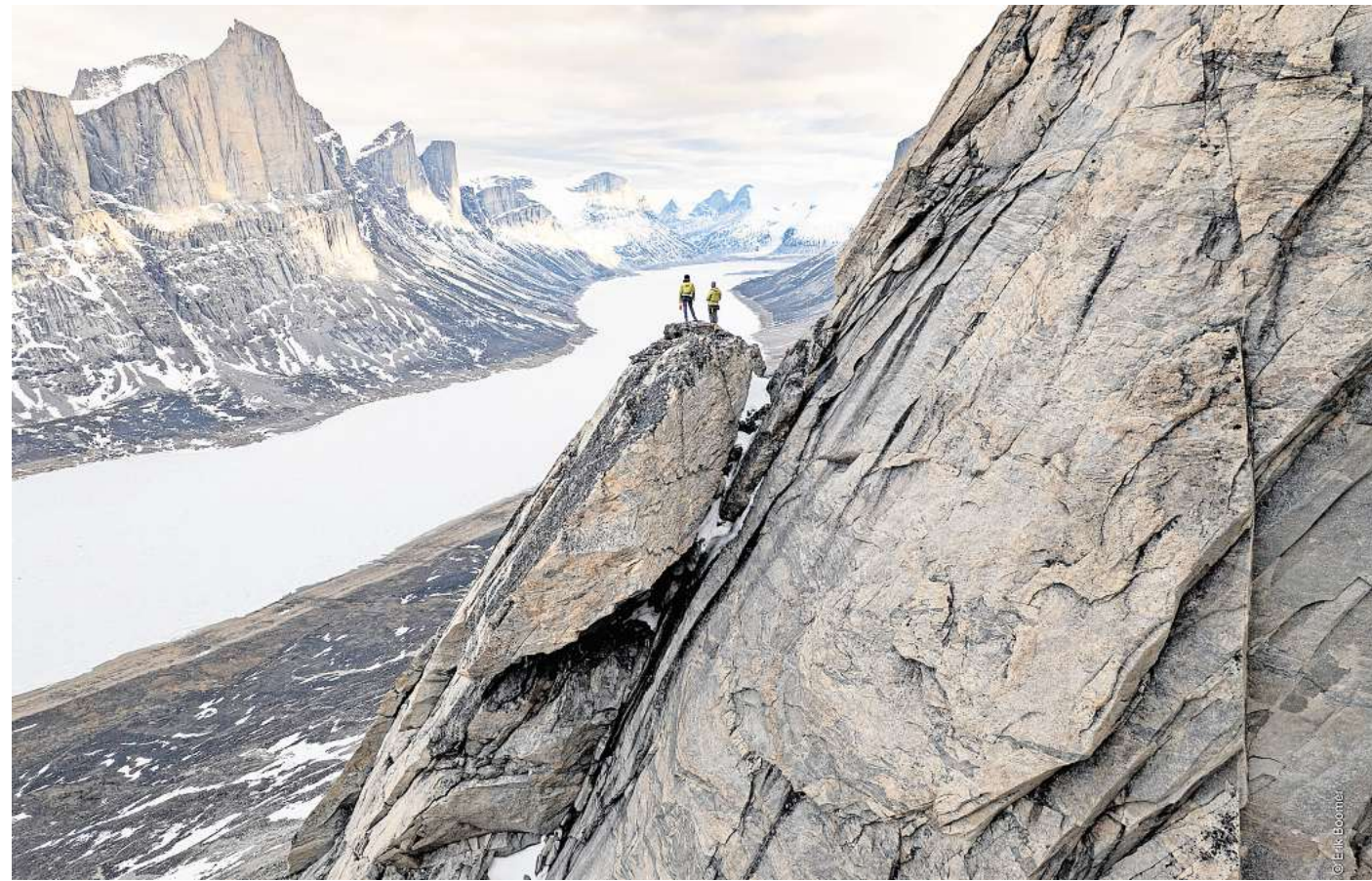
Mit Kajak, Kletterseil und Kite auf Baffin Island: Ein Film des Programms ist „A Baffin Vacation: Love on Ice“.

Diese Route hat Generationen von Kletterern scheitern lassen – bis vier Alpinisten beschließen, es anders zu machen. Ihr Ziel: die legendäre Linie in Patagonien frei und am Stück zu klettern. Was wie ein sportliches Projekt beginnt, entwickelt sich schnell zu einem nervenzehrenden Experiment. Denn während draußen das Wetter umschlägt, brodelt es im Team. Unterschiedliche Temperamente, Er-