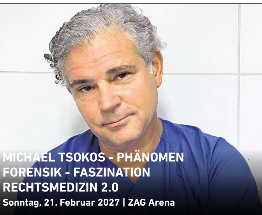
MICHAEL TSOKOS - PHÄNOMEN FORENSIK - FASZINATION RECHTSMEDIZIN 2.0 Sonntag, 21. Februar 2027 | ZAG Arena