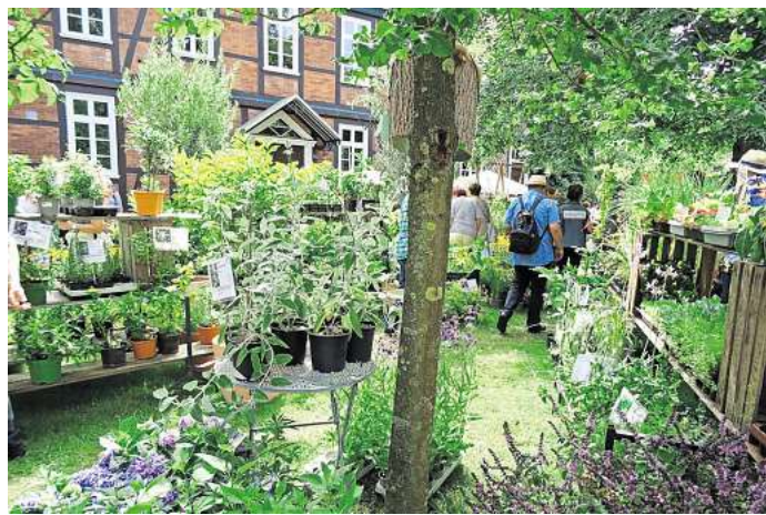
Das Gartenfestival Blumen & Ambiente findet in diesem Jahr vom 30. April bis zum 3. Mai statt.