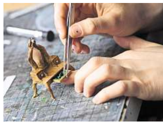
Abgründe: In der Schublade des Miniatur-Schminktisches haust das Monster von Loch Ness. Natürlich ein sehr kleines Exemplar.