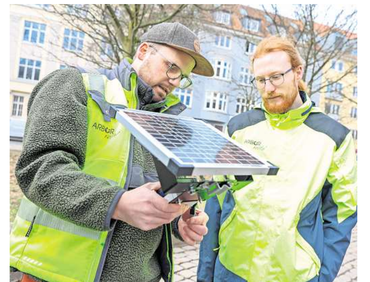
Mitarbeiter des Umweltbüros Arbor revital mit einem Solarmodul, das das Dendrometer mit Energie versorgt.