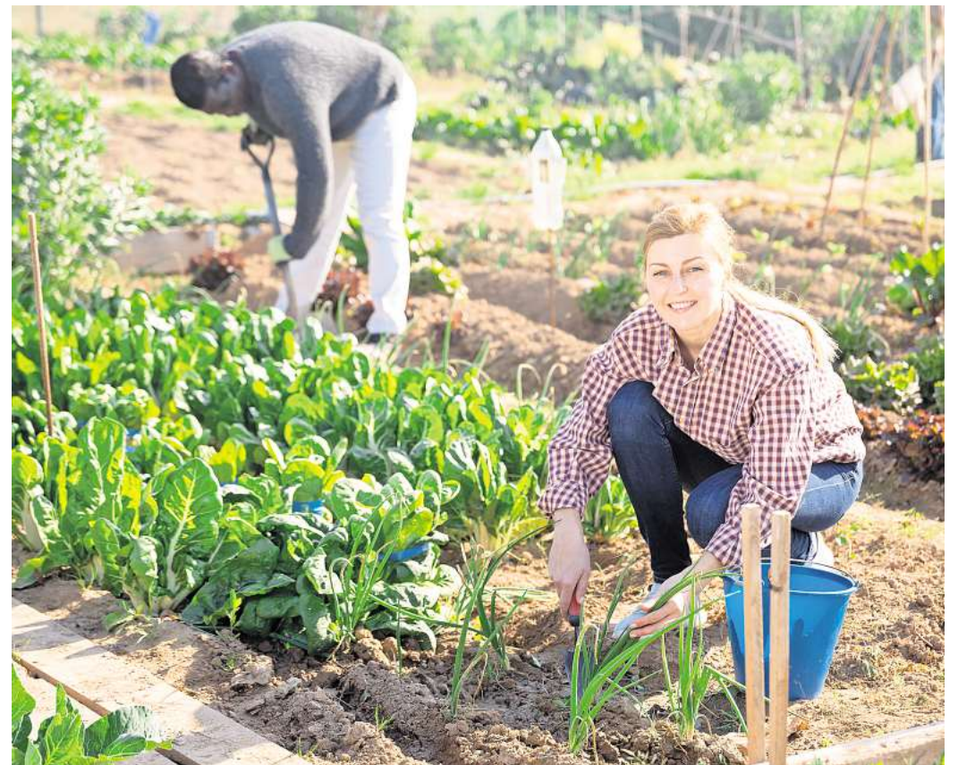
Ein Platz an der Sonne: Für das No-Dig-Gardening scheiden Beete im Schatten aus. Der Standort darf sogar eine Rasenfläche sein. Auf jeden Fall wird erst gesät und gepflanzt, wenn die gewässerte Pappe verrottet ist.

Was einerseits den offensichtlichen Vorteil hat, dass wir seltener zur Gießkanne greifen müssen – aber auch hilfreich bei Dür-