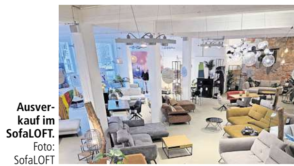
Ausverkauf im SofaLOFT.