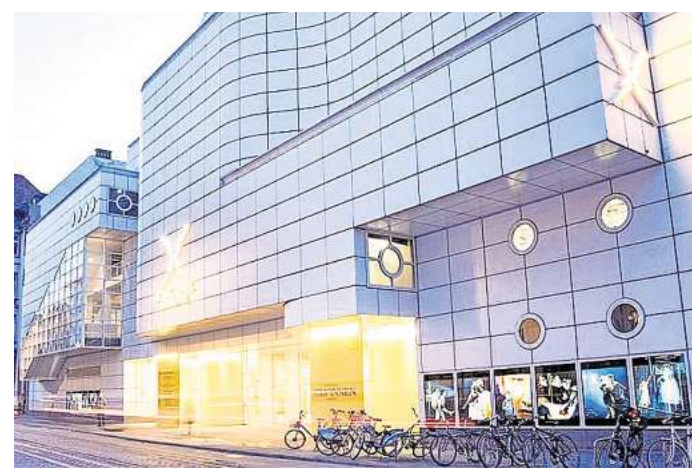
Das Schauspiel Hannover zeigt das Stück „Höhere Gewalt“ in deutschsprachiger Erstaufführung.

Die nächste Aufführung findet statt am Freitag, 27. März, von 19.30 bis 22.30 Uhr im Schauspielhaus, Prinzenstraße 9. Karten kosten zwischen 25 und 54,50 Euro, ermäßigte Tickets sind ab 5 Euro erhältlich. RED