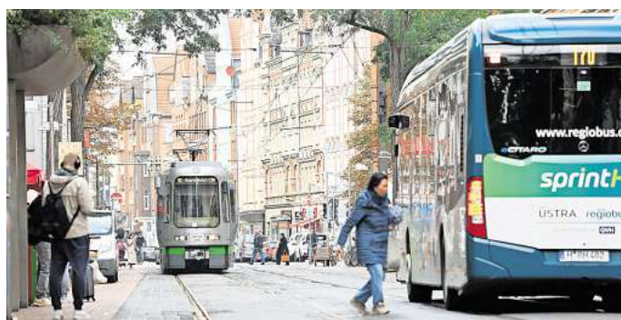
Bus und Bahn auf der Limmerstraße: „Wir wollen weitere Fahrgäste mit dem eTarif gewinnen.“

Während der Fahrt trackt die App den Fahrtverlauf, bis sich der Nutzer nicht mehr im Tempo von Bus, Bahn oder Zug bewegt. „Außerdem erkennt das System anhand von Haltestellen, ob der Nutzer noch im Streckennetz unterwegs ist“, ergänzt Verbund-Geschäftsführerin Katharina Emde-Lachmund. Sobald sich