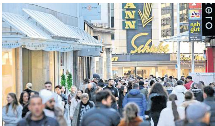
Viele Besucher kommen zum verkaufsoffenen Sonntag in Hannover.