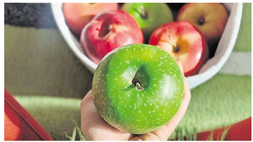
Kreuzallergie: Es kann bei Birkenpollenallergikern vorkommen, dass der Verzehr eines Apfels eine allergische Reaktion auslöst.

Das Wichtigste sei eine gründliche Anamnese samt individuellem Pollenprofil, sagt Lämmel. Sie hält eine enge Zusammenarbeit zwischen Allergologinnen und Allergologen und Ernährungsfachkräften (am besten mit Expertise im Bereich der Allergologie) dabei für unverzichtbar. Die