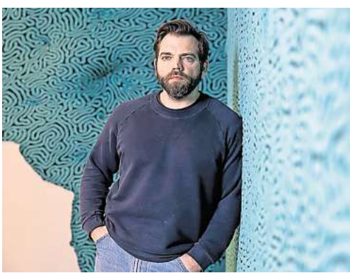
Der französische Künstler Jérémy Gobé stellt erstmals in Deutschland aus. Foto: Museum für textile Kunst