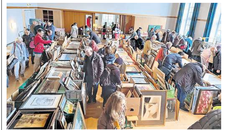
Am 28. Februar und am 1. März findet im Gemeindehaus der Bugenhagenkirche der „Sturm auf Schmuck und Bilder“ statt.