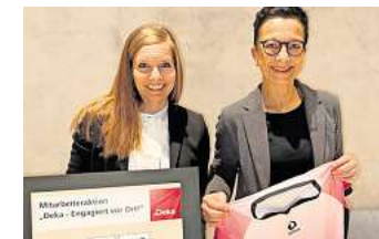
Die Pinke Zitronen e.V. sind eine Selbsthilfegruppe für jüngere Frauen und Mütter mit Brustkrebs.

Pinke Zitronen e.V. ist eine Selbsthilfegruppe für jüngere