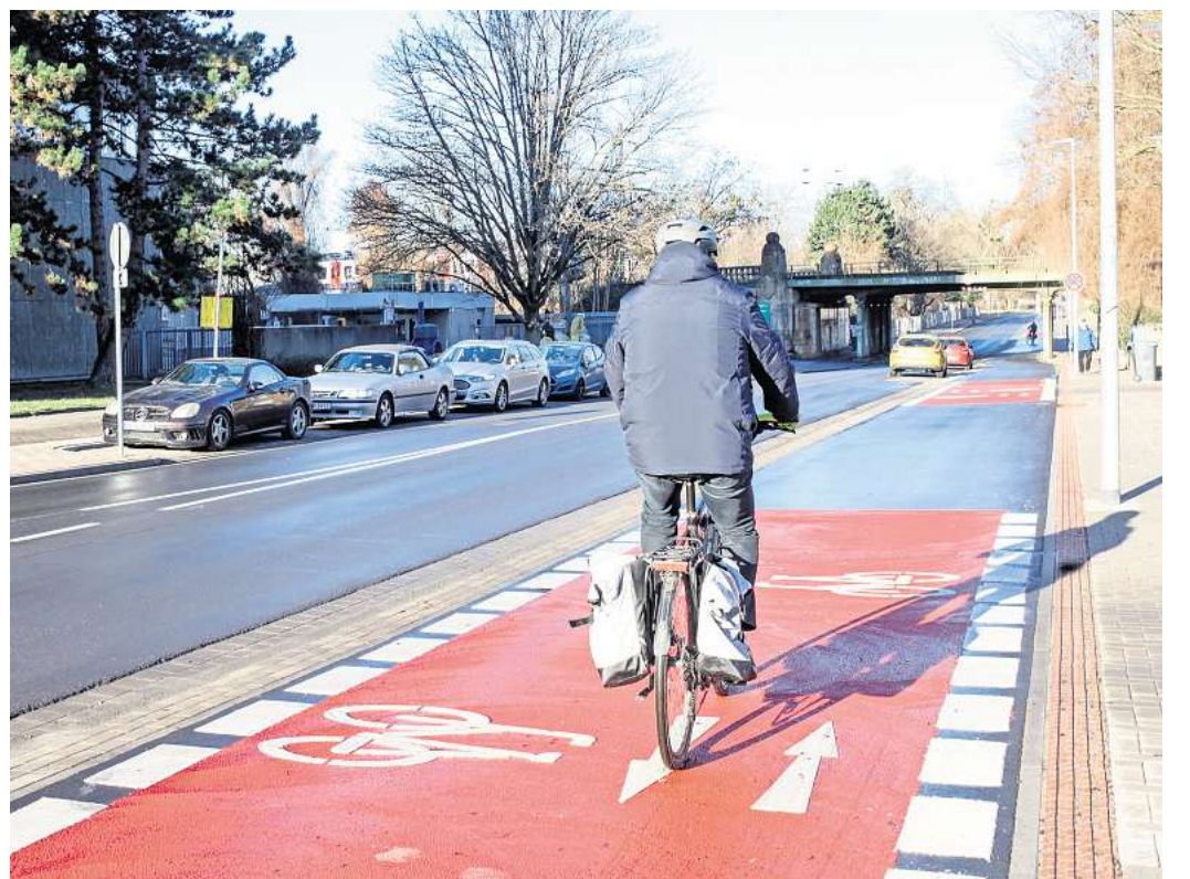
Dieser Abschnitt ist schon fertig: Die Stammestraße, über die die Veloroute 9 nach Ricklingen führt.

Zudem beabsichtigt die Stadt, in diesem Jahr die Planungen für weitere wichtige Projekte voranzutreiben, von denen der Radverkehr profitieren soll. Dazu gehören der Neubau der Dornröschenbrücke zwischen Linden-Nord und der Nordstadt sowie der Bau einer neuen Brücke über die Leine am Strandleben.