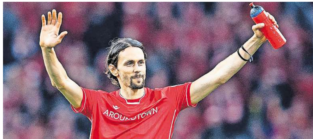
Im Union-Trikot: Neven Subotic wurde nicht nur in Dortmund, sondern auch in Berlin von den Fans gefeiert