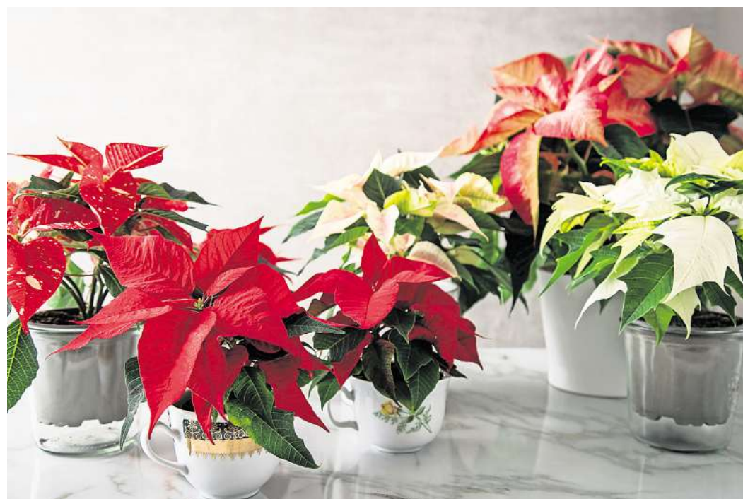
Der Weihnachtsstern ist ein Klassiker in der Adventszeit und bringt mit seinen farbigen Hochblättern natürliche Farbakzente ins Wohnzimmer.

Tipp: Ist die Erde stark ausgetrocknet, kann man den Pflanztopf kurz vollständig in Wasser tauchen. Anschließend gut abtropfen lassen und danach wieder zurück in den Übertopf stellen.