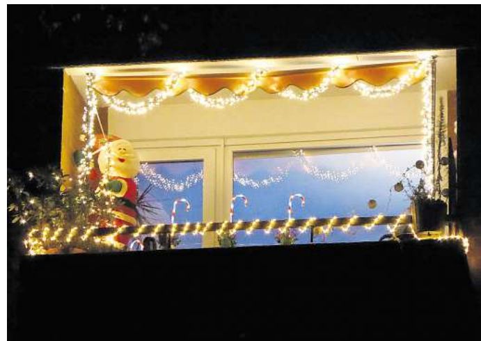
Auch die Weihnachtsdeko mit Lichterkette auf dem Balkon beeinflusst die Tiere