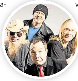
Moin! Torfrock feiert die „Bagaluten-Wiehnacht“.

► Der Harfenist Xavier de Maistre gastiert mit dem Belgrade Chamber Orchestra am Montag, 22. Dezember, ab 19.30