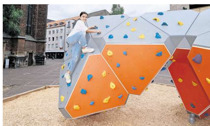
Beliebt: Die Boulderwand auf dem Platz vor der Marktkirche hat die meisten Besucher angezogen.

Bereits das vierte Jahr in Folge hat die Stadt Hannover auf mehreren Cityplätzen in der Som-