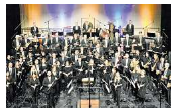
Das MSO gibt seine Neujahrskonzerte.

HANNOVER. Das Modern Sounds Orchestra aus Seelze gibt im Januar 2026 wieder Neujahrskonzerte unter dem Motto „Woran glaubst du?“ und spielt dabei Musik unterschiedlicher Stile aus verschiedenen Ländern. Termine sind Sonnabend, 17. Januar, ab 18 Uhr im Forum der Bertolt-Brecht-Gesamtschule in Seelze und am Sonnabend, 24. Januar, ab 18 Uhr im Theater am Aegi in Hannover. Als Solist ist Trompeter Stefan Knaebel mit dem „Konzertstück Nr. 2“ von Vassily Brandt zu hören. Wir verlosen 5 mal 2 Tickets für die Show in Hannover und 5 mal 2 Tickets für das Konzert in Seelze. Zur Teilnahme am Gewinnspiel einfach den hier stehenden QR-Code mit dem Smartphone oder Tablet scannen und den Anleitungen auf der Webseite folgen. Die Teilnahme ist möglich bis einschließlich Montag, 12. Januar. Der Rechtsweg ist ausgeschlossen.