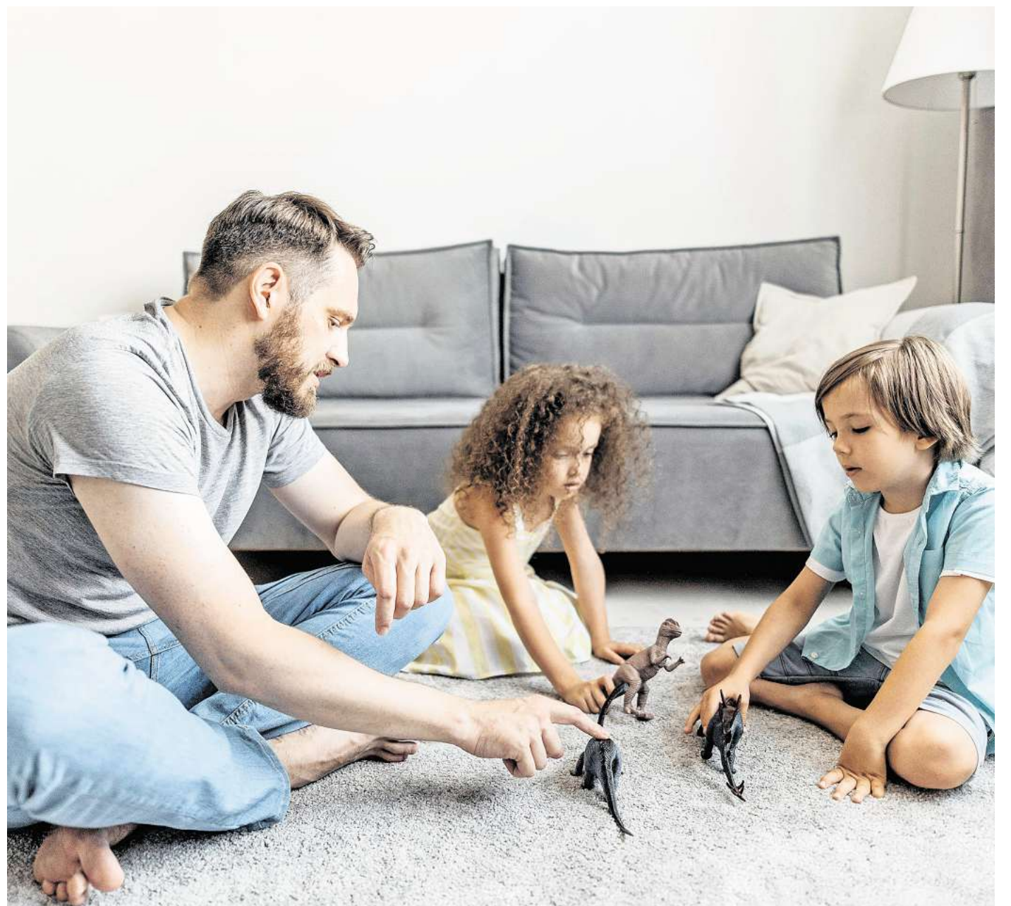
Kinder sind von Natur aus neugierig – dabei tauchen sie tief in Themenwelten ein, die sie faszinieren, zum Beispiel Dinosaurier