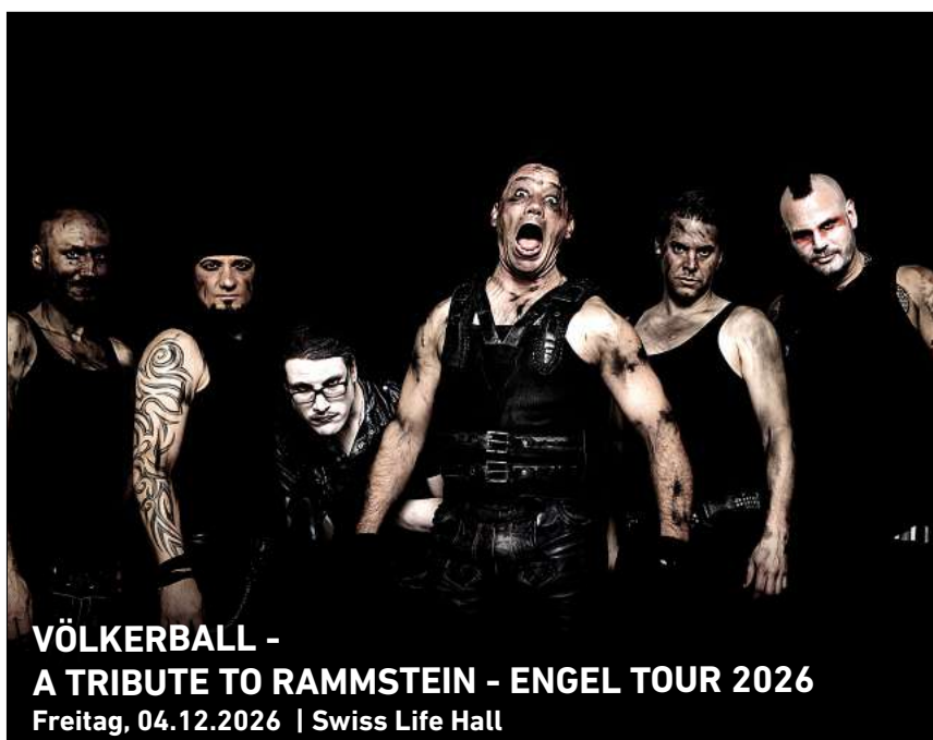
VÖLKERBALL - A TRIBUTE TO RAMMSTEIN - ENGEL TOUR 2026 Freitag, 04.12.2026 | Swiss Life Hall