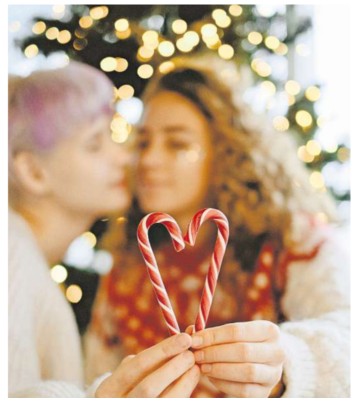
Wahlfamilie: Zum Fest der Liebe dürfen neue Familientraditionen etabliert werden.

Feiern mit der Wahlfamilie bedeutet oft, Traditionen zu ersetzen oder neue zu erfinden. Es bedeutet, einen Tisch zu decken, an dem Menschen sitzen, weil sie sich füreinander entschieden haben. Und vielleicht ist genau das die schönste Art, Weihnachten zu feiern: mit einem Kreis, der nicht durch Zufall oder ausschließlich durch genetische Abstammung entstanden ist, sondern durch gegenseitige Wärme, Respekt und das stille Wissen, dass Liebe viele Formen haben darf.