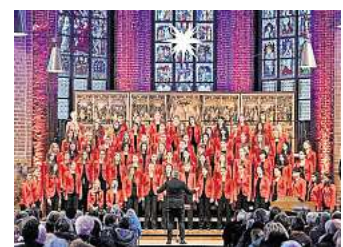
Der Mädchenchor Hannover gibt Adventskonzerte in der Marktkirche.

➤ Der Knabenchor Hannover und London Brass geben ihre traditionellen Adventskonzerte am 4., 5. und 6. Dezember, jeweils ab 20 Uhr in der Marktkirche, Hanns-Lilje-Platz 2. Am 7. Dezember beginnt am gleichen Ort das Familienkonzert um 15.30 Uhr. Tickets (ab 17,50 Euro) über knabenchor-hannover.de . R/H/R