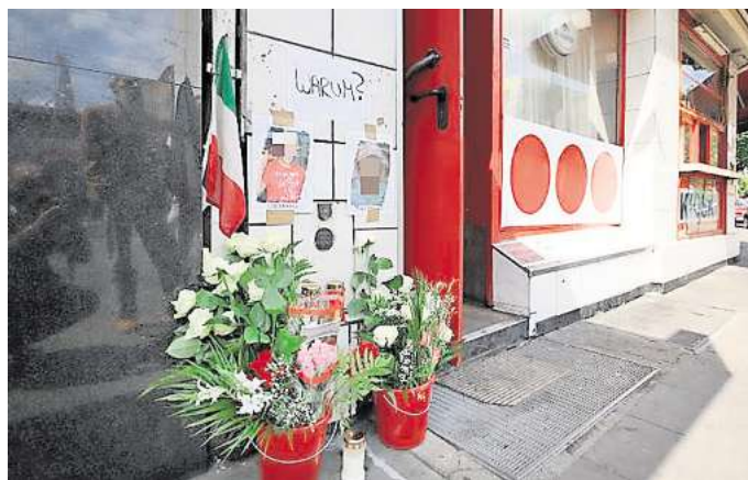
Tatort Steintor-Viertel: 2010 wurden die beiden Italiener Guiseppe L. und Francesco S. in der Columbus-Bar erschossen. Der Erfolgspodcast True Crime Hannover befasst sich in der Folge „Drei Schüsse für vier Sterne – Mord in der Columbus-Bar“ mit dem kaltblütigen Verbrechen.

Die Folge „Drei Schüsse für vier Sterne – Mord in der Columbus-Bar“ ist zu finden in der NP-App, unter www.neuepresse.de und überall dort, wo es Podcasts gibt – beispielsweise bei Spotify, Amazon oder Audible.