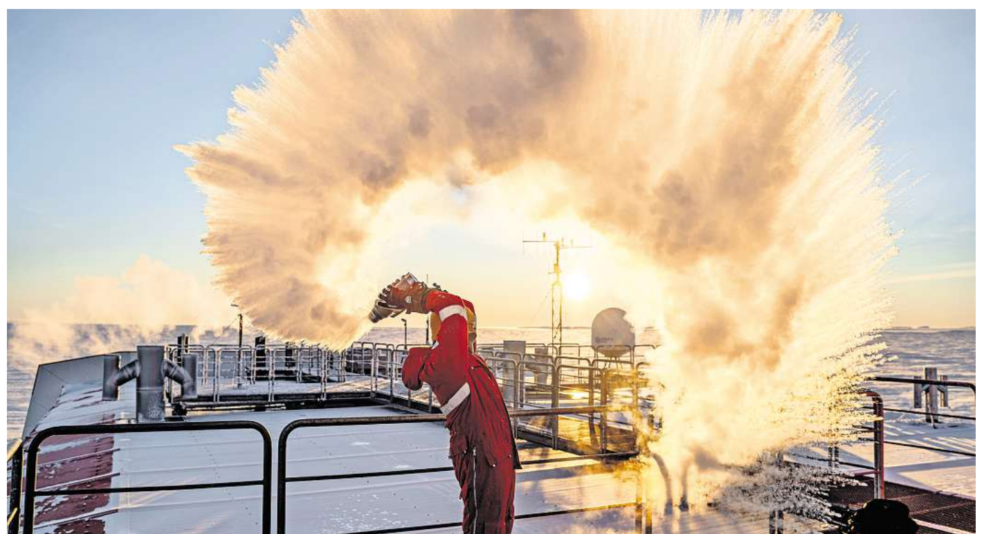
Schnee, selbst gemacht: Ein Kollege von Michael Trautmann leert in der Antarktis eine Kanne mit heißem Wasser in einem Schwung. Es gefriert sofort.

Derzeit arbeitet man an der Station mit Dieselmotoren, die als Blockheizkraftwerke laufen. Das sind bewährte LKW-Motore, die 24 Stunden am Tag mit Polardiesel laufen. Das ist ein spezieller Kraftstoff, der bei extremer Kälte nicht ausflockt. Wichtig ist es, auf simple und bewährte Technik zu setzen. Natürlich entstehen dabei Abgase, aber da die nächste Station 400 Kilometer entfernt ist, kann man deren Einfluss vernachlässigen. Es gibt auch ein Windrad, mit dem Strom erzeugt wird. Der Plan ist, den Anteil der Windkraft noch weiter auszubauen.