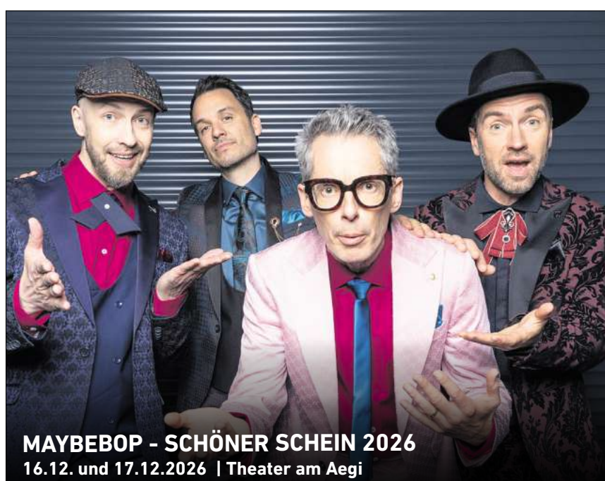
MAYBEBOP - SCHÖNER SCHEIN 2026 16.12. und 17.12.2026 | Theater am Aegi

Ihr persönlicher Ticketservice der HAZ & NP