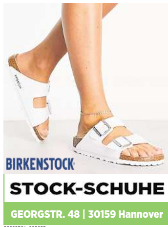
BIRKENSTOCK STOCK-SCHUHE GEORGSTR. 48 | 30159 Hannover 30309501_002625

NP-SPORTLERWAHL: Sie können schon abstimmen – und tolle Preise gewinnen!