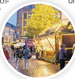
Weihnachtsmarkt an der Marktkirche.

Gleich nebenan steht ein Zirkuswagen, in dem eine Märchenzählerin Geschichten vorliest. Das geschieht täglich um 15.30 Uhr und um 16.30 Uhr und kostet nichts. Umsonst ist auch das Kasperlentheater vor dem Irish Pub. Täglich um 16, 17 und 18 Uhr können Kinder ein Abenteuer mit Kasper und seinen Freunden erleben. Wie man Weihnachtsgeschenke bastelt, erfahren Kinder am 30. November, 7. Dezember, 14. De-