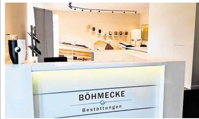
In den Räumlichkeiten an der Günther-Wagner-Allee ist auch eine Auswahl an Särgen und Urnen zu sehen.