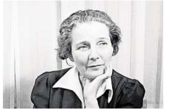
Eine Künstlerin wird wiederentdeckt: Käthe Steinitz.

HANNOVER. Das Sprengel Museum Hannover widmet der Künstlerin, Autorin und Kunstwissenschaftlerin Käthe Steinitz (1889–1975) erstmals eine umfassende Retrospektive. Unter dem Titel „Käthe Steinitz. Von Hannover nach Los Angeles“ werden bis zum 25. Januar 2026 rund 180 Werke aus sieben Jahrzehnten gezeitigt – darunter expressionistische Hinterglasbilder, Zeichnungen, Fotografien und Texte, die den Lebensweg der Künstlerin und ihr Schaffen und Wirken nachzeichnen. Erstmals werden zahlreiche fotografische Arbeiten präsentiert, die bislang nur als Negative überliefert waren. Begleitend zur Ausstellung erscheint im Hirmer Verlag eine Monografie. Sie ist Ergebnis eines Forschungsprojekts, das vom Niedersächsischen Ministerium für Wissenschaft und Kultur gefördert wird. Zudem vergibt die Landeshauptstadt Hannover erstmals den „Käthe Steinitz Preis für künstlerische Kollaboration“, der das vielseitige Schaffen der Künstlerin in die Gegenwart führt.