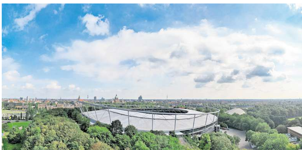
Möglicher Austragungsort: Olympische Fußballspiele könnten im Stadion am Maschsee stattfinden.