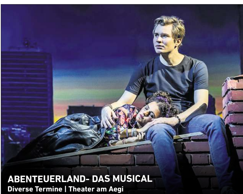
ABENTEUERLAND- DAS MUSICAL Diverse Termine | Theater am Aegi