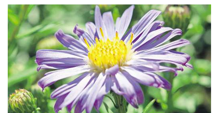
Robust: Die lila blühende Sorte „Twilight“ der Herzblatt-Aster eignet sich gut im Kampf gegen Unkraut.

Wenn die Wald-Aster ihre Samenstände bildet, steht die Sibirische Herbst-Aster ( Aster tataricus ) gerade in voller Blüte: Sie