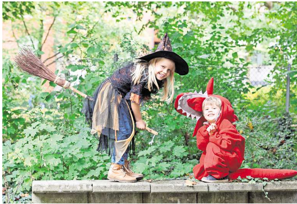
Liegen im Trend: Kostüme für kleine Hexen mit Zauberhut und Besen.

Doch nicht nur die Kinder feiern, auch unter den Erwachse-