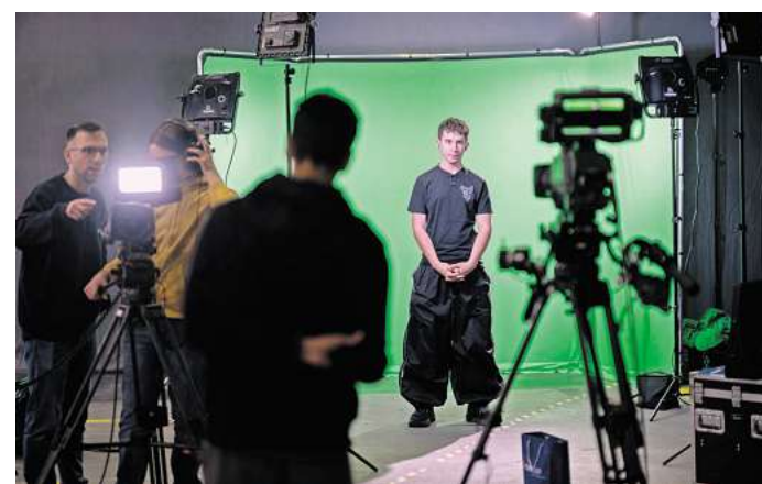
Beim Newscamp können Schülerinnen und Schüler auch die Arbeit am Mikro und vor der Kamera kennenlernen, etwa bei der Produktionsfirma TVN.