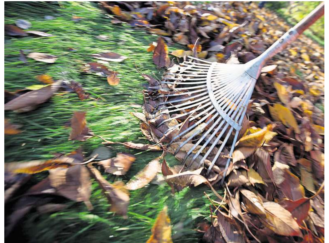
Herbstlaub sollte man regelmäßig vom Rasen entfernen, etwa mit einer Harke.

Denn: „Kurz geschnittener Rasen übersteht den Winter besser, er bleibt gesünder und zeigt sich im Frühjahr wüchsiger“, so Dahlmann. Mäht man den Rasen eher höher, legen sich nach Angabe der Deutschen Rasengesellschaft (DRG) die Gräser um – und es entsteht ein Mikro-