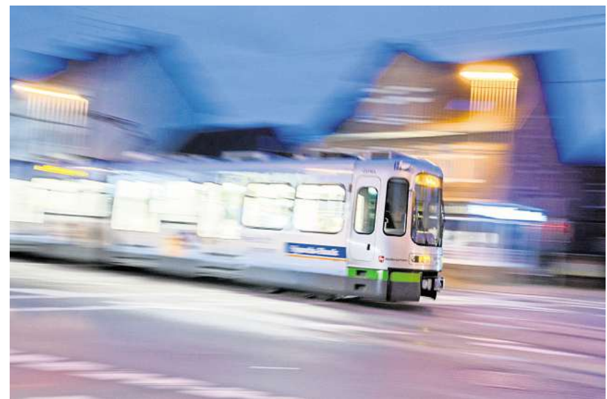
Bekommt die ADAC-Note „sehr gut“: Der nächtliche Nahverkehr in der Region Hannover.

Der zweite Aspekt führt auch direkt zur nächsten Paradedisziplin des Nahverkehrs in der Region Hannover. Laut Automobilclub beträgt die Reisezeit „zwischen 16 und 31 Minuten, die Umsteigezeiten und Fußwege sind mit maximal neun Minuten sehr kurz oder fallen gar nicht erst an“. Das alles führe letztlich zum Gesamtfazit „sehr gut“ beim ADAC-Nahverkehrstest.