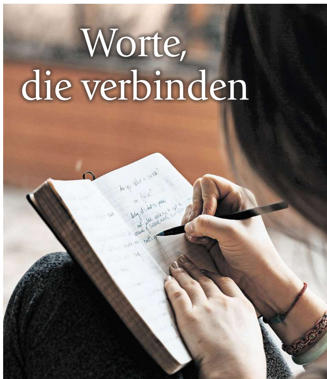
Kreatives Schreiben ist ein Aspekt des WortLaut-Festivals, das Lust auf das Experimentieren mit Sprache macht.