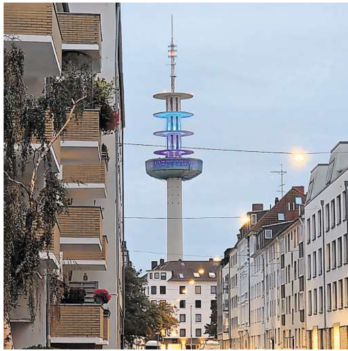
Der ehemalige VW-Turm, der alte Fernsehturm Telemoritz hinterm Hauptbahnhof Hannover, war kürzlich mehrere Nächte lang in unterschiedlichen Farben angestrahlt.

Die Stadt hat das Bauwerk daraufhin flugs unter Denkmalschutz gestellt. Gekauft hat ihn dann der Unternehmer Oliver Blume, der am Turmschaft etwa 150 Miniapartments bauen und Teile der Plattformen öffentlich zugänglich machen will. Derzeit laufen aber noch die Planungsabsprachen mit der Stadt.