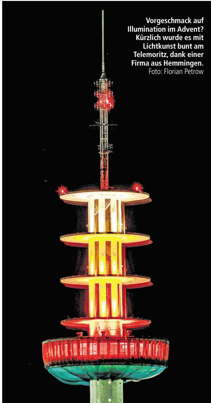
Vorgeschmack auf Illumination im Advent? Kürzlich wurde es mit Lichtkunst bunt am Telemoritz, dank einer Firma aus Hemmingen.

Hemminger Eventfirma bringt die ILLUMINATION DES TELEMORITZ in der Adventszeit ins Gespräch