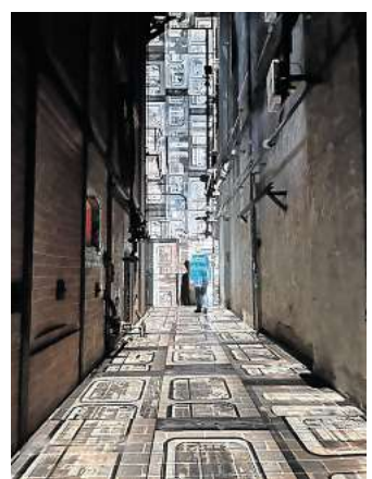
Anne Nissen & Steffen König: „Cluster“.