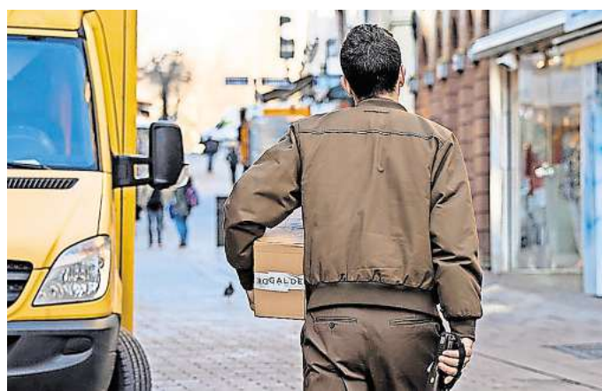
Viele Pakete, aber nur wenig Platz: In Hannover-Mitte werden jetzt Ladezonen eingerichtet, um das Parken in zweiter Reihe zu unterbinden.

Vor allem an der Situation in der Lange Laube hatte es immer wieder Kritik gegeben. Sie ist eine Fahrradstraße, seit April ist