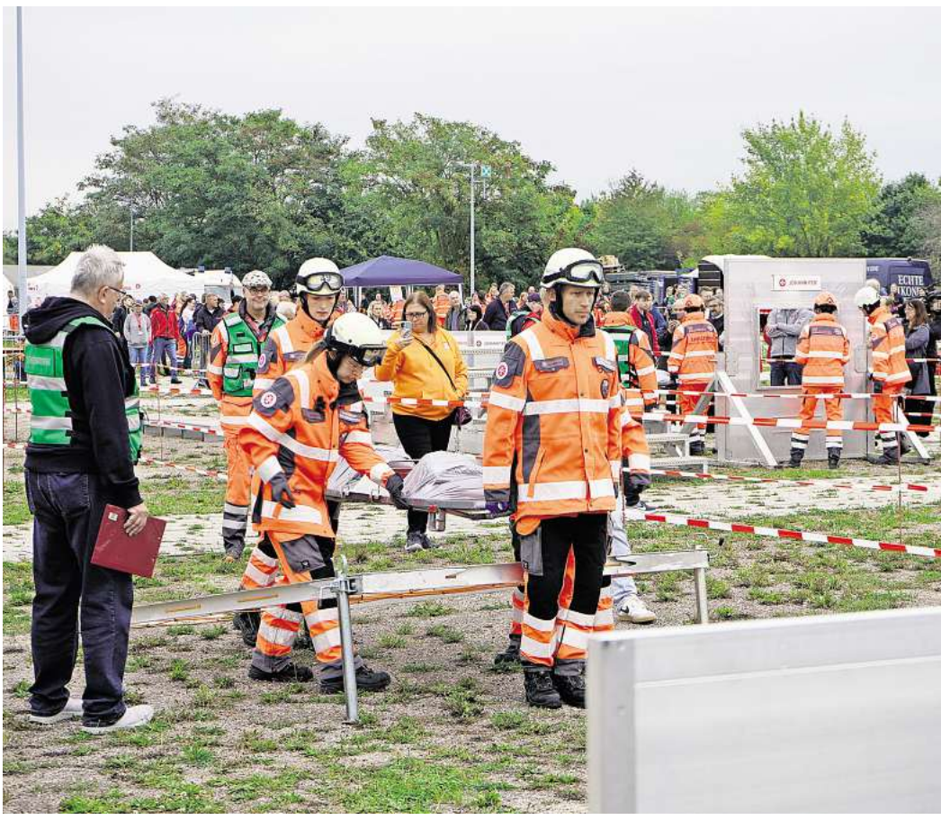
Bei den „Olympischen Spielen des Rettens“ holte die hannoversche Rettungshundestaffel sich die Goldmedaille.