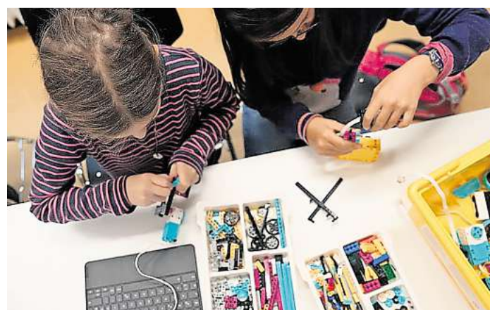
Gemeinsam werden unter anderem LEGO Spike Prime Modelle gebaut.

kunft“ von 10 bis 16 Uhr in der Kinder- und Jugendbibliothek Südstadt, Schlägerstraße 36 c, wo kleine Roboter und Visionen einer Bibliothek von morgen kombiniert werden. In der Zentralbibliothek, Hildesheimer Straße 12, startet um 14 Uhr „Lego Spike Prime und Scratch“, bei dem Modelle gebaut und programmiert wer-