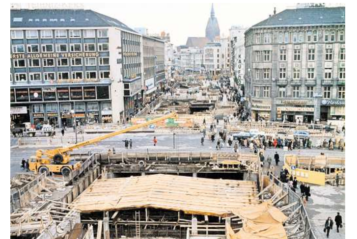
Die Bahnhofstraße Richtung Kröpcke im Jahr 1974: In der Baugrupe entstehen U-Bahn-Haltestelle und die Passerelle.

Wendepunkt. „Alles Neu!“ lädt dazu ein, diesen prägenden Abschnitt Hannovers nicht nur historisch einzuordnen, sondern auch mit heutigen Stadtent-