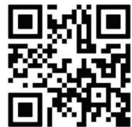
Dieser QR-Code führt dich zum aktuellen HGA U25.