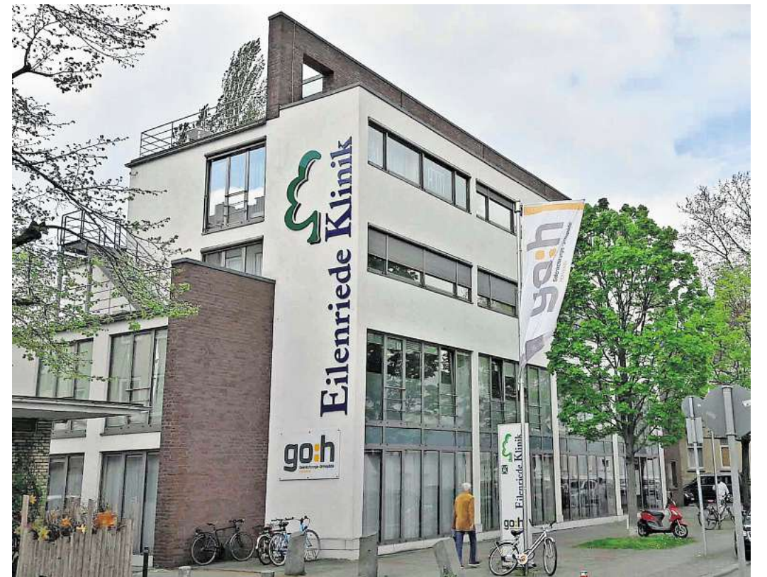
Neue Nutzung: Die Stadt hat die Immobilie der ehemaligen Eilenriede Klinik gekauft. Über den Preis machte die Stadt keine Angaben.

eine Perspektive, um wieder Fuß fassen zu können, heißt es im Rathaus.