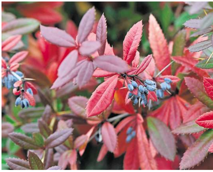
Die Berberitze: Im Herbst begeistert sie mit farbenfrohem Laub und bietet Vögeln Schutz sowie Nistmöglichkeiten. Eine Heckenpflanze, die erst bei tieferen Temperaturen das Laub abwirft.