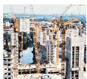
Ihme-Zentrum im Bau, 1973.

Zwischen 1965 und 1975 erlebte Hannover einen tiefgreifenden Wandel. Bevölkerungswachstum und wirtschaftlicher Aufschwung erforderten mutige Bauprojekte, die bis heute das Stadtbild prägen. So entstanden neue Stadtteile wie der Mühlenberg oder das Ihme-Zentrum, die moderne Vorstellungen von Wohnen und Arbeiten verbinden sollten. Parallel dazu wurde der U-Bahnbau vorangetrieben, der die Innenstadt mit den wachsenden Außenbezirken verband.