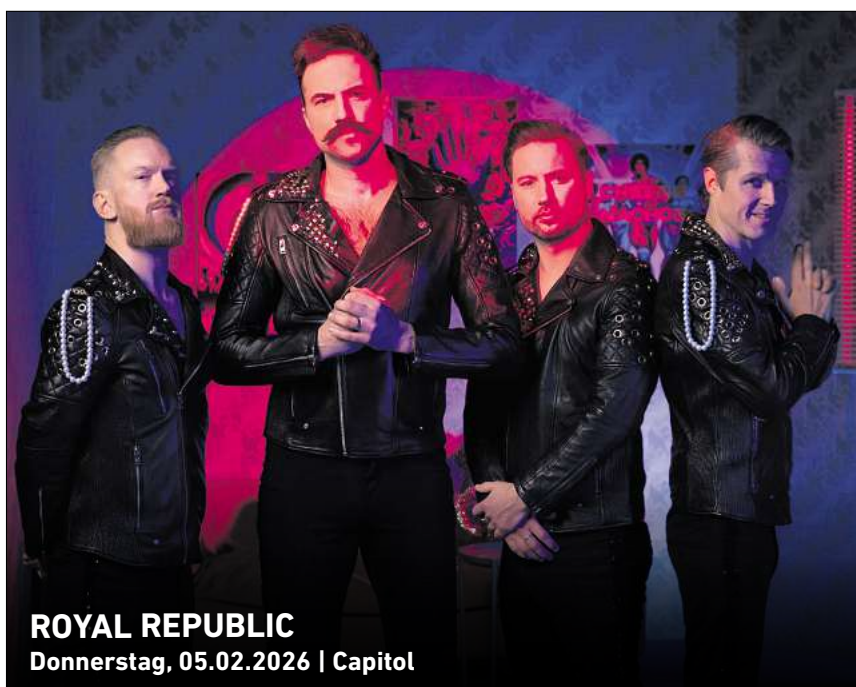
ROYAL REPUBLIC Donnerstag, 05.02.2026 | Capitol