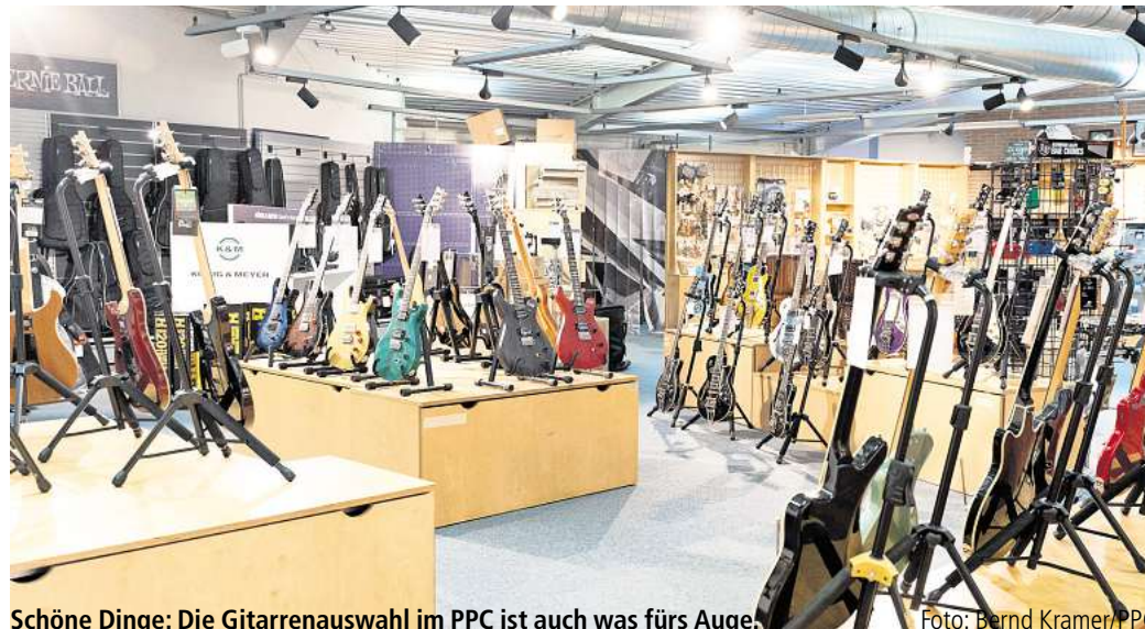
Schöne Dinge: Die Gitarrenauswahl im PPC ist auch was fürs Auge.

Die Räume unten, in denen früher Tasten, Blas- und Perkussionsinstrumente verkauft wurden, sind nach Corona auf- und abgegeben worden. Ja, die Pandemie hat der Kultur richtig wehgetan, auch den Zulieferern der stillgelegten Kunstlerschaft. Und nun haben die PPC-Ge-