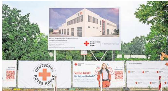
Soll Ende 2026 fertig sein: Das DRK bringt an der Zeißstraße 79 eine Rettungswache, die Verwaltung und ein Bevölkerungsschutzzentrum unter ein Dach.

Der Pachtvertrag für die bisherige Rettungswache an der Zeißstraße 15 läuft aus, nur 900 Meter entfernt wurde ein Baugrundstück gefunden. Der Betrieb im alten Gebäude läuft parallel zu den Bauarbeiten weiter. Am 14. August war Grundsteinlegung, Ende 2026, spätestens Anfang 2027 soll die neue Rettungswache fertig sein. 60 Mitarbeitende im Rettungsdienst werden dort beschäftigt sein. Platz ist auch für drei Rettungswagen, einen Notfallkrantransporter und drei Krantransportwagen.