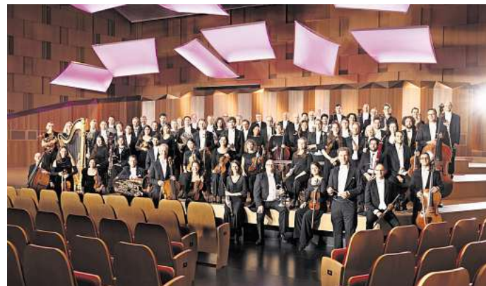
Die NDR Radiophilharmonie präsentiert unter anderem Werke von Giacomo Puccini und Peter Tschaikowsky.

Wegen der sehr begrenzten Anzahl von Parkplätzen direkt vor dem Neuen Rathaus wird die Anreise mit Bus und Bahnen dringend empfohlen. Die nächstgelegenen Stadtbahnstationen sind Aegidientorplatz und Markthalle/Landtag. Die Buslinien 100/200/800 halten an den Haltestellen Rathaus/Bleichstraße und Maschsee/Sprengel Museum, die Linie 120 an der Haltestelle Rathaus/Friedrichswall.