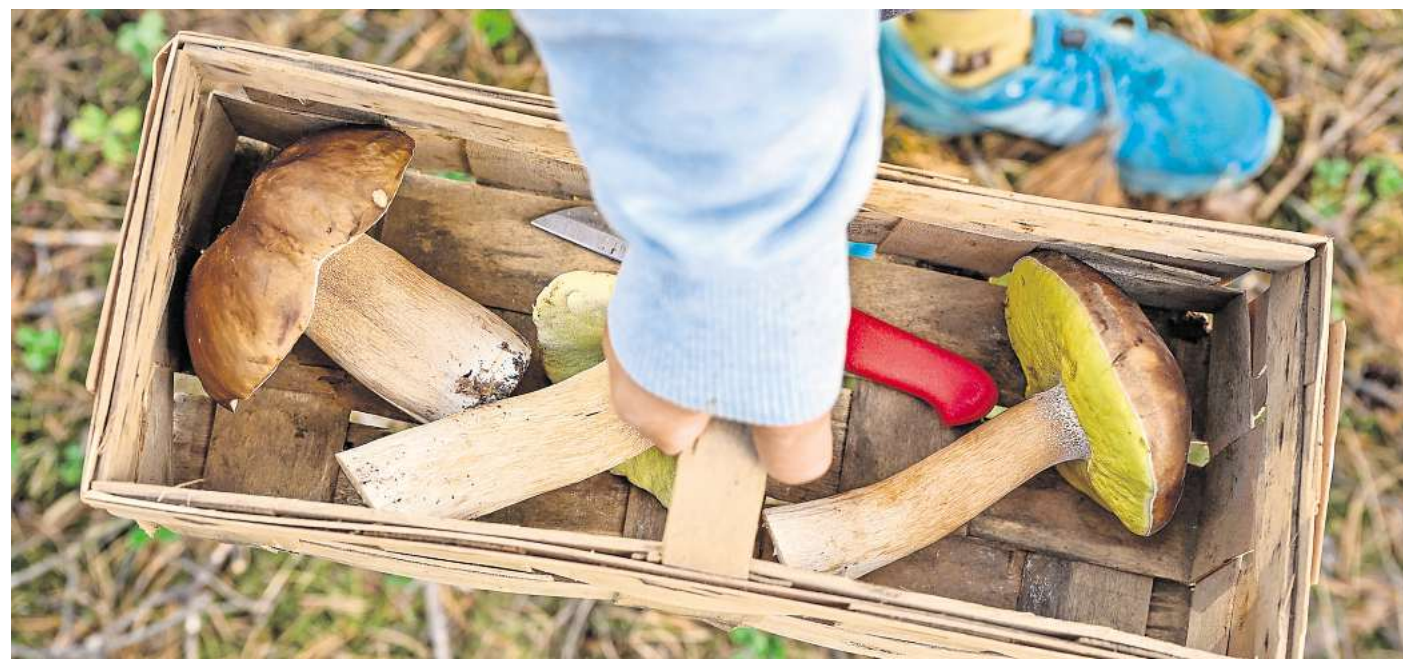
Auf Streifzug durch den Wald: Die Saison für Pilze hat begonnen – der regenreiche Juli hat seinen Teil dazu beigetragen.

In Naturschutzgebieten ist es untersagt, die Wege zu verlassen oder Pilze zu sammeln. Das gilt zum Beispiel in der Herrschaft bei Uetze oder in Teilen des Bockmerholzes südlich von Wülferode. Letzteres gilt als Relikt des „Nordwaldes“, der