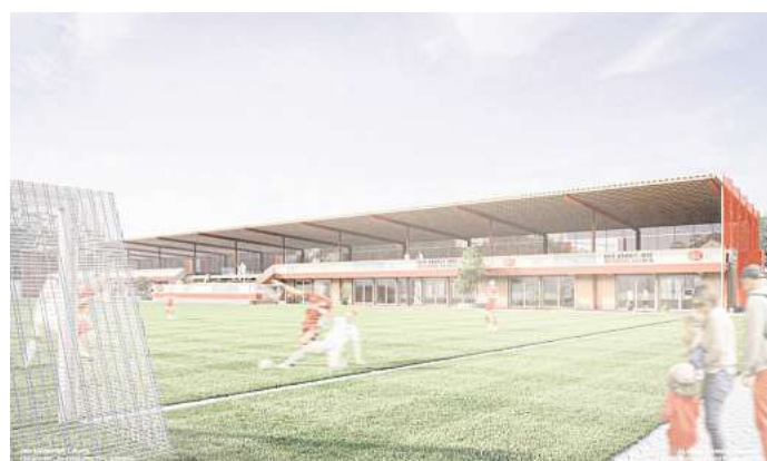
Deutliche Aufwertung: Der OSV Hannover plant für seine Sportanlage statt einer reinen Zuschauertribüne einen Multifunktionsbereich. Visualisierung: Hinz/Offe/Schmanns/ Vogt/Leibniz Universität Hannover

Er vergleicht das noch stehende Tribürendach mit dem „Charme eines aufgegebenen Hochregallagers“. Bis zu fünf neue Übungsräume, vier neue Mehrzweck Courts, Umkleidebereiche und Sanitäranlagen sollen auf einer doppelstöckigen Fläche auf etwa 2000 Quadratmetern unterkommen. „Die Feinplanung des Konzeptes steht kurz vor dem Abschluss“, sagt Spiekermann. Da die Bezirkssportanlage Bothfeld