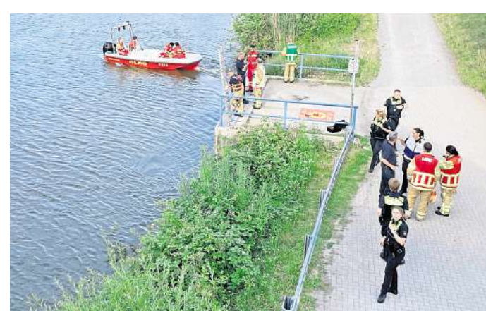
Mehr Aktive mit weniger Zeit: DLRG-Kräfte suchen im Mittellandkanal bei Hannover nach einer mutmaßlich vermissten Person.

2024 sind in Niedersachsen 46 Menschen ertrunken, 52 Prozent davon in Seen und