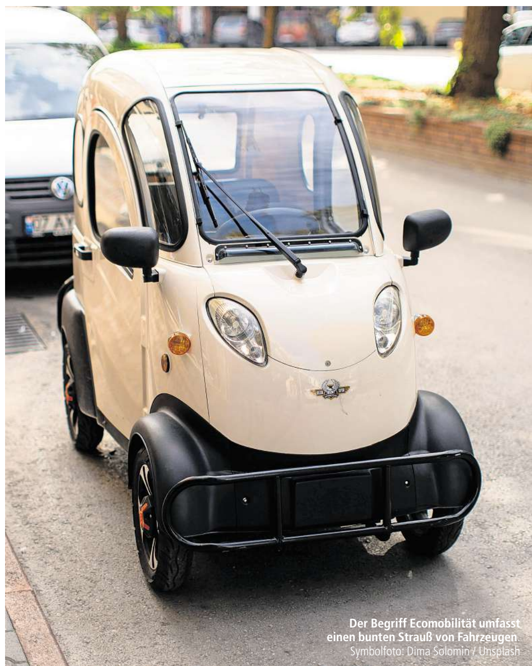
Der Begriff Ecomobilität umfasst einen bunten Strauß von Fahrzeugen.

folgt: „Sie wird künftig elektrisch sein.“ Lieferdienste können damit die letzte Meile von zentralen Depots zurücklegen und Familien Einkäufe erledigen und die Kinder zur Kita bringen.