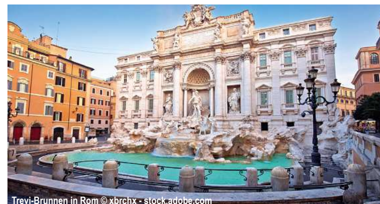
Trevi-Brunnen in Rom