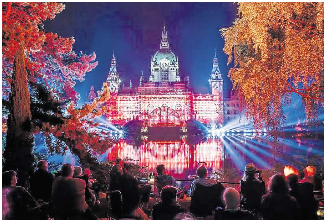
Im Maschpark lädt das Klassik Open Air zum Picknickkonzert bei freiem Eintritt.