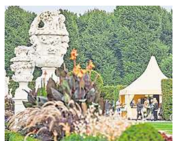
Sommerfest in den Herrenhäuser Gärten

▶ Der Kulturtreff Vahrenheide und Stadttreff Sahlkamp haben für das Stadttreff am Märchensee ein tolles Kulturprogramm für alle Generationen zusammengestellt. Am Sonntag