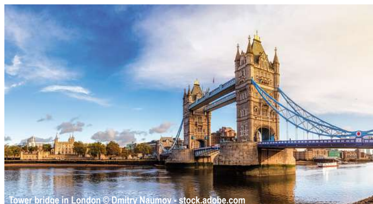
Tower bridge in London