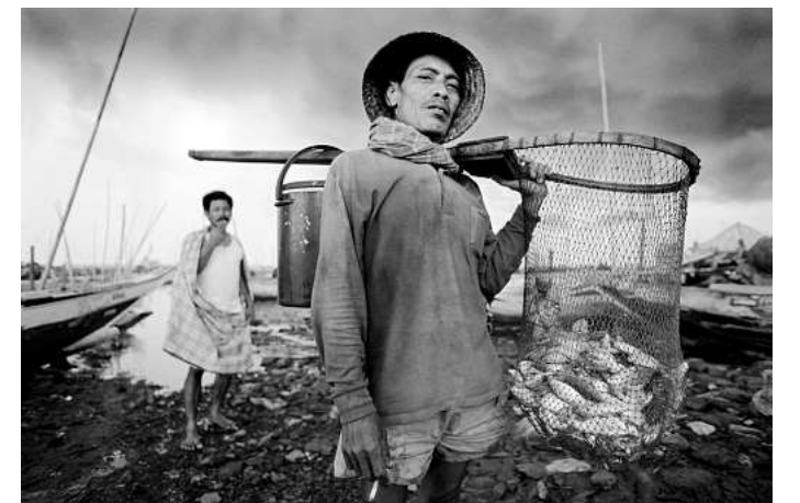
1998: Ein Küstenfischer aus Gresik nahe Surabaya.

sie über alle Sprach- und Kulturbarrieren hinweg, ob nun auf den Abwrackwerften im indischen Alang, den Fischerinseln in der indonesischen Sulawesi-see oder bei den Laven-Fischern in Wales. Die GAF, Seilerstraße 15 d, ist Donnerstag bis Sonntag jeweils von 12 bis 18 Uhr geöffnet. Der Eintritt ist frei. RED