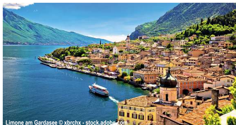
Limone am Gardasee