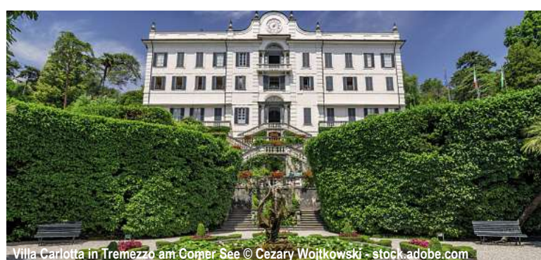
Villa Carlotta in Tremezzo am Comer See