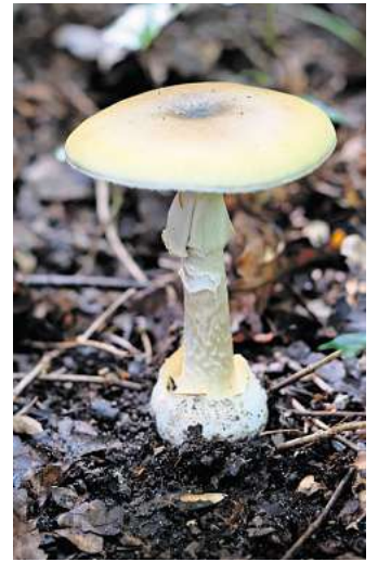
Der gefährlichste Giftpilz: Den Grünen Knollenblätterpilz erkennt man an der sackartigen Ausstülpung an der Stielbasis. Er ist für 90 Prozent aller tödlichen Vergiftungen verantwortlich.

Auch der Klimawandel zeige seine Folgen, Krajewski stellt sich darauf ein: „Die Pilzwelt wird vielfältiger und gefährlicher, weil neue Arten heimisch werden. Deshalb bilde ich mich ständig fort.“