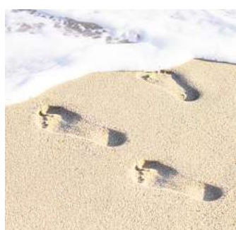
Schon 7000 Schritte genügen für ein gesünderes Leben.

Auch schon eine kleinere Steigerung der Aktivität, etwa von 2000 auf 4000 Schritte, verringert das Risiko, früh zu sterben um 36 Prozent. Und schon ab 2517 Schritten pro Tag zeigen sich gewisse positive Auswirkungen. Diese können bereits durch einen zwanzigminütigen Spaziergang erreicht werden.