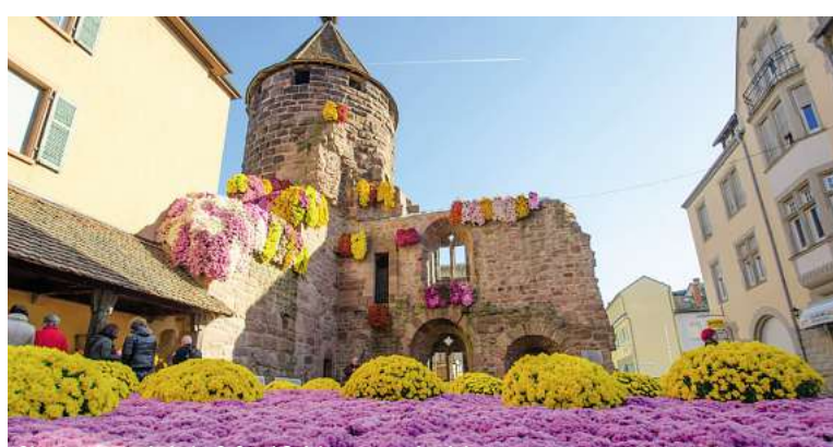
Chrysantheme in Lahr