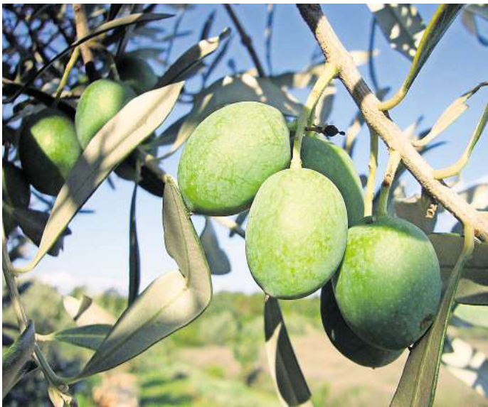
Der Olivenbaum hat seinen Ursprung im Mittelmeerraum.

Auch ein Schutz im Freiland ist möglich, aber aufwendig. Man kann den Olivenbaum mit Vlies einwickeln. Der Temperaturunterschied beträgt ein paar Grad. Wichtig ist, dass man die