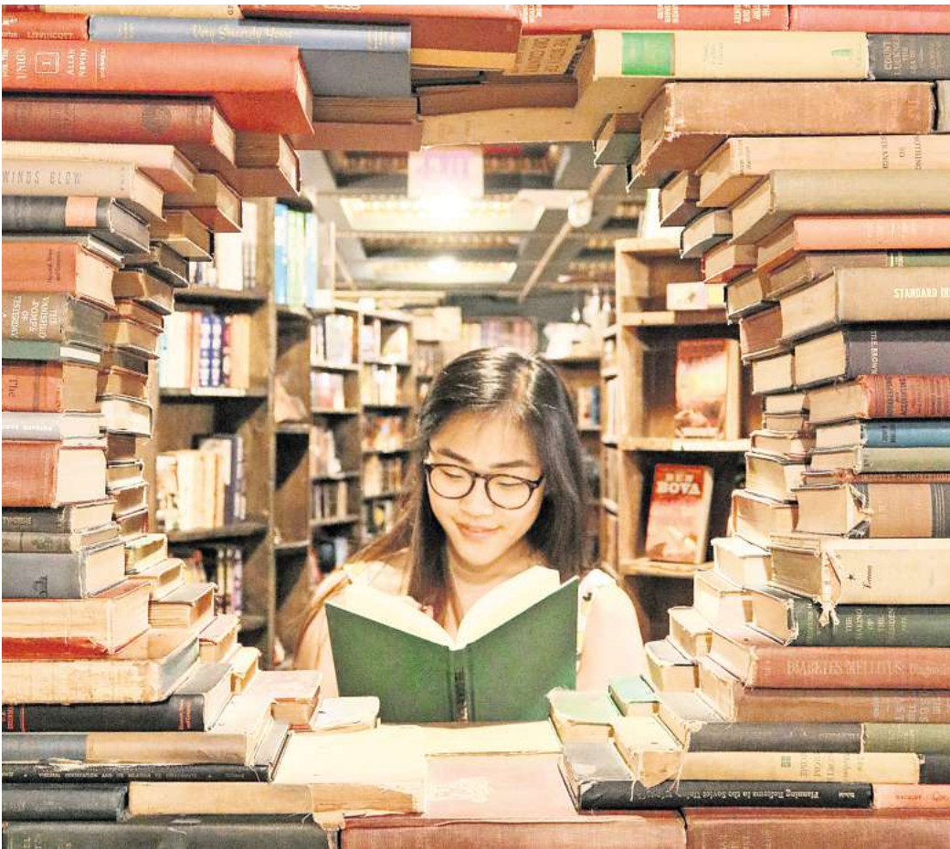
Lesespaß und Aktionen für Kinder und Jugendliche von 11 bis 14 Jahren: Der JULIUS-Club lässt in den Sommerferien keine Langeweile aufkommen.

► Für die Jüngsten lädt das Bei Chez Heinz am Sonntag, 29. Juni, ab 14 Uhr zur großen Kinder- Sommer-Party aufs Freigelände ein. Neben der beliebten Kinder- Disko stehen Hüpfburg, Plansch- becken, Karaoke, Bällebad und