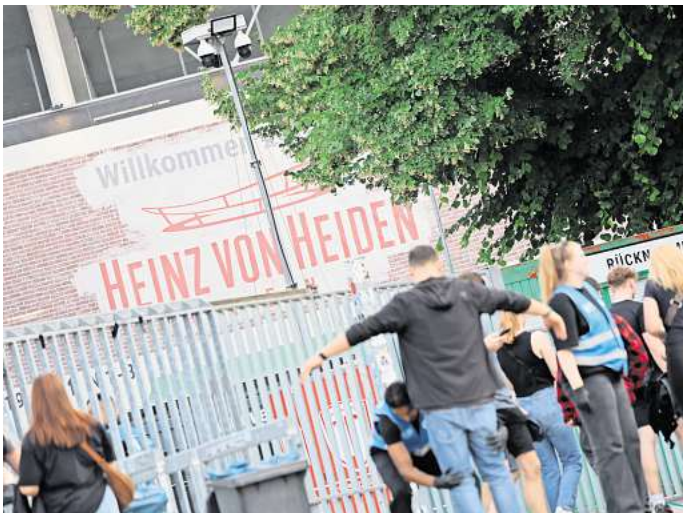
Mehr Sicherheit: Hannover Concerts setzt seit diesem Jahr auf Kameraanlagen – unter anderem bei dem Linkin-Park-Konzert in der Heinz von Heiden Arena.

Der Konzertveranstalter Hannover Concerts überwacht seit diesem Jahr Veranstaltungen mit Kameraanlagen. Das soll Straftaten verhindern und aufklären.