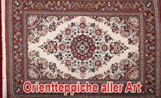
Orientteppiche aller Art