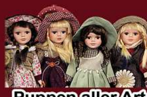
Puppen aller Art