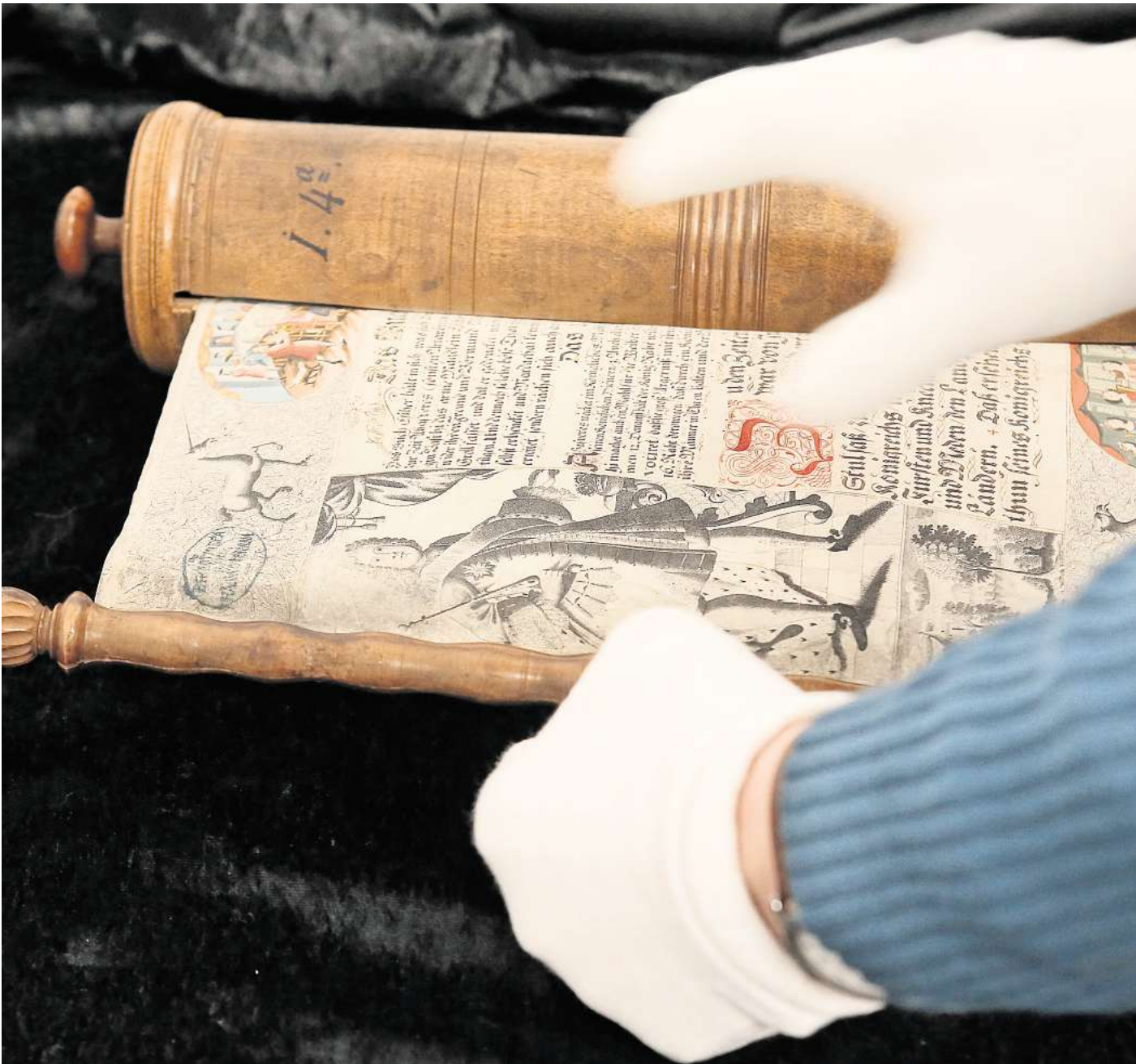
Prächtig illustriert: Die Esther-Rolle von 1746 wird nur selten gezeigt – jetzt ist sie in der Leibniz-Bibliothek zu sehen.

liothek ist – passend zur Geschichte – mit springenden Hirschen und Musikanten in Narrenkostümen illustriert. Das in Hildesheim gefertigte Stück gilt als herausragendes Zeugnis jüdischer Kultur.