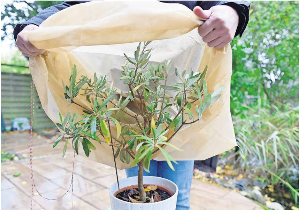
Vor Frost geschützt: Im Winter kann man den Olivenbaum mit Vlies einwickeln.

Die Ursachen für gelbe Blätter an der Olive sind vielfältig. Sie reichen von Nässe über Nährstoffmangel bis hin zu Pilzkrankungen. Wenn ab und zu ein paar Blätter gelb werden und herunterfallen, muss man sich keine Sorgen machen. Wenn aber