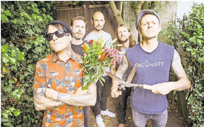
Die Donots rocken am Freitag das Fährmannsfest.