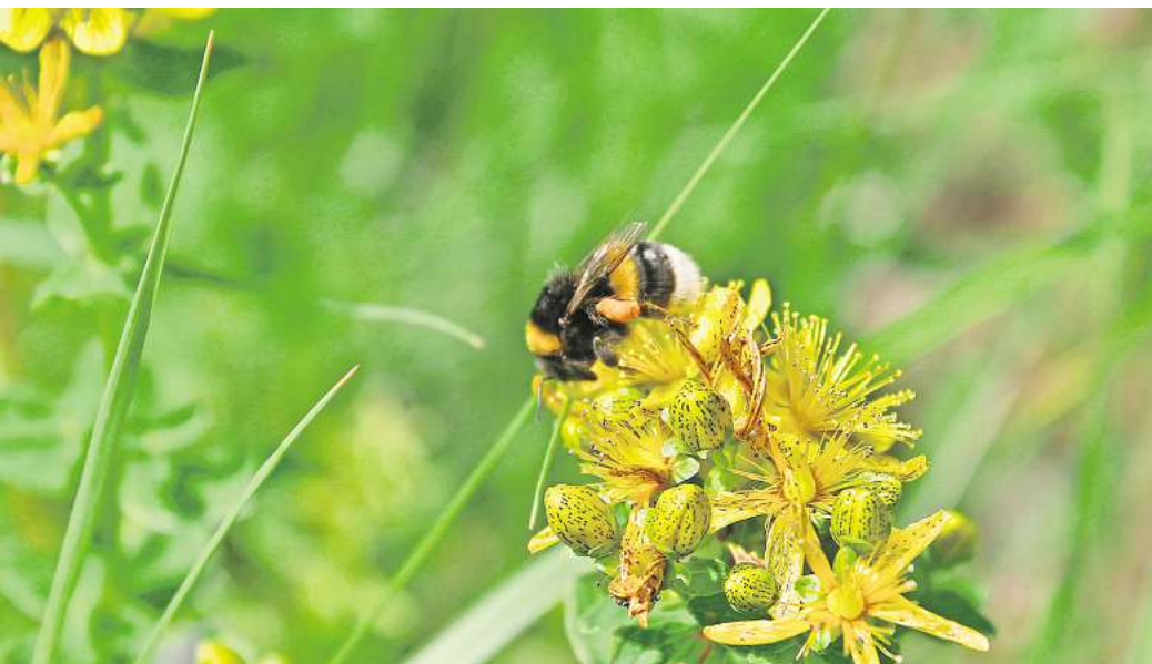
Eine blühende Wiese bietet Insekten Nahrung.

Bis zur üppigen Blütenpracht kann es eine Weile dauern. Anfangs weist die Blühfläche vielleicht noch ein paar Lücken auf und nicht alle Arten blühen auf Anhieb. Die Pflanzen wachsen aber von Jahr zu Jahr dichter. Überhandnehmende Arten kann man dann etwas ausdünnen. Die Wiese sollte man ansonsten möglichst nicht betreten. Nur einmal im Jahr muss man sie mähen – am besten im Frühjahr mit einer Sense statt mit einem Rasenmäher.