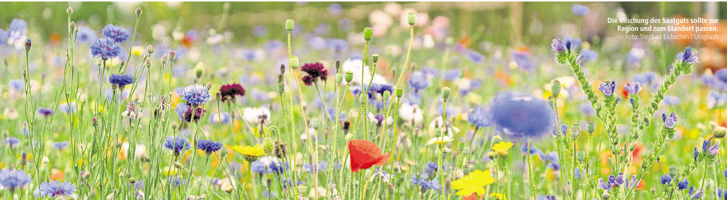
Die Mischung des Saatguts sollte zur Region und zum Standort passen.