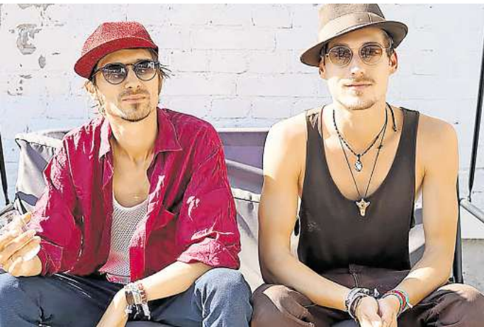
Am 28. Juni zu hören: Tanga Elektra.

Israel, Österreich und der Türkei, Niger und Brasilien, Venezuela und Kolumbien, den USA, Mali und Rumänien musizieren auf der Hauptbühne. Zauberer, Clowns und Comedians sorgen für Spaß auf der Familienbühne, im Foyer der Gedenkstätte und bei Neues Leben e.V. sind Caféhaus-Musik, jüdische Lieder und