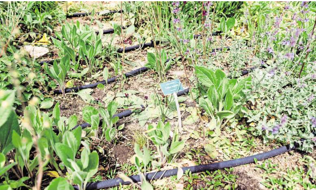
Tröpfchenschläuche bewässern gezielt am Boden, ohne Wasser zu verschwenden.