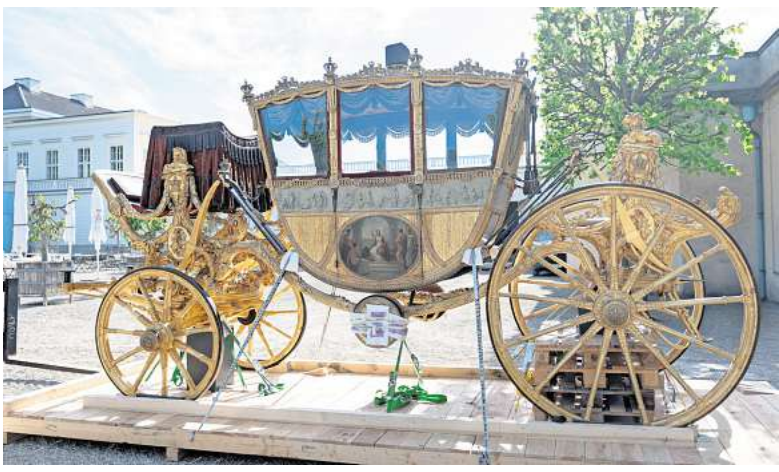
Die goldenen Kutschen, stets von vielen Besuchern in der großen Kutschenhalle des Museums bewundert, zeigt die Stadt künftig im Schlossmuseum Herrenhausen.

Eines der beliebtesten Ausstellungsstücke des Museums wird in etwa drei Wochen der Öffentlichkeit präsentiert. Die goldenen Kutschen, stets von vielen Besuchern in der großen Kutschenhalle des Museums bewundert, zeigt die Stadt künftig im Schlossmuseum Herrenhausen. Vor einigen Wochen sind die Prachtkarossen der Welfen in einem Lastwagen von der Altstadt nach Herrenhausen transportiert worden.