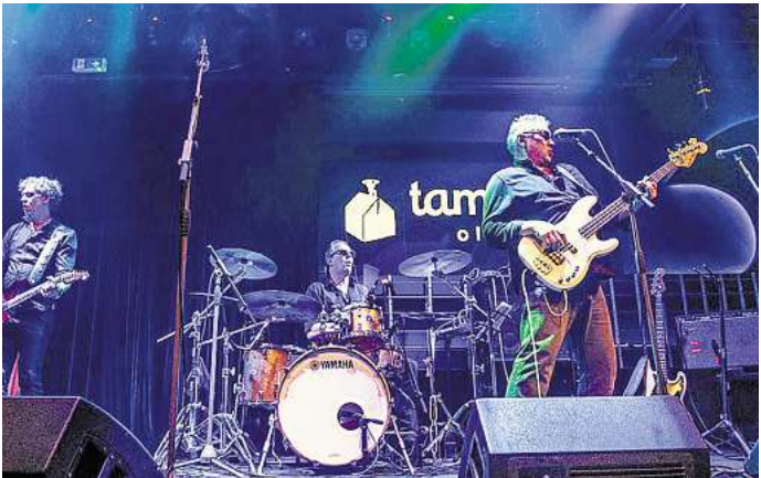
Das Baltic Rock Project live im Tamsta Club Vilnius.

Im Herbst ist bereits eine Show im Vandenis Club in Palanga