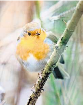
Die Anzahl der Gartenvögel, wie hier des Rotkehlchens, hat sich in den letzten Jahren immer mehr verringert.