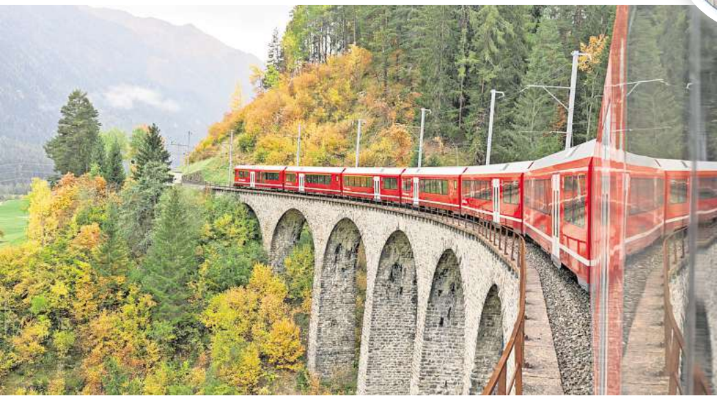
In der Schweiz kommen 98,6 Prozent der Fernzüge pünktlich an ihr Ziel.

Zweite in der Schweiz. Der nächste Schritt, so beschloss die schweizerische Regierung gerade, soll nun der Aufbau einer einheitlichen Infrastruktur sein, um die Mobilitätsdaten einfacher auszutauschen. Sie soll nicht auf den Bahnverkehr beschränkt sein, sondern schrittweise Privatverkehr, Parkhäuser, den öffentlichen Nah- und Fernverkehr, aber auch Fuß- und Fahrradverkehr besser vernetzen. Eine universale Mobilitäts-App sozusagen. Ein Fehler plöppte jüngst allerdings selbst bei den Schweizern im System auf. „Ihr Zug wird circa 65.766.691 Minuten später abfahren“, warnte eine automatisch generierte Durchsage. Versehen! War das Jahr 1900 hinterlegt worden.