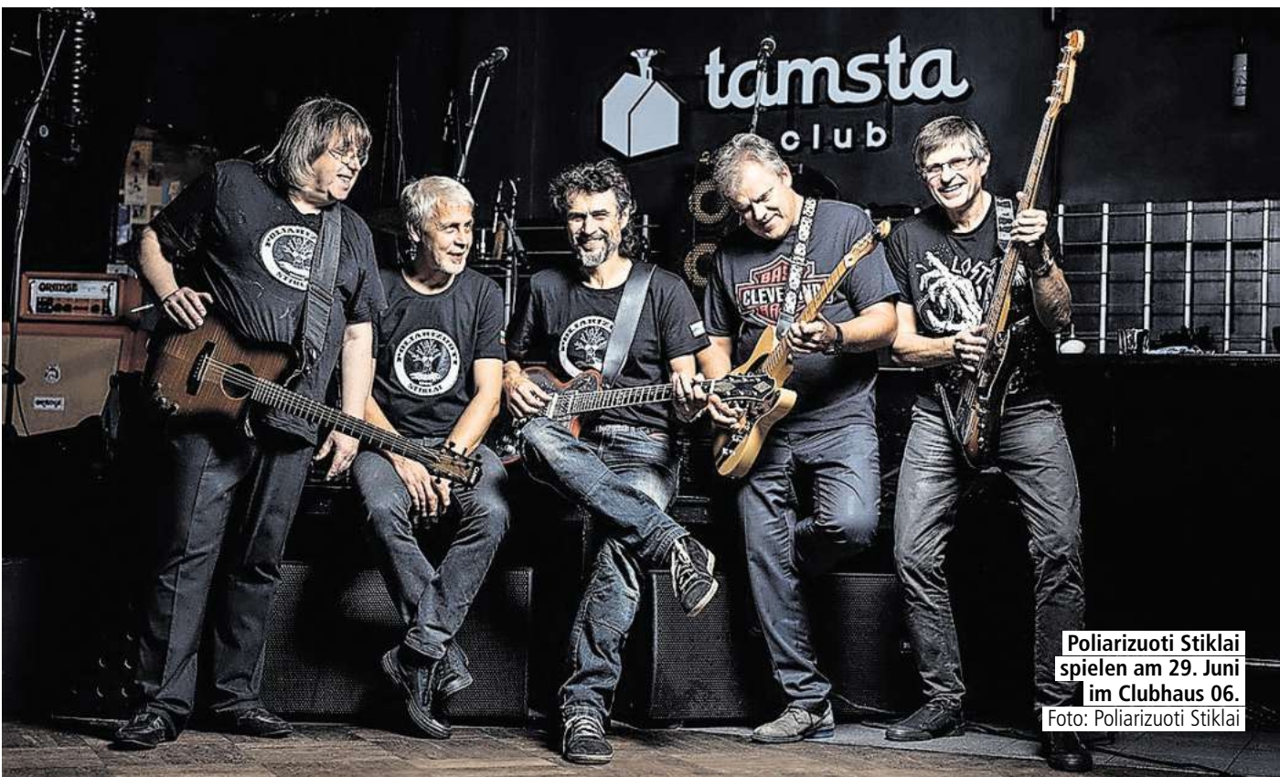
Poliarizuoti Stiklai spielen am 29. Juni im Clubhaus 06.

Gesagt getan. Das Baltic Rock-Project war mittlerweile schon in Litauen und hat dort im wohl bekanntesten Rock-Club des Landes, dem Tamsta Club in Vilnius, und an einem weiteren Ort gespielt. Die Musiker von Poliarizuoti Stiklai treten im Juni ihren Gegenbesuch an und werden am 28.6. eine Open-Air-Show in