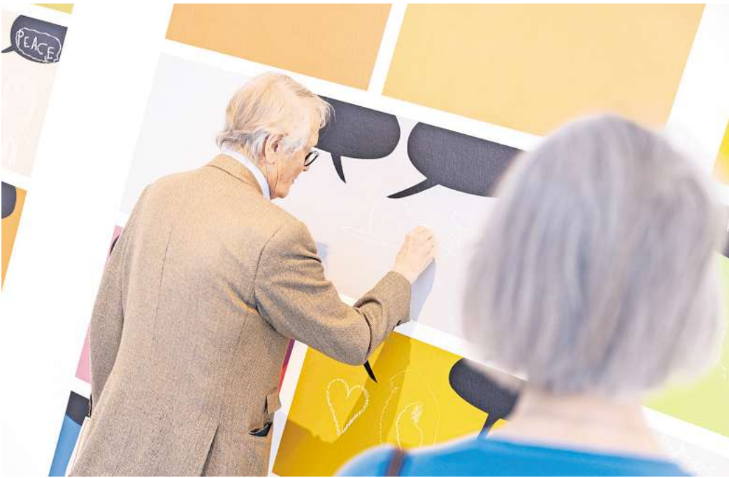
„Eine Ausstellung für Kinder (und andere Leute)“ im Kunstverein zeigt Kunstwerke, die durch Interaktion und die künstlerischen Beiträgen der Gäste besonders interessant werden. Hier: Rivane Neuenschwanders „Zé Carioca and friends (The Abduction of the Maiden)“, 2004.

Im Museum Wilhelm Busch geht es auf Blitzführungen durch die aktuellen Sonderausstellungen oder in die Sammlung des Hauses, von Wilhelm Busch bis zum Comic. „Nicht nur gucken sondern selber machen“, heißt es