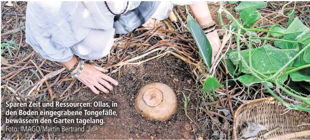
Sparen Zeit und Ressourcen: Ollas, in den Boden eingegrabene Tongefäße, bewässern den Garten tagelang.

Einzelpersonen könnten auch etwas gegen die schwindenden Plätze für Vögel tun. Für Vögel ist es gut, wenn viele verschiedene Lebewesen im Garten vorkommen. „Ohne Vegetation keine Insekten und Kleintiere und ohne diese keine Vögel und Säugetiere. [...] Ideal sind wilde, unordentliche Gartenecken“, so die Beschreibung von Bosch. Der Garten kann auch zum Vorteil von Vögeln gestaltet werden. Nisthilfen und Wasserstellen seien von Vorteil. Katzen sollten außerdem während der Brutzeit drinnen gehalten werden.