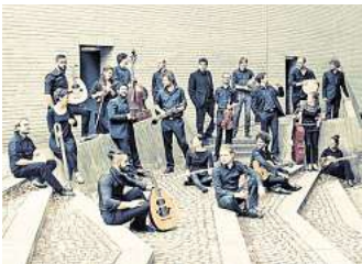
Asamura Ensemble

Friedrich Händel. Im Hofsaal präsentiert das Flex Ensemble Werke von Mozart und Brahms, danach gibt es unter anderem vierhändiges Klavierspiel nach Samuel Barber vom Duo Ion-Yilmaz und Bach-Interpretationen der Hannoverschen Hofkapelle (20 Uhr). „Transkulturelle Bach-Neudeutungen zu Klangmosai-ken“ stehen auf dem Programm des Asamura Ensemble, das Klassik weiterdenkt und unter Berücksichtigung kultureller Zugehörigkeit und Diversität neu und innovativ erlebbar machen