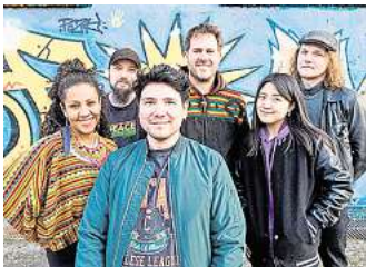
Live: Peace Development Crew

Energie und mitreißenden Büh-nepresenz bringt sie den karibi-schen Groove mit viel Bass und Elektronik in die Stadt. Gesungen und gerappt mit deutschen, eng-lischen und spanischen Texten, liefert die Band tanzbaren Roots Reggae ab, der gerne auch mal durch Ska, Jungle, Dub, Hip Hop, Latin und Dancehall schweift. Der letzte Standort für Mobi Rick ist dann vom 19. bis 22. Juni, jeweils von 15 bis 18 Uhr, auf dem Dor-mannplatz. Der Eintritt ist frei, die Teilnahme ohne Anmeldung möglich. R/H/R