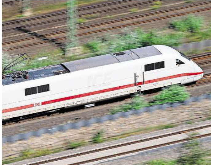
Die Deutsche Bahn (DB) beginnt noch in diesem Jahr mit ihren geplanten Generalsanierungen. Mit diesem großen Infrastrukturprogramm sollen nach und nach hoch belastete Abschnitte des deutschen Schienennetzes zu Hochleistungsstrassen ausgebaut werden.

Pferdeturm Zu den Generalsanierungen auf den Strecken kommen zudem Maßnahmen an Bahnhöfen. So soll der Hauptbahnhof in Hannover ausgebaut werden, um dem geplanten Hochleistungsnetz gewachsen zu sein. Noch bis in diesen Sommer hinein – knapp zwei Jahre länger als ursprünglich geplant – dauert die Sanierung des ersten und zweiten Bahnsteigs. Parallel laufen die Arbeiten an den Bahnsteigen 3 und 4. Nach und nach sollen alle Gleise modernisiert werden. Die Bahn will bis Mitte der 2030er-Jahre zudem zwei zusätzliche Gleise bauen, um mehr Zugverkehr über abwickeln zu können. Die Planungen haben begonnen. Parallel laufen Sanierungsarbeiten an den Brücken rund um den Hauptbahnhof sowie Modernisierungsarbeiten am ICE-Werk am Pferdeturm noch bis 2026.