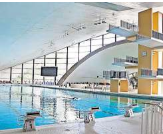
Profitiert nicht von der Förderung des Landes: Das Stadionbad hinter dem Maschsee. Dieses soll erst saniert werden, sobald das neue Fossebad fertig ist.

eine Förderung beantragt wird, vollständig durchgeplant sein müssen, berichtet Möller. Zudem wird Hannover kaum mit einer 80-Prozent-Förderung für finanzschwache Kommunen rechnen können. Zwar ist die Kassenlage der Stadt nicht rosig. Allerdings gibt es zahlreiche Kommunen in Niedersachsen, denen es finanziell deutlich schlechter geht. Deshalb wird das Sportstättenprogramm des Landes auch nicht dazu führen, dass Vorhaben aus dem Bäderkonzept der Stadt Hannover beschleunigt werden können. Laut Stadtsprecher Möller läuft derzeit die Sanierung des Nord-Ost-Bades, die rund 5,1 Millionen Euro kostet. Zudem werde aktuell die Erneuerung des undichten Nichtschwimmerbeckens im Lister Bad vorbereitet. Nächster wichtiger Meilenstein bei der Umsetzung des Bäderkonzeptes soll im November der Start des Fossebad-Neubaus sein, der rund 61,2 Millionen Euro kosten wird. Die Planungen liefen „auf Hochtouren“, allerdings warte die Stadt noch auf die Freigabe des Projektes durch die Kommunalaufsicht. Von den 25 Millionen Euro des Landes für die Sanierung von Bädern in Niedersachsen sollen 20 Millionen Euro an die Kommunen fließen. Fünf Millionen Euro sind für die Sanierung von Vereinsbädern vorgesehen. Bei der Entscheidung, welche Projekte gefördert werden, werden das Alter, die Verbesserung des energetischen Zustandes, der Abbau von Barrieren, die Auslastung der Sportstätte sowie die regionale Verteilung berücksichtigt.