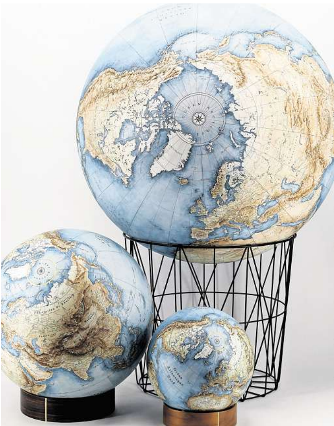
Es bräuchte weit mehr als einen Planeten Erde, wenn alle Menschen weltweit so viel CO2 produzieren und natürliche Rohstoffe verbrauchen würden wie hierzulande.

Den Erdüberlastungstag berechnet das Global Footprint Network für jedes Land und für