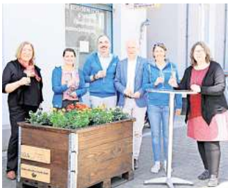
Die erste Pflanzkiste der IDG wurde aufgestellt.

zept der Pflanzkisten wurde als am schnellsten und einfachsten umzusetzen bestimmt. Die Kisten sind mobil auf Europaletten installiert und werden von der Vahrenheider Werkstatt gebaut, die eine Tischlerei und eine Gärtnerei unterhält. Als Aufstellflächen bieten sich gepflasterte Vorgärten privater Hand an, nun sucht die I.D.G. nach weiteren Plätzen für die Pflanzkisten in Döhren, verbunden mit einer Partnerschaft für die Bepflanzung und Bewässerung. Eine Bepflanzung ist individuell möglich und gewünscht, Partner und Sponsoren können mittels Plakette auf der Kiste verewigt werden. Interessierte können unter idg-hannover.de Kontakt aufnehmen. Die I.D.G. hofft, dass die Pflanzkiste von den Döhrenern als eine Art Initiator wahrgenommen wird und daraus weitere Ideen und Initiativen entspringen. RED