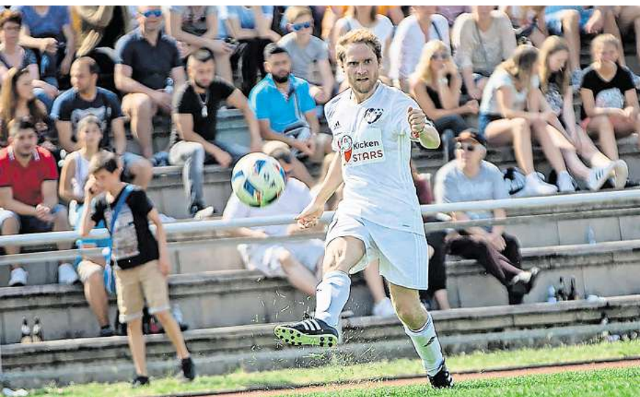
Musiker Johannes Oerding beim Kicken mit Stars 2016 in Holzminen.