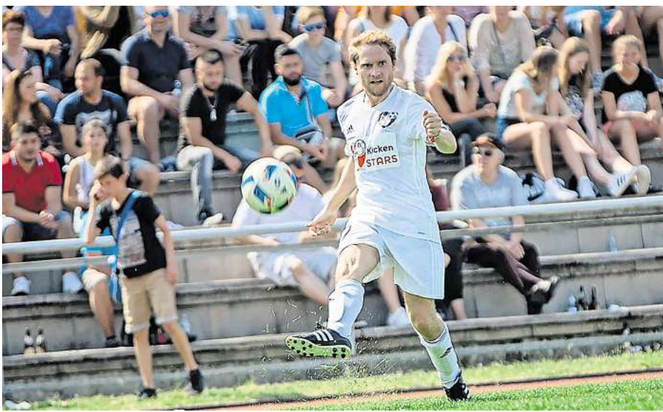
Musiker Johannes Oerding beim Kicken mit Stars 2016 in Holzminden.