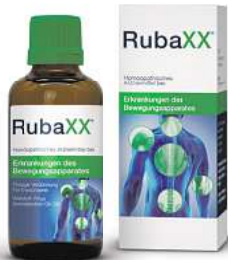
Abbildung Betroffenen nachempfunden

Für Ihre Apotheke: Rubaxx (PZN 13588561)