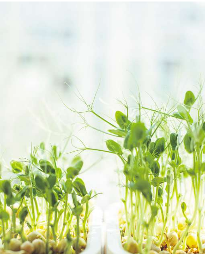
Microgreens: Kleine Vitaminpakete, die auch auf der Fensterbank wachsen.

Square-Foot-Gardening: Eine beliebte Technik ist unter anderem das Square-Foot-Gardening: Hier wird das Beet in