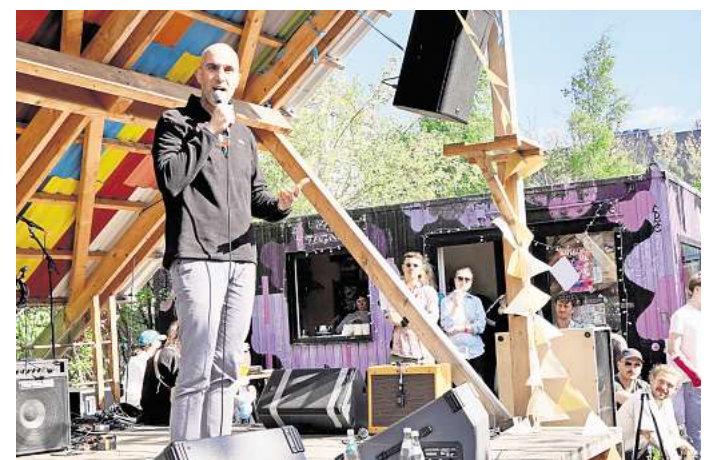
Belit Onay besuchte das Platzprojekt. Der Oberbürgermeister bezeichnete die Initiative als „lebendigen Ausdruck von Gemeinschaft und Stadtentwicklung von unten“.

► Nähere Informationen zum Platzprojekt und Veranstaltungsübersicht: platzprojekt.de