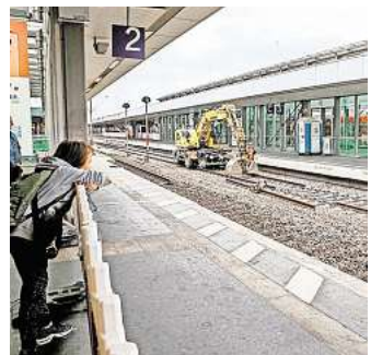
Wegen der Sanierung des Hauptbahnhofs müssen Reisende der S-Bahn Hannover von Montag, 12. Mai, bis Sonntag, 25. Mai, mit Einschränkungen rechnen.