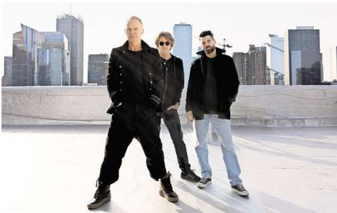
Sting präsentiert die größten Hits aus seiner Diskografie auf der Expo Plaza.

Zu Sting muss man nicht viel sagen. Gordon Sumner, so sein richtiger Name, betrat mit seiner Band The Police 1977 die Musikwelt. Bis zu ihrer Auflösung 1983 bekamen The Police insgesamt sechs Grammys und bescherten den Fans Klassiker wie „Message in a bottle“, „Walking on the Moon“, „Roxanne“, „So lonely“, „De Do Do Do, De Da Da Da“ und das oftmals missverständliche „Every breath you take“. Solo festigte Sting seinen Ruf als exzellenter Musiker mit „An Englishman in New York“, „If You Love Somebody Set Them Free“, „All This Time“ und „Desert Rose“. Zusammen mit dem virtuoseren Gitarristen und