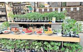
Beim Tomaten- und Gemüseseminar darf auch verkostet werden.