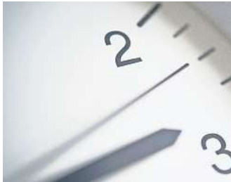
Die Zeit wird in der Nacht auf Sonntag um eine Stunde vorgestellt.

HANNOVER. Die Musikschule, Maschstraße 22-24, bietet am Sonnabend, 29. März, von 11 bis 17 Uhr eine „Musik- und Tanz-Tankstelle“ für jedes Alter an. Auf dem Programm stehen Konzerte, Workshops, Schrott-Trommeln und gemeinsames Singen. Den Abschluss gestalten alle gemeinsam mit Animation, Tanz, Improvisation und Live-Musik. Der Eintritt ist frei. RED