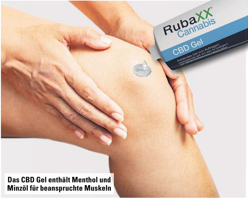
Das CBD Gel enthält Menthol und Minzöl für beanspruchte Muskeln

Hochwertig, geprüft & zertifiziert Das Gel wird unter höchsten Qualitätsstandards in Deutschland her-