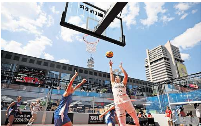
Das 3X3-Basketballfeld am Raschplatz wurde in den vergangenen Jahren sehr gut angenommen.

Zudem lehrt die Erfahrung aus den vergangenen Jahren, dass die Drogen- und Trinkerszene bloß vom Raschplatz verdrängt wird – in Richtung Fernroder Straße, aber auch weiter in Richtung List, wie Anwohner berichteten. Eine nachhaltige Lösung sehe anders aus, meinten Hilfsorganisationen.