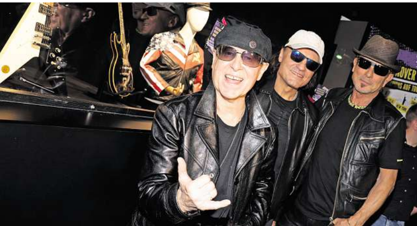
Klaus Meine, Matthias Jabs und Rudolf Schenker bei der Eröffnung der Rockstage im Flughafen Hannover.

Bandgründer Rudolf Schen-ker zeigte sich geschmeichelt von so viel Ehrerbietung. Er erin-nernte daran, dass die Rock-Pro-pheten im eigenen Land lange wenig galten. „Wir haben lan-ge wenig Zuwendung aus Han-nover und generell aus Deutsch-land bekommen – wir mussten uns dafür ins Ausland verdrücken“, sagte er. „Jetzt aber bekommen wir sie im Überfluss.“