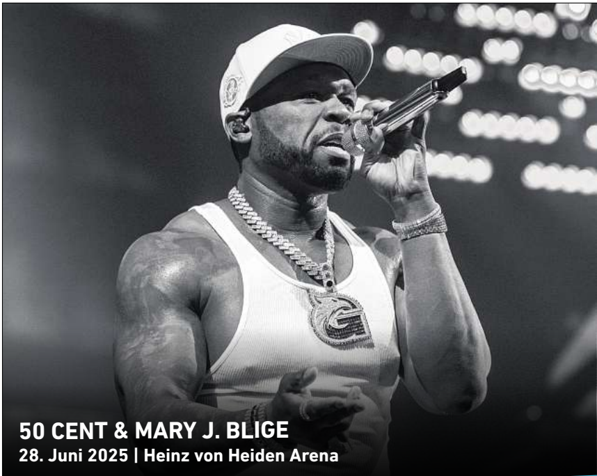
50 CENT & MARY J. BLIGE 28. Juni 2025 | Heinz von Heiden Arena

Ihr persönlicher Ticketservice der HAZ & NP