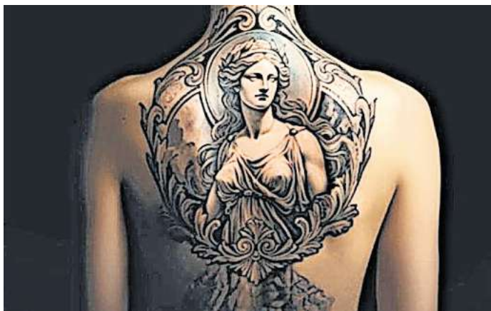
In der neuen Ausstellung im MAK geht es um Tattoos in der Antike und Tattoos mit antiken Motiven.

Ausdruck von Persönlichkeit. Die Ausstellung widmet sich den antiken Tätowierpraktiken in Ägypten, Griechenland und Rom und spannt einen Bogen ins Heute. Gezeigt werden dazu Fotografien zeitgenössischer Tätowierungen von Bildmotiven aus dem antiken Mittelmeerraum, die dafür Porträtierten sprechen über ihre Tattoos. RED