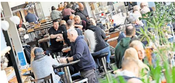
Stimmt der Mix in der Markthalle?