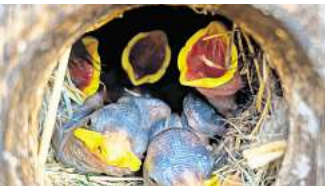
Wenn auf einem alten Nest ein neues Nest gebaut wird, können die Vogelbabys leicht zur Beute werden.

Nistkästen sind vor allem als Bruthilfe für Vögel im Frühjahr gedacht. Dass sie auch im Winter wichtige Aufgaben erfüllen, ist weniger bekannt, so der Nabu. Denn auch im Winter bieten die