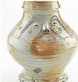
Die Bilder auf holländischen Gefäßen sind Thema einer Familienaktion im MAK.

raum wieder für Sie da sein. Außerdem eröffnen wir eine neue Sonderausstellung“, heißt es seitens des Museums. Für Schulklassen gäbe es Sondereinbarungen. Weitere Informationen erhalten Interessierte per Telefon unter (0511) 16842120 oder per E-Mail unter museumspaedagogik.kestner@hannover-stadt.de .