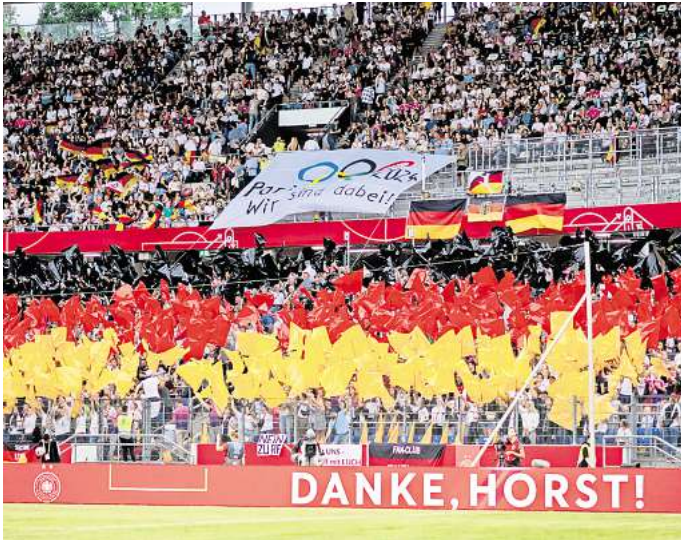
So soll es wieder sein: Ausgelassene Stimmung auf den Rängen beim Spiel der Frauen-DFB-Auswahl gegen Österreich in Hannover im Juli 2024.

Aber Hannover rechnet auch mit Einnahmen. Dabei orientiert sich die Stadt an den Einkünften, die die Austragungsstädte der Männerfußball-EM in 2024 erzielten. „Teilbranchen wie die Tourismusindustrie, insbesondere Hotellerie, Gastronomie und Verkehrswesen, haben merklich von der Veranstaltung profitiert“, schreibt die Stadt in ihren Plänen. Der wirtschaftliche Nutzen übersteige die Ausgaben um ein Vielfaches.