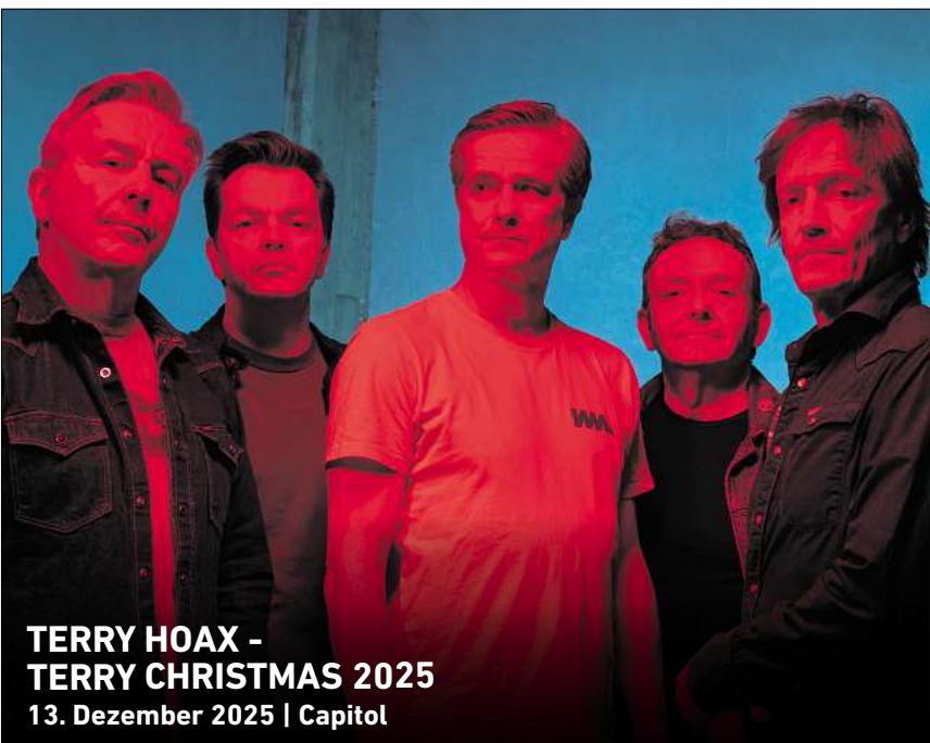
TERRY HOAX - TERRY CHRISTMAS 2025 13. Dezember 2025 | Capitol

HANNOVER. In der Stadtbibliothek Döhren, Peiner Straße 9, können Nähbegeisterte ab 16 Jahren am Montag, 27. Januar, von 17 bis 19 Uhr beim Nähtreff gemeinsam Lesezeichen aus Stoff nähen. Ob Anfänger oder Fortgeschrittene, alle sind willkommen. Das Team der Bibliothek stellt alles zur Verfügung, was gebraucht wird – Stoffe, Nähmaschinen und Fäden. Wer teilnehmen möchte, sollte sich anmelden unter (0511) 168-49140 oder Stadtbibliothek-Doehren@Hannover-Stadt.de .