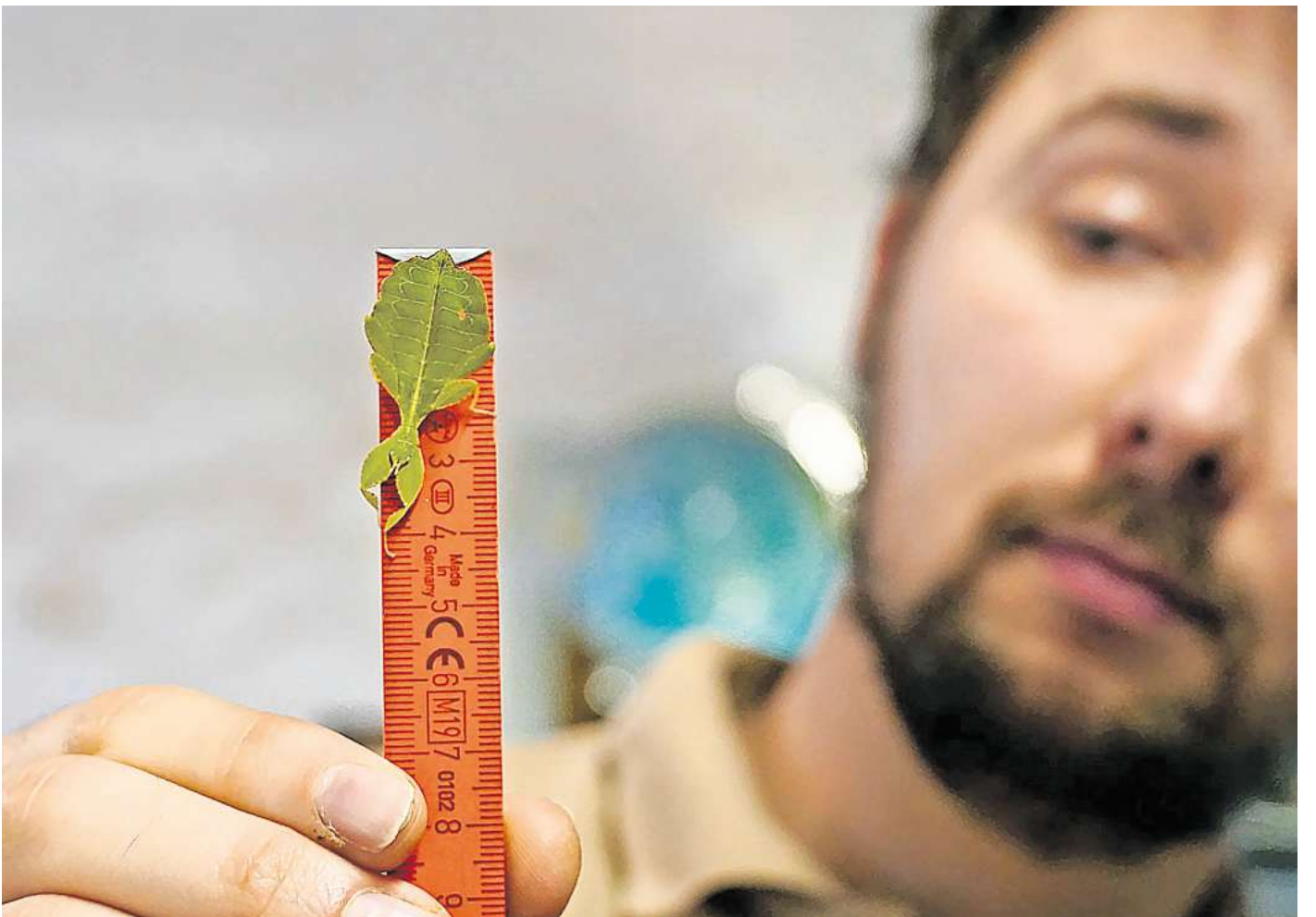
Das wandelnde Blatt wird gemessen.

Über 20.000 Teilnehmende erlebten bei den rund 3.400 Führungen durch den Zoo und hinter die Kulissen besondere Momente. 13.500 SchülerInnen und Schüler aller Altersstufen haben bei über 600 Unterrichtsgängen und Workshops vom Bildungsangebot der Zooschule profitiert. Im Jahr 2024 hat der Erlebnis-Zoo an 35 For-