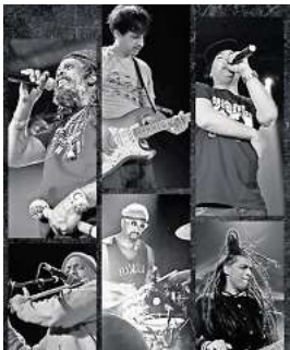
Asian Dub Foundation

Bühne. Sie erlangten weltweite Anerkennung, indem sie die Bühne mit Rage Against The Machine, den Beastie Boys und Primal Scream teilten. Auf ihren Platten arbeiteten sie mit Radiohead, Sinead O'Connor, Iggy Pop, Adrian Sherwood und Chuck D zusammen. Zudem gehören ADF zu den ersten Gruppen, die sich ernsthaft mit Filmkonzerten auseinandersetzten, angefangen 2001 mit ihrer Interpretation des Soundtracks des französischen Filmklassikers „La Haine“. Die Asian Dub Foundation blickt auf 30 Jahre Karriere und Aktivismus zurück, geprägt von unvergesslichen Konzerten auf der ganzen Welt, 9 Studioalben sowie ikonischen Kollaborationen. Im Jahr 2025 wird die ADF weiterhin ihre Geschichte schreiben. Karten gibt es an den bekannten VVK-Stellen und unter