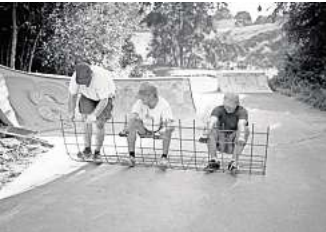
Fabian Schwarze porträtiert in seinem Buch "give us a place to rot" Menschen, die Skatespots in Hamburg bauen.

auf intensiv“ macht er die emotionalen und sozialen Dimensionen dieser besonderen Arbeits- und Lebenswelt sichtbar. Dabei soll der Mensch in den Mittelpunkt der Arbeit gestellt werden, so der Fotograf –