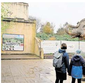
Der Bau des Elefantenhauses verzögert sich.

Die beheizte Laufhalle der Elefanten ist Teil des Masterplans 2025+, in dem der Zoo vor knapp zehn Jahren Ideen zur Weiterentwicklung zusammengefasst und beschlossen hat. Zum Neubau gehört noch ein erweiterter Außenbereich für die Tiere, der den Dickhäutern auch