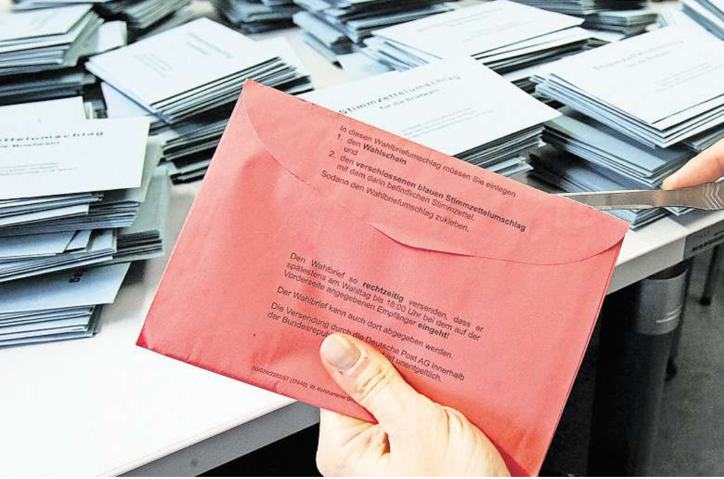
In Vorbereitung: Briefwahlunterlagen können bei Region und Stadt Hannover bereits angefordert werden. Verschickt werden die Unterlagen aber erst Anfang Februar – auch an den Urlaubsort.

Wie genau komme ich an die Briefwahlunterlagen? Wer Briefwahl beantragen will, dem raten Region und Stadt Hannover am besten zeitnah, die Unterlagen zu beantragen. Das können Wähler und Wählerinnen auf unterschiedliche Weise machen. Auf der Internetseite www.wahlhannover.de kann man sich den Antrag herunterladen, das gilt auch für die 20 Umlandkommunen. Der Antrag muss die vollständigen Daten wie Familien- und Vornamen, Geburtsdatum und Wohnanschrift mit Straße, Hausnummer, Postleitzahl und Wohnort enthalten. Wichtig: Eine Antragstellung per Telefon, SMS oder über andere Messengerdienste ist nicht möglich. Der Antrag muss spätestens am Freitag, 21. Februar, um 15 Uhr vorliegen.