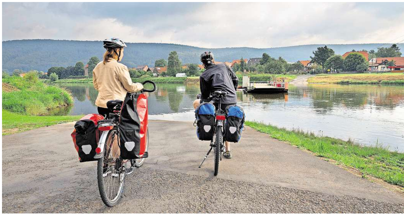
Mit dem Rad unterwegs: Radfahrer warten auf die Fähre von Vekerhagen nach Hemeln

In Zeiten der Digitalisierung aber verwendet kaum noch jemand die Papiervariante, um eine Fahrt mit dem Rad zu erstellen oder den Verlauf zu überprüfen. „Wer heute eine Tour ausarbeitet, der nutzt dafür das Routing am Computer oder Laptop“, sagt Rammert, der zweimal wöchentlich in einer Rennradgruppe trainiert und zudem an den Wochenenden mit dem Fahrrad privat unterwegs ist. Aus der beruflichen Perspektive und der privaten Erfahrung weiß er daher, dass unterschiedliche Gruppen auch unterschiedliche