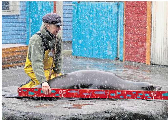
Ganz schön lang: ein kalifornischer Seelöwe.

schungsprojekten auf den Gebieten der Verhaltensbiologie, Tiermedizin, Mikrobiologie, Genetik und KI-basierten Analysen mitgewirkt.