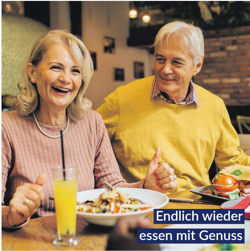
Endlich wieder essen mit Genuss

Bei Blähungen, Völlegefühl und Magenkrämpfen bringen GASTEO Magen-Tropfen mit sechs