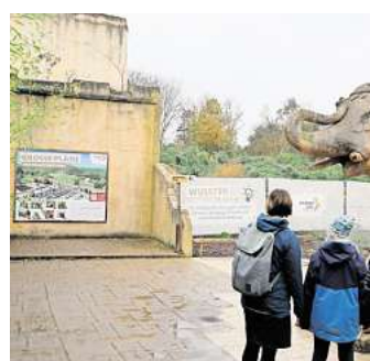
Der Bau des Elefantenhauses verzögert sich.

Die beheizte Laufhalle der Elefanten ist Teil des Masterplans 2025+, in dem der Zoo vor knapp zehn Jahren Ideen zur Weiterentwicklung zusammengefasst und beschlossen hat. Zum Neubau gehört noch ein weiterer Außenbereich für die Tiere, der den Dickhäutern auch