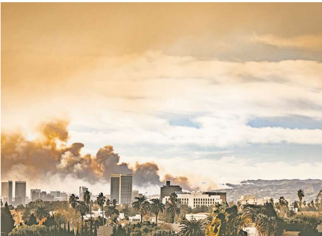
Die Brände in und um Los Angeles sind laut US-Regierung die verheerendsten in der Geschichte Kaliforniens.

Noch nie sei so offensichtlich gewesen, wie gefährlich die Klimakatastrophe ist, und wie dringend Menschen, Lebensgrundlagen und Wirtschaftsräume vor ihr geschützt werden müssten.