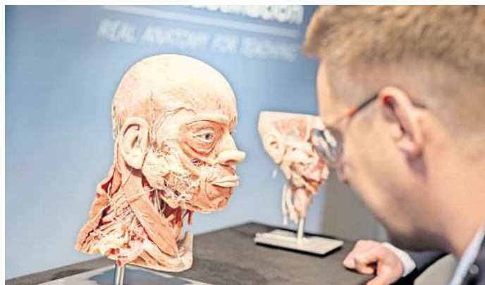
Warteliste für Körperspender: Laut des Instituts für Plastination wollen über 21.000 Menschen nach ihrem Tod ausgestellt werden.