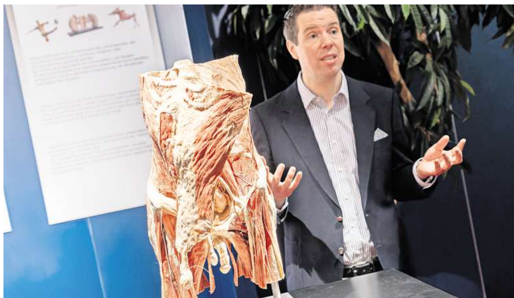
Rurik von Hagens führt durch Plastinationswerkstatt und Ausstellung.