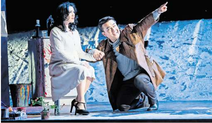
La Bohème - Oper von Giacomo Puccini.