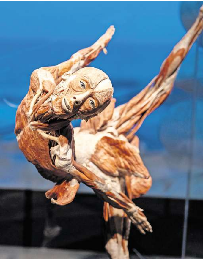
Auf Augenhöhe: Die Ausstellung „Körperwelten“ zeigt detailliert die Anatomie des menschlichen Körpers.

zeption der Ausstellungen verantwortlich. Die sogenannten Ganzkörper-Plastinate sollen Organfunktionen und häufige Erkrankungen illustrieren. Es wird erklärt, was jeder Einzelne tun kann, um seine Gesundheit möglichst lange zu bewahren. Ziel der Ausstellung sei gesundheitliche Aufklärung. Wer die Schau besuchen will, bucht ein Zeitfenster. Die Verweildauer ist zeitlich unbegrenzt. Öffnungszeiten sind montags bis freitags, 9 bis 18 Uhr, am Wochenende und an Feiertagen von 10 bis 18 Uhr. Karten gibt es in den HAZ/NP-Ticketshops, online unter tickets.haz.de. Gruppen und Schulklassen können sich per Mail an gruppen@eventim.de wenden. Abonnenten und Abonnentinnen erhalten Vorteilsrabatte: 30 Prozent bei Buchung eines Zeitfensters zwischen dem 23. Dezember und 26. Januar. Verwenden Sie im Buchungsvorgang den Gutscheincodes AboVorteil30 (bitte Groß- und Kleinschreibung beachten). Während der gesamten Ausstellungsdauer haben Abonnenten und Abonnentinnen einen 20-prozentigen Rabatt auf Flex- und Geschenktickets mit dem Gutscheincode AboVorteil20, solange der Vorrat reicht. Ab 27. Januar erhalten Abonnenten und Abonnentinnen 15 Prozent Rabatt auf alle Zeitfenstertickets mit dem Gutscheincode AboVorteil15.