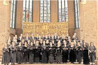
Der Bachchor Hannover singt weihnachtliche Musik in der Marktkirche.

HANNOVER. Vier Typen und vier Mikrofone, das fünfte Weihnachtsalbum im Gepäck, und nach über 20 Band-Jahren noch immer voller frischer Ideen: Maybeop bringen ihr Weihnachtskonzert zum Album „Schöner Schein“ auf die Bühne im Theater am Aegi. Das A-cappella-Quartett entstaubt dabei Klassiker wie „Heidschi Bumbeidschi“ oder „Carol of the Bells“ und kleidet die festlichen Melodien in ein neues Gewand. Und auch Eigenkompositionen fehlen nicht, wie immer mit Augenzwinkern, vom tragikomische Tango „Der Tod des Weihnachtsmanes“ bis zur Deutsch-Rap-Parodie „KNG of LightZ“, in der klargestellt wird, wer die Hütte mit dem höchsten Bling-Bling-Faktor hat. Drei Termine für die Konzerte stehen noch an: Sonnabend, 21. Dezember, ab 19 Uhr, und Sonntag, 22. Dezember, ab 14 Uhr und ab 19 Uhr.