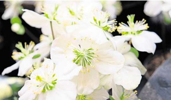
Die Christrose öffnet dank Züchtung ihre Blüten zu Weihnachten.