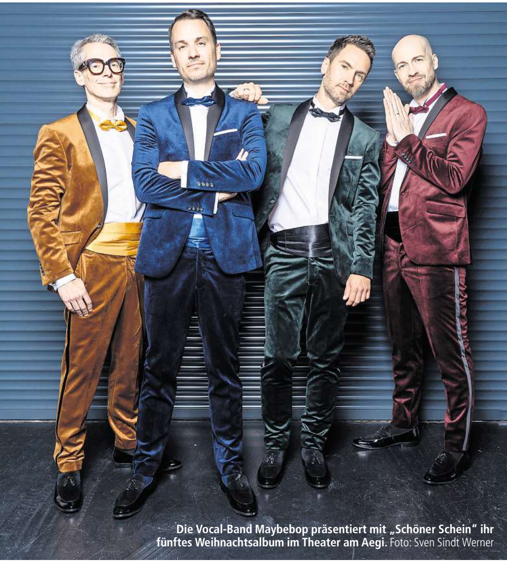
Die Vocal-Band Maybeop präsentiert mit „Schöner Schein“ ihr fünftes Weihnachtsalbum im Theater am Aegi.