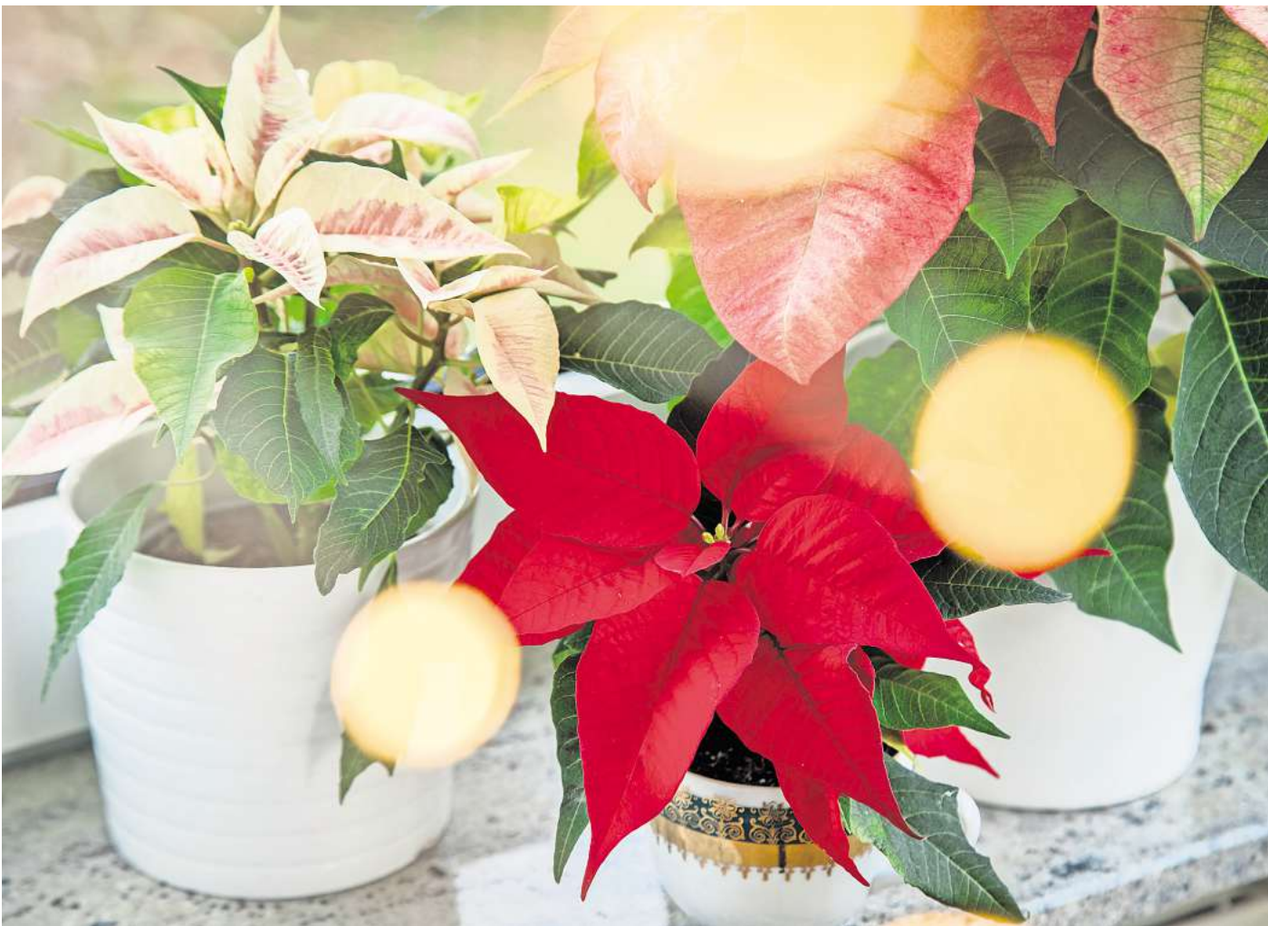
Weihnachtssterne setzen Akzente – gerade dann, wenn sie nicht allein kommen.

Der Klassiker fürs Haus in den Wochen vor dem Weihnachtsfest sind Weihnachtssterne. Die Farben reichen von Rottönen über Rosa bis hin zu Creme. Es werden Minipflanzen, Büsche in verschiedenen Größen und Hochstämmchen angeboten. Gleichmäßige Wärme ist das A und O, damit Weihnachtssterne in der Wohnung gut gedeihen. Das ist ein wichtiger Faktor für den sicheren Transport vom Blumenladen nach Hause. Am besten lässt man sich die Pflanzen mit Papier einwickeln, damit sie bei winterlichen Außentemperaturen keinen Schaden nehmen. „Werfen die Weihnachtssterne vermehrt trockene Blätter ab, ist meist geringe Luftfeuchtigkeit der Grund“, sagt Gärtnerin Ingrid Franzen. Daher sollte man die Wolfsmilchgewächse nicht zu dicht an der Heizung platzieren und mit Dekorationen aus Moos eine Quelle für Luftfeuchtigkeit schaffen, sodass die Wurzeln der Weihnachtssterne nicht durch Staunässe geschädigt werden. Für eine gleichmäßige Wasserversorgung ist es am besten, die Pflanzen einmal in der Woche in zimmerwarmes Wasser zu tauchen. Anschließend lässt man