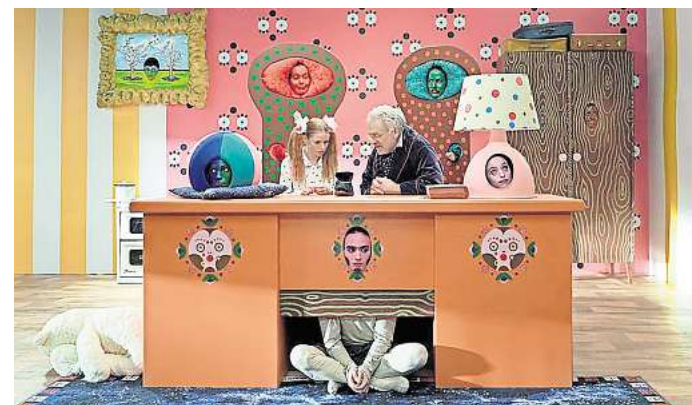
Roe Rosen: „Kafka for Kids“, Videostill, 2022.