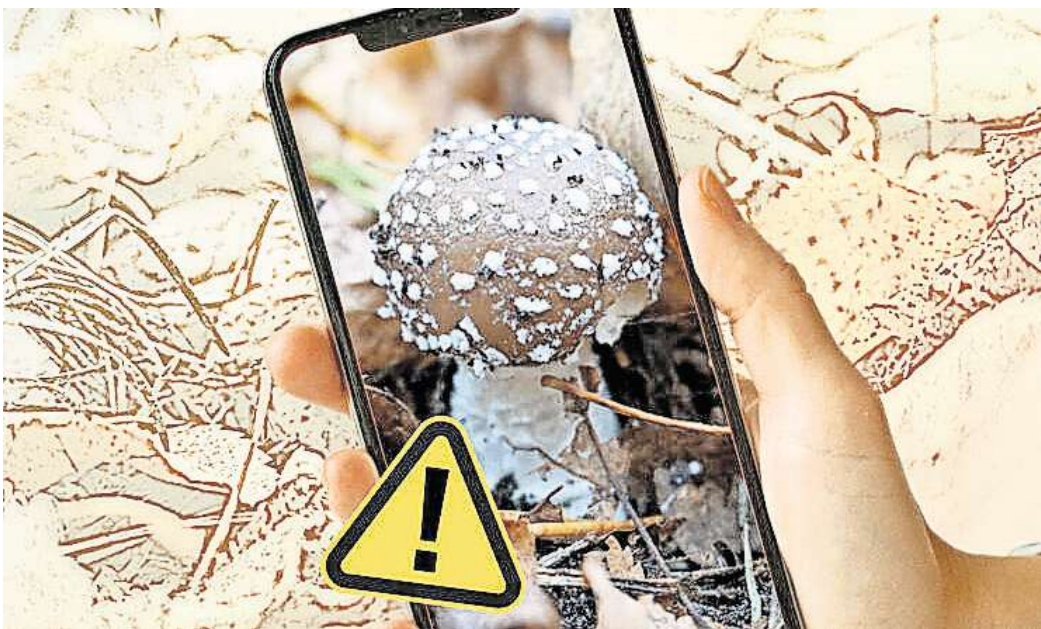
Nicht darauf verlassen: Pilzbestimmungs-Apps liegen nicht immer richtig.

Eine vierte App, die mir von mehreren Seiten empfohlen wurde, ist das virtuelle Lexikon „Meine Pilze“. Statt einer Bilderkennung müssen die Nutzer hier Merkmale selbst eingeben. Nach dem Ausschlussprinzip werden dann mögliche Arten angegeben – gemeinsam mit einem Prozentsatz, zu dem sie mit den angegebenen Merkmalen übereinstimmen. Leider gelingt es mir mit keinem der gefundenen Pilze, ein hundertprozentiges Match zu finden. Zu ge-