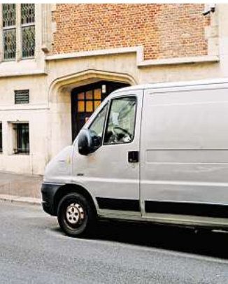
Immer wieder teilen Eltern auf WhatsApp Warnungen über angebliche Kinderfänger in weißen Vans. Die wahren Zahlen zeigen jedoch ein gänzlich anderes Bild.

Tatsächlich, und das macht die Sache eben kompliziert, beruhen manche der Meldungen in der Region Hannover nachweislich auf echten Sichtungen. Ein Beispiel aus Kirchhorst in Isernhagen: Ein Autofahrer hat am 23. August 2024 ein Mädchen im Grundschulalter angesprochen. Das bestätigt die Polizei, die den Halter des Fahrzeugs ermitteln konnte. Doch dieser habe, so die Behörde, das Mäd-