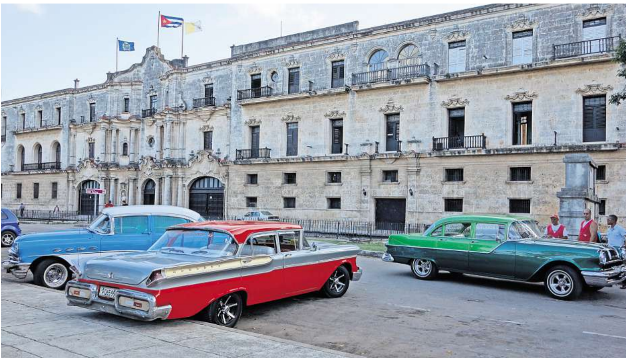
Kuba: ein faszinieren- des Land zwischen Nostalgie und Nichts geht mehr.