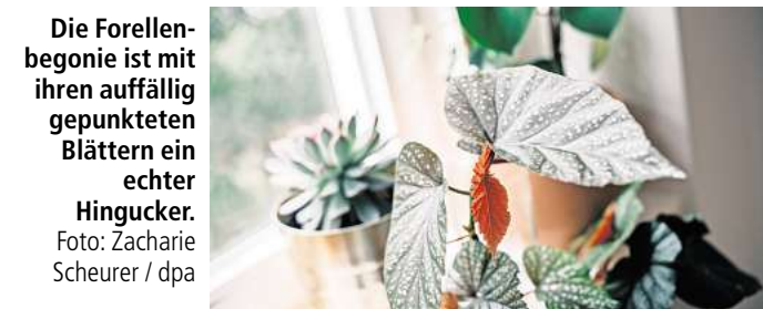
Die Forellenbegonie ist mit ihren auffällig gepunkteten Blättern ein echter Hingucker.