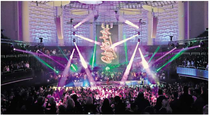
Ausgelassene Stimmung bei der Glit- terbox.