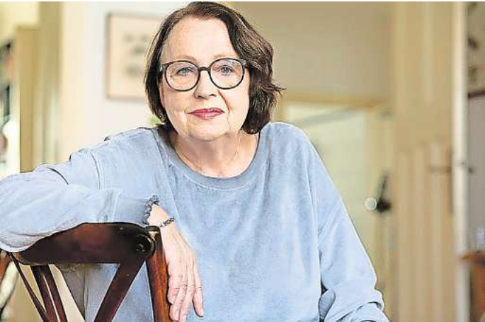
Liest am 24. November um 11 Uhr bei der Buchlust aus „Unser Ole“: Katja Lange-Müller.

Viele weitere, spannende Neu- igkeiten aus der lokalen Kultur- szene finden Sie in der aktuellen Ausgabe unseres Partnerme- diums magaScene, monatlich frisch gedruckt und kostenlos an über 500 Auslegestellen in Hannover oder online auf www.magaScene.de inklusive Download-Möglichkeit.