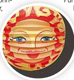
Zeit für bunte Laternen.

brunnen auf dem Vahrenheider Markt treffen sich die Laternelaufenden am 15. November um 18 Uhr, es geht dann durch den Grünzug mit einem musikalischen Zwischenstopp beim Seniorenheim Erlenhof. R/HR