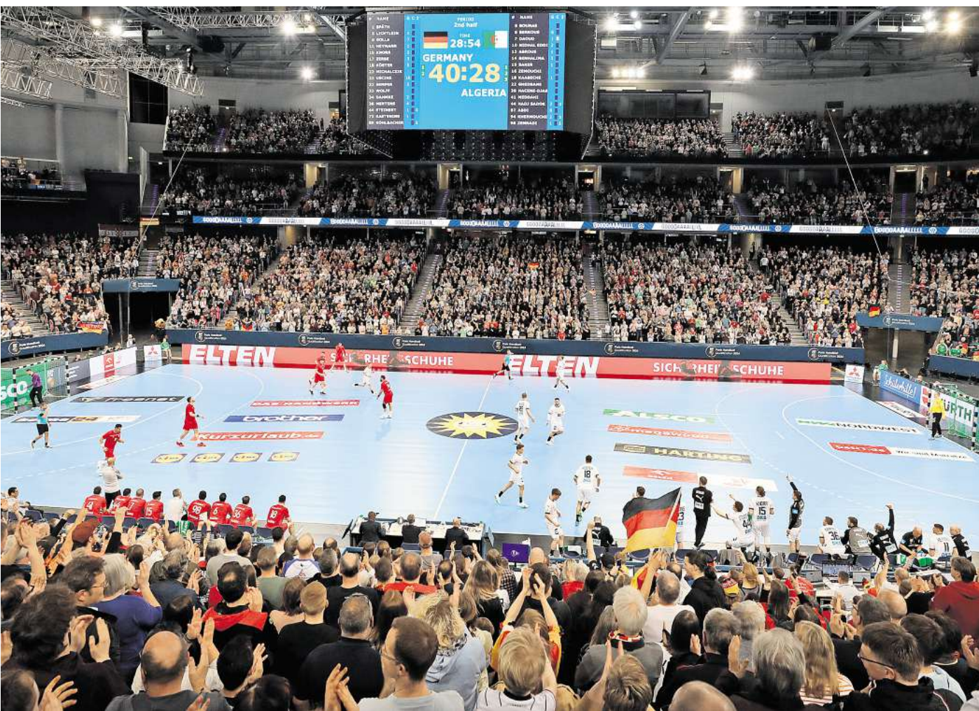
Handball-Länderspiel in Hannover: 2027 wird es in der ZAG Arena Hauptrundenspiele bei der WM geben.