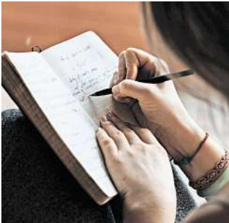
WortLaut: kreatives Schreiben, gemeinsames Lesen.