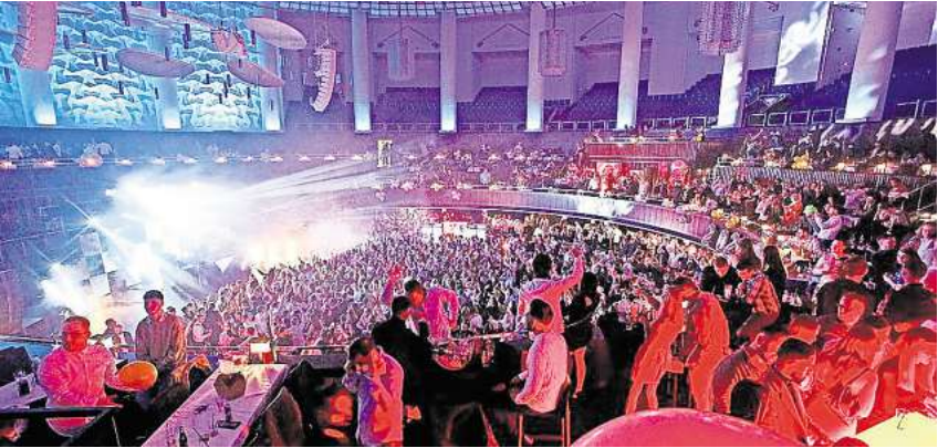
Silvester im HCC: Rund 4500 Menschen werden hier zusammen ins neue Jahr feiern.