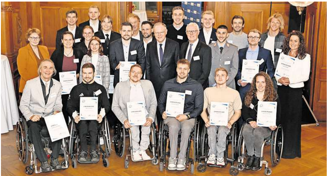
Gruppenbild mit Ministerpräsident: Niedersachsens Teilnehmerinnen und Teilnehmer der Olympischen und Paralympischen Spiele bei Stephan Weil im Gästehaus der Landesregierung.