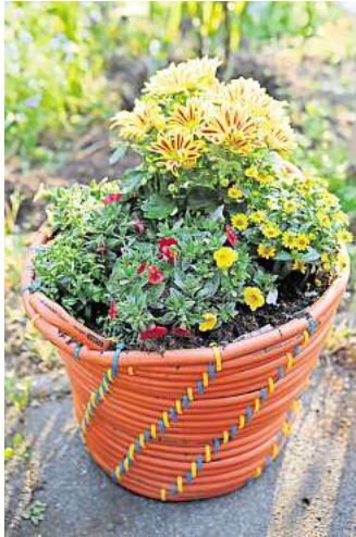
Ein Hingucker, den längst nicht jeder im Garten stehen hat: ein Blumentopf aus einem Gartenschlauch.

gegenüberliegenden Stellen hoch, fixieren die entstehende Schlaufe an beiden Seiten und legen noch eine weitere Schlauchlage darüber. Die Kabelbinder verbinden die Schlauchteilstücke, sodass Sie den Kübel direkt bepflanzen können, ohne dass bei jedem Wässern ständig Substrat aus den Ritzen gespült wird. Ungenutzte Einmachgläser eignen sich hingegen gut, um Windlichter zu basteln. Und aus alten Holzpaletten können Möbelstücke werden. Schmirgelt man sie ab und streicht sie neu, kann man daraus etwa Tisch für den Balkon oder ein Bettgestell bauen.