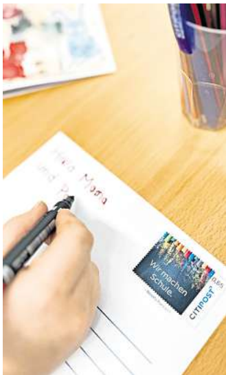
Früh übt sich wer lernt, einen Brief zu schreiben.

Sie sind Lehrer oder Lehrerin und möchten Postkarten als Material für Ihren Deutschunterricht? Dann melden Sie gerne unter service@citipost.de .