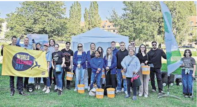
Mitmachaktion: Freiwillige sammeln Müll am „World Cleanup Day“.

➔ Mehr Informationen zu den CleanUps gibt es online: cleanuphannover.de