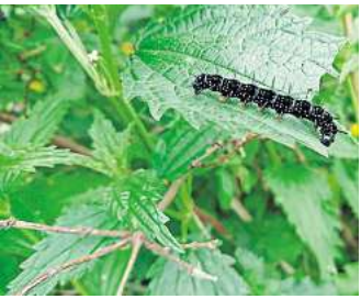
Insektenfreundlich: Auf Brennnesseln wachsen Schmetterlingsraupen auf.