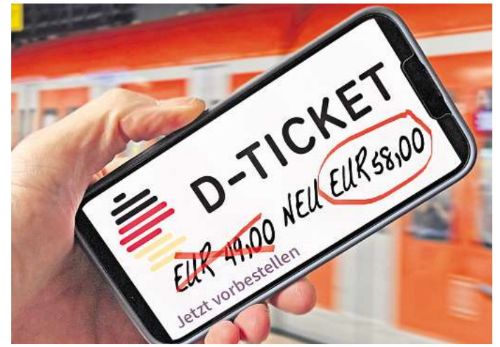
Das D-Ticket wird teurer: Der Preis steigt von 49 auf 58 Euro.