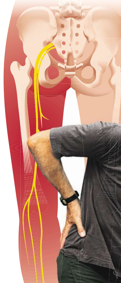
Der Ischias-Nerv verläuft vom unteren Rücken bis zum Fuß.

Langes Sitzen am Schreibtisch oder im Auto, schweres Heben, falsches Bücken – und