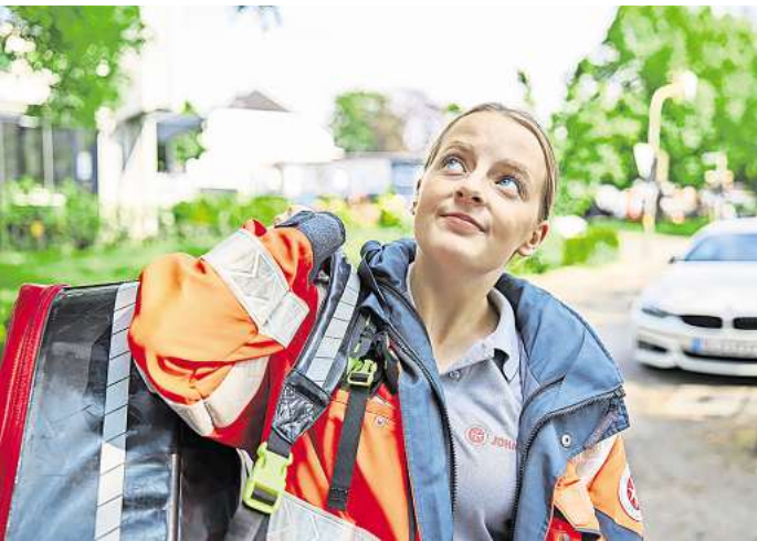
Mit dem Hausnotruf kann bei Bedarf Hilfe angefordert werden.

Seit seinen Anfängen entwickelt sich der Johanniter-Hausnotruf weiter; er setzt dennoch konsequent auch auf Einfachheit. Beispielsweise mit der Kombination aus einem Handsender (ein Knopf) und einem Empfänger