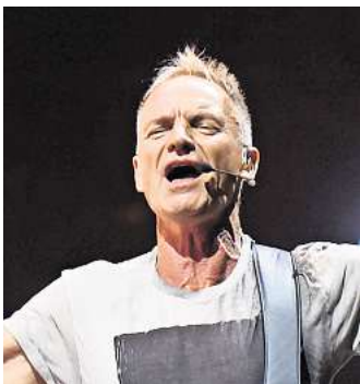
Kommt zum Plaza-Festival: Weltstar Sting.

Bereits im Dezember 2023 war Sting in Hannover zu Gast. Bei der „My Songs Tour“ nahm der Musiker und Komponist seine Fans ebenfalls mit auf eine musikalische Zeitreise. Die Tickets waren schnell vergriffen. Wer den 17-fachen Grammy-Gewinner im nächsten Jahr also nicht verpassen will, der sollte sich schnell Karten für das Plaza Festival sichern.