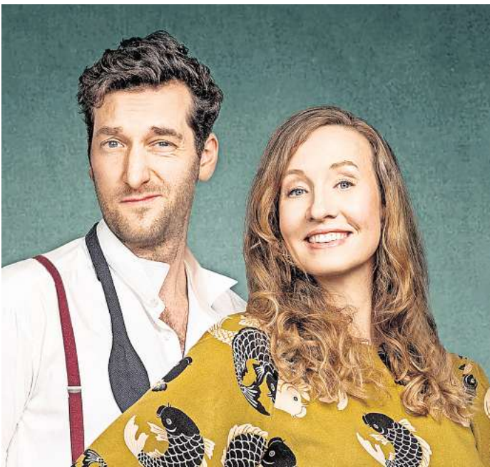
Das Duo „Das Geld liegt auf der Fensterbank, Marie“ bringt die Premiere seines neuen Programms „Glorreich versieben“ auf die Bühne im Apollo.