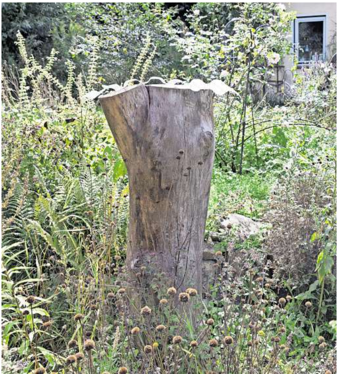
Flechten: Das wichtigste Element für einen naturbelassenen Gartenbereich ist Totholz.

„Lässt man Spontanvegetation zu, kann es hübsche Überraschungen geben“, sagt die Landschaftsgärtnerin. „So manche Wildpflanze ist den bekannten Prachtstauden ebenbürtig. Mitunter etablieren sich Pflanzen, die schön aussehen und wunderbar zusammenpassen, wie etwa das Ruprechtskraut, das von Mai bis Oktober über rosa blüht, mit wilder Möhre, Schafgarbe, Schöllkraut oder Johanniskraut.“ Präger zufolge ist es allenfalls nötig, regulierend