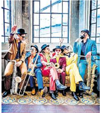
Heißer Tipp in der Brass-Band-Szene: Brazzo Brazzone stehen für unverschämten World Brass Groove in knallbunten Outfits.