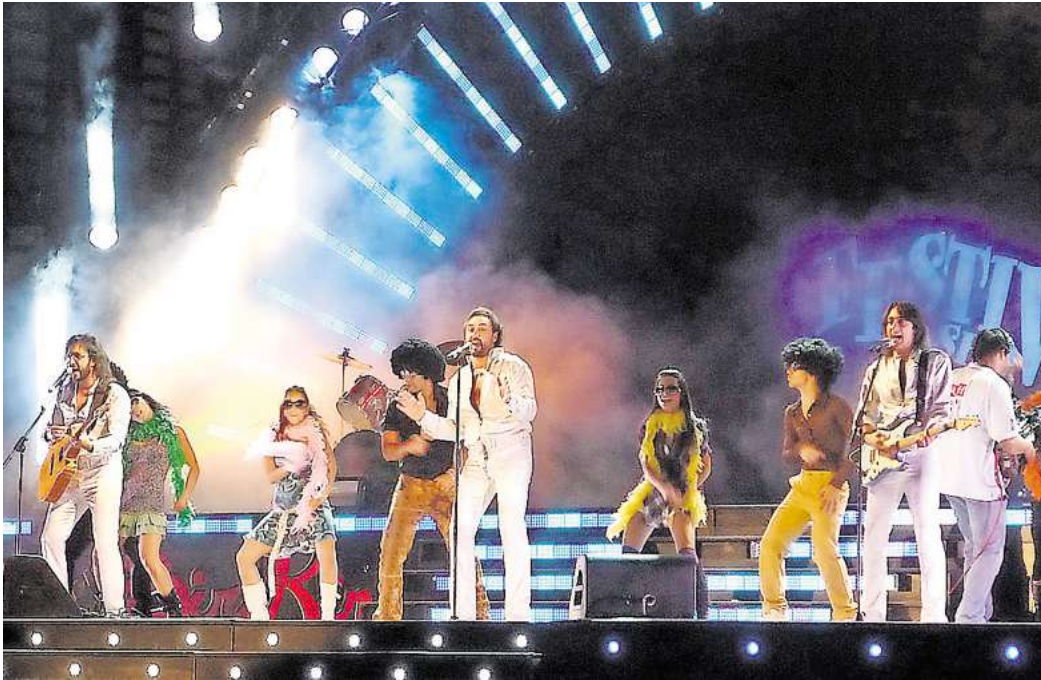
Sorgen für ausgelassene Stimmung auf der Bühne: The Italian Bee Gees.

Den musikalischen Part übernehmen „The Italian Bee Gees“, bekannt aus der großen TV-Dokumentation „50 Jahre Bee Gees“. Die ambitionierten italie-