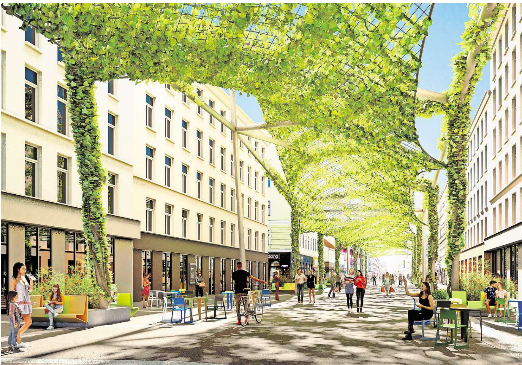
Sollen Schatten spenden: Kletterpflanzen über dicht bebauten Straßen. Die Idee hat das Wiener Büro Rataplan entwickelt.

die Mitarbeitenden des zuständigen Pflegebetriebs in einer aufwendigen Aktion mehrere Tage lang frisches Wasser in den See geleitet und es wurden Umwälzpumpen für eine bessere Wasserqualität eingesetzt. Wie aktuelle Messungen gezeigt haben, reichten diese Maßnahmen jedoch nicht aus, um dauerhaft einen stabilen Sauerstoffgehalt im Teich zu erzielen, der die gute und nachhaltige Versorgung der darin lebenden Tiere sicherstellt. Eine verstärkte Eintrübung resultierte unter anderem dadurch, dass trotz anderslautender Appelle vor Ort, Brot in den Teich geworfen wurde, um die Enten und Fische zu füttern. Durch solchen zusätzlichen Nährstoffeintrag (Eutrophierung) entstehen immer mehr freischwimmende Algen, die beim beobachteten sogenannten „Umkippen“ des Gewässers vermutlich einen entscheidenden Anteil hatten. RED