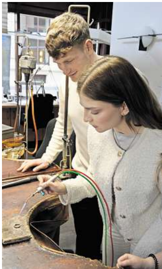
Erinnerungen für das Leben: In der Goldschmiede Ephesus können Brautleute individuelle Ringe fertigen.

Gold- und Silberschmiede Ephesus Georgsplatz 3A 30159 Hannover info@ephebus.de