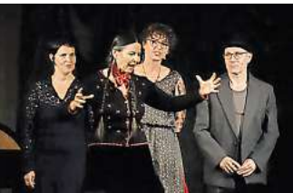
Finale: Nach 27 Jahren Erzählfestival findet es zum letzten Mal statt.

HANNOVER. 25 Jahre Figurentheater Die Roten Finger – das muss gefeiert werden. Die Jubiläumswoche im Theatrio, Großer Kolonnenweg 5, beginnt am Sonnabend, 21. September, ab 19.30 Uhr mit einem Abendprogramm für Erwachsene, in dem es Einblicke in die facettenreiche Welt des Figurentheaters gibt. Dabei kommen skurrile Klappmaulfiguren wie Willi Winzigmann zur Wort. Der Eintritt kostet 22 Euro im Vorverkauf plus Gebühren. In der Jubiläumswoche stehen unter anderem die Musikpiraten für Erwach-sene für die ganze Familie auf dem Programm (Sonntag, 22. September, 15 Uhr) und eine Vorführung von „Ich bin viel mehr“ (27. September, 19.30 Uhr), in der nicht ausgelebte Persönlichkeitsanteile auf Jazz und Tango treffen.