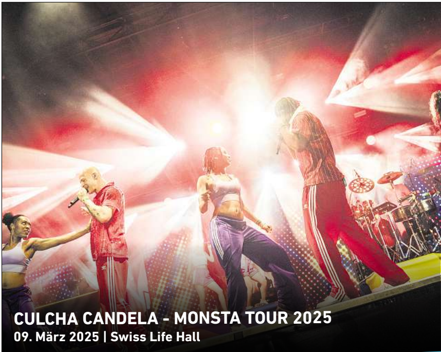
CULCHA CANDELA - MONSTA TOUR 2025 09. März 2025 | Swiss Life Hall