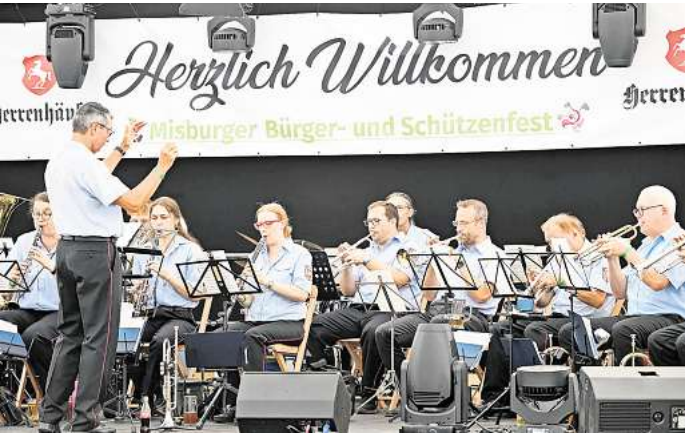
Mit viel Musik im Festzelt.

Vorgärten des ehemaligen Dorfes Misburg vorbei. Gegen 17 Uhr war zum Abschluss ein Konzert aller Musikgruppen auf dem Schützenplatz geplant. Der einsetzende Regen hat dort jedoch „für ein schnelles Ende“ gesorgt, erklärt Homann. Die Feier war damit allerdings nicht am Ende: Nach einem kurzen Umzug ins Zelt sei das fröhliche Fest weitergefeiert worden und auch die Musik- und Fanfarenzüge hätten doch noch ihr Können unter Beweis stellen dürfen.