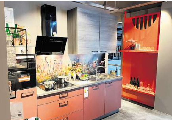
XXXL-Auswahl mit Riesenqualität: Eine von 130 Ausstellungsküchen in der frisch renovierten Küchenabteilung.