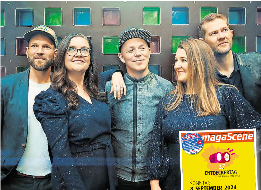
Postyr aus Dänemark – am 26. September im Pavillon

lohnt sich auf jeden Fall ein Blick auf das komplette Programm auf der untenstehenden Webseite der Veranstaltung, denn Vokalmusik 2024 ist viel mehr, als man vielleicht erwarten würde. Die Konzerte finden an verschiedenen Orten statt. Mit dabei sind die Christuskirche, das Kulturzentrum Pavillon, die Neustädter Hof- und Stadtkirche und die Galerie Herrenhausen. Hier nur einige Highlights aus dem Programm: Die preisgekrönte Gruppe Postyr aus Dänemark wird am 26. September im Pavillon zeigen, dass Vokalmusik und Computer ganz hervorragend zusammenpassen. Die Vokal-Band hat mit E-Cappella ein musikalisches Universum erschaffen, eine neue Art von elektronischem Pop, bei dem alles von den Stimmen ausgeht. Durch den Einsatz von Effekten und Computern werden die sanften Stimmen in anregende Beats verwandelt, die mit Chorsounds