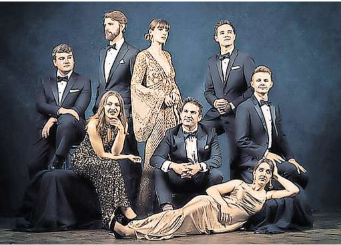
Das für den Grammy nominierte Ensemble Voces8 aus Großbritannien – am 27. September, Christuskirche

und ausdruckstarkem Gesang gemischt werden. Am 27. September kann man in der Christuskirche das britische Vokalensemble Voces8 mit seinem Programm „London by Night“ erleben. Die acht Sängerinnen und Sänger von Voces8 wurden 2023 nominiert für einen Grammy und gehören zu den führenden Gruppen weltweit. Die Popularität, vor allem beim jungen Publikum, ist bemerkenswert. Ihre Musikvideos haben hundertaufende Aufrufe und die Alben wurden millionenfach gehört. Außergewöhnlich wird es am 28. September in der Galerie Herrenhausen. Der Bundesjugendchor