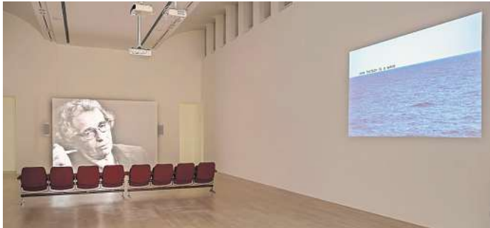
Die Kestner Gesellschaft widmet sich in einer Ausstellung dem Wirken von Hannah Arendt.