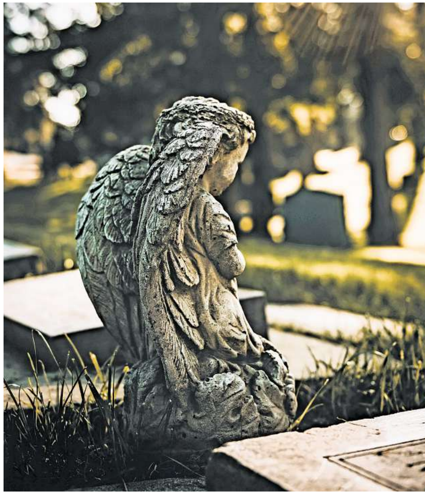
Der Friedhof ist ein Ort des Gedenkens, aber auch der lokalen Geschichte und der Ruhe und Erholung im Grünen.

Für die Jahre 2024 und 2025 liegt der Fokus der Aktionstage auf dem Thema „Endlich und lebendig“. Mit vielfältigen Programmen wie Führungen, Lesungen, musikalischen Darbietungen und Informationsständen sollen Interessierte am Tag des Friedhofs die Gelegenheit erhalten, Friedhöfe aus einer neuen Perspektive zu betrachten. Nicht nur soll der Umgang mit Tod und Trauer enttabuisiert werden, es geht auch darum, den Friedhof als Ort des Lebens zu begreifen, der Erholung und der Erinnerung.