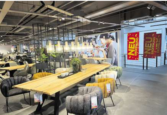
Es ist angerichtet: Nur noch ein paar Tage bis zur großen Neueröffnung - und auch danach warten Highlights.