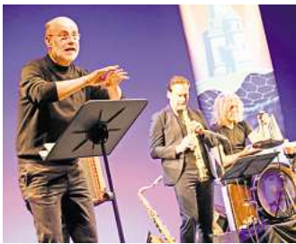
Vortrag mit Harald Lesch

In der Ausstellung auf dem Ernst-August-Platz zeigen Wissenschaftlerinnen und Wissenschaftler aus ganz Deutschland ausgewählte Exponate aus ihrer Forschungsarbeit und es besteht die Möglichkeit, selbst Dinge auszuprobieren und mit den Forschenden ins Gespräch zu kommen. In vier Themenbereichen werden unter dem Motto „Vom Labor ins Ausstellungszelt“ Stationen präsentiert. Um riesige Teleskope, Schwarze Löcher und die Frage, warum das Eis der Antarktis Neutrinos sichtbar machen kann, geht es im Themenbereich Universum. Ein weiteres Thema sind Laser, in unserem Alltag vom DVD-Player über die Augenmedizin bis hin zu Zukunftsvisionen vom Gebäudebau auf dem Mond oder pestizidfreier Landwirtschaft. Mit und ohne Teilchenbeschleuniger gibt es zudem einen Einblick in die Welt aus Atomen und Molekülen. Das Themenfeld Quanten zeigt schließlich auf, wie Quantentechnologie und Quanteneffekte bereits heute genutzt werden und wie man sie zukünftig nutzen wird, ob in Satelliten zur Beobachtung unterirdischen Wassers, Kernspintomografen oder schlichtweg im eigenen Smartphone. Die Ausstellung öffnet von Dienstag bis Donnerstag jeweils von 10 bis 18 Uhr, am Freitag von 10 bis 20 Uhr und Sonnabend von 10 bis 17 Uhr.