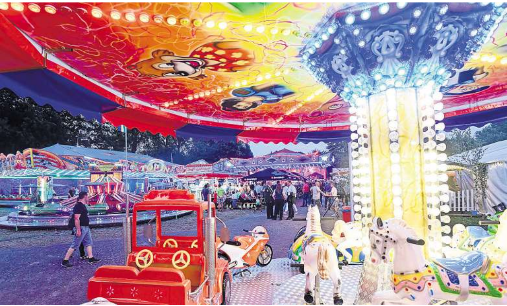
Zahlreiche Attraktionen gab es für die Besucher auf dem Festplatz.