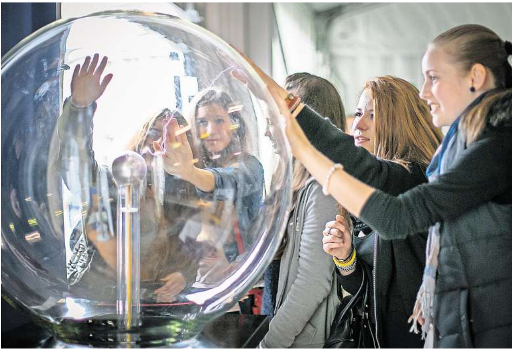
Eine interaktive Physik-Ausstellung kommt auf den Ernst-August-Platz.