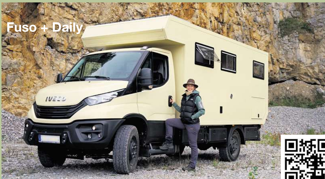
Fuso + Daily

Tel.: +49 (0) 53 21 / 6 85 39-0 E-Mail: verkauf@auto-wilde.de www.auto-wilde.de