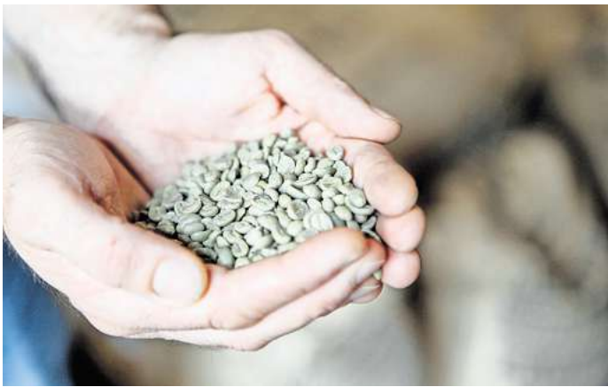
Kaffeebohnen vor der Röstung: So werden sie im „24 Grad“ ange- liefert aus Ländern wie Kolumbien, Äthiopien oder Kenia.