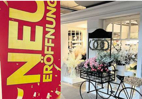
Die neue Boutique-Abteilung im Erdgeschoss glänzt mit viel Detailliebe.

Sonntag, 6. Oktober 2024, 13-18 Uhr. Das Möbelhaus und das XXXL-Restaurant haben bereits ab 12 Uhr geöffnet (Möbelverkauf ab 13 Uhr).