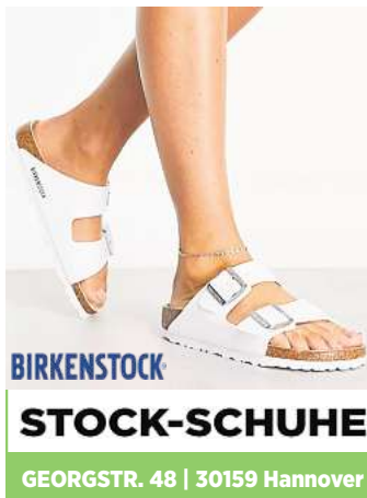
BIRKENSTOCK STOCK-SCHUHE GEORGSTR. 48 | 30159 Hannover 11390601_002624

► Die Teilnahme kostet für Sonnabend 75 Euro, für Sonntag 70 Euro und für beide Tage 110 Euro. Verpflegung und Getränke sind im Preis inbegriffen. Karten gibt es über die Internetadresse www.mokshyoga-festival.com oder vor Ort.