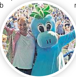
Party für kleine und große Entdecker mit „Max der kleine Dino“.

14.35 Uhr ein Konzert für den Zusammenhalt und die Stärkung der Demokratie. Brass-Woofers mixen ab 16.15 Uhr in spannenden Arrangements Jazz-Soli, Rap und mitreißenden Gesang.