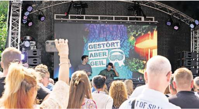
Ausgelassene Stimmung vor der Bühne.