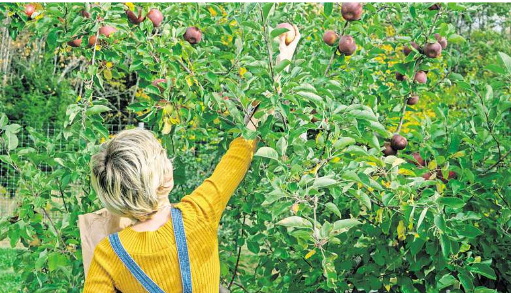
Der Spätsommer ist Erntezeit im Garten.

Im September lassen sich die Sonnenseiten der AUSKLINGENDEN WARMEN MONATE noch einmal richtig auskosten