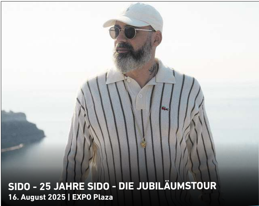
SIDO - 25 JAHRE SIDO - DIE JUBILÄUMSTOUR 16. August 2025 | EXPO Plaza

HANNOVER. Mit mehreren Aktionsflächen feiert der Stadtbezirk Herrenhausen-Stöcken sein Stadtteilstefest am Sonnabend, 7. September, von 15 bis 18 Uhr am Stadtteilzentrum Stöcken, Eichsfelder Straße 101, sowie am gegenüberliegenden Marktplatz. Der Eintritt ist frei. RED