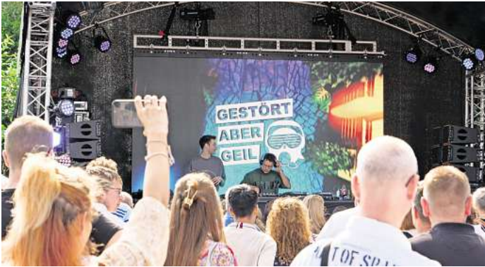
Ausgelassene Stimmung vor der Bühne.