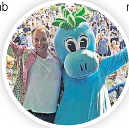
Party für kleine und große Entdecker mit „Max der kleine Dino“.

■ Fahrgäste können Busse, Bahnen und Nahverkehrszüge im gesamten GVH (Zonen A/B/C) am 8. September den ganzen Tag kostenfrei nutzen. Das vollständige Bühnenprogramm des Entdeckerfestes sowie Tourenziele in der Stadt und Region zum Entdeckerstag stehen auf entdeckertag.de.