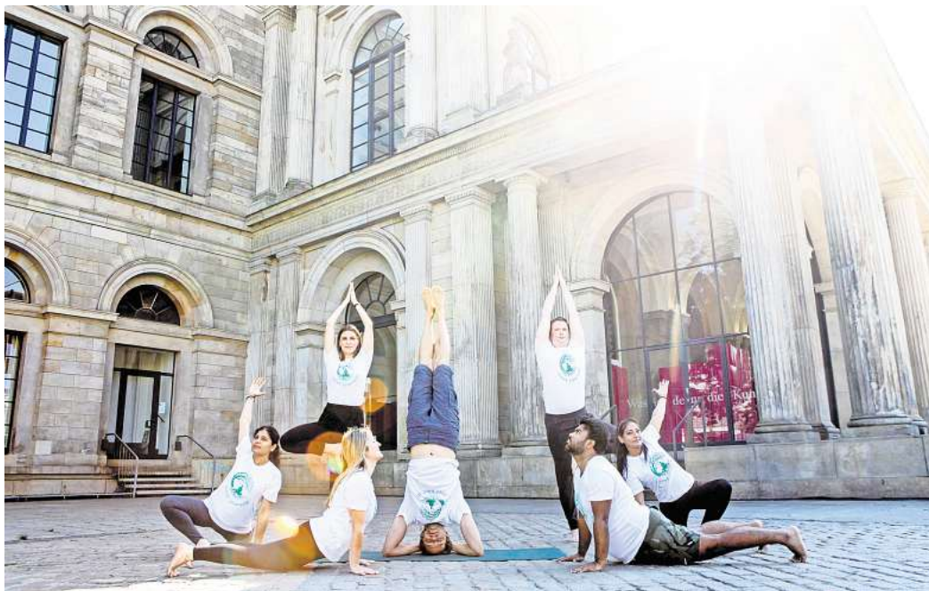
Aufwärmen: Die Yoga-Lehrer und -Schüler machen sich bereit für das Moksh Yoga Festival beim TKH in Kirchrode.

► https://www.roderbruch.de/shop/de/34-stadt-mit-keks