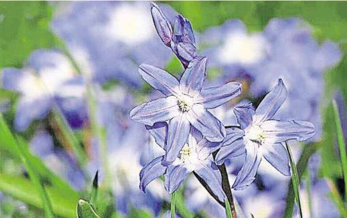
Blausternchenzwiebeln können ab Ende September in die Erde eingesetzt werden

Auch wenn dieser kleine Pflegekniff schwerfällt, lohnt er sich: Früchte, die aus diesen spät befruchteten Blüten entstehen, würden nicht mehr ausreifen. Dafür stecken die Pflanzen ihre Kraft in den Geschmack und die Größe bereits vorhandener Früchte. Die Energie dafür gewinnen die Pflanzen aus der Photosynthese, die in den Blättern stattfindet. Deshalb bleiben die Blätter – anders als die Blüten – an der Pflanze. Zeigen Blätter allerdings braune Flecken oder andere Anzeichen von Krankheiten, schneiden Sie diese ab. BLAUSTERNCHEN STECKEN Mit dem Stecken der Tulpenzwiebeln können Sie sich noch Zeit bis einschließlich November