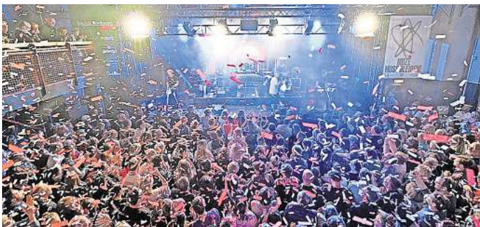
Konzerte im MuZe können wieder langfristig geplant werden

Quadratmeter: nicht nur die Gebäude an der Emil-Straße 26 und 28, in denen Veranstaltungshalle und Büroräume untergebracht sind, sondern auch den Gebäuderiegel davor. Dort sind mit langfristigen Mietverträgen ein Billardverein und eine afrikanische Freikirche untergebracht. „Wir brauchen auch die Mieteinnahmen“, sagt Busmann. „Wir sind ab sofort für die bauliche Erhaltung zuständig.“ Der bisherige Eigentümer, ein Immobilienfonds, hatte in den vergangenen Jahren nur überaus zögerlich saniert. „Es fällt vieles an, was zum Beispiel die energetische Sanierung des Musikzentrums oder auch kleinere Schönheitsreparaturen angeht“, so Busmann. Der Backstagebereich muss modernisiert werden. Im Hauptgebäude gibt es nicht einmal warmes Wasser. „Eigentlich müssten wir noch jemanden beschäftigen, der Hausmeistertätigkeiten übernimmt.“ Busmann würde gerne das gesamte Gelände aufwerten, freundlicher gestalten,