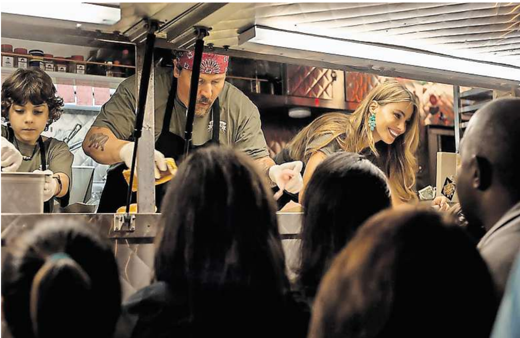
Wohlfühl-Komödie: Das Cinema del Sol zeigt „Kiss the Cook - So schmeckt das Leben“ unter freiem Himmel auf dem Andreas-Hermes-Platz.

Brad Pitt, Tom Cruise und Kirsten Dunst spitzen die Zähne als Blutsauger in „Interview mit einem Vampir“ am Montag, 9. September. Düster-romantisch und schwermütig geht es durch die Jahrhunderte und um die Frage, wann die Ewigkeit sinnlos wird.