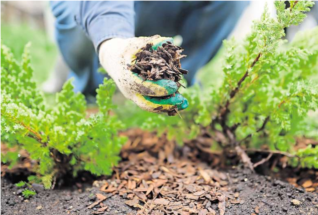
Organische Substanzen: Kiefernrinde zum Beispiel eignet sich für eine bedeckende Schicht.

Welches Material zum Mulchen verwendet wird, hängt von den Pflanzen im jeweiligen Beet ab. Bei organischem Material unterscheidet man zwischen Gehölzmulch aus Zweigen oder Rinde, der Stickstoff bindet, und Mulch aus Rasen oder Grünabfällen, der Stickstoff enthält. Der stickstoffbindende Gehölzmulch eignet sich nur für Gehölze und Sträucher – hier lohnt sich eine zusätzliche Stickstoffdüngung in Form von Hornspänen, etwa 80 Gramm pro Quadratmeter. Baumrinde, aus der Rindenmulch entsteht, enthält viele Gerbsäuren. Aus diesem Grund vertragen nicht alle Stauden Rindenmulch. Auch Gehölzmulch sollte bei Stauden eher dünn aufgetragen werden – insbesondere bei Rosen empfiehlt Scherer, komplett darauf zu verzichten. Laub oder Grasmulch sind hier bessere Alternativen. Beide Mulcharten eignen sich ebenso wie Stroh oder Schafwolle auch für den Gemüsegarten. „Im Prinzip kann man sogar Rhabarberblätter, Radieschenblätter oder anderes Grün, das bei der Gemüseernte nicht verwertet wird, als Mulch nutzen“, sagt die Expertin. Das Material sollte keine Anzeichen von Krankheiten oder Pilzen zeigen. Allen, die auch im Gemüsegarten auf einen tadellosen optischen Eindruck Wert legen, rät sie zu Gartenfaser aus dem Baumarkt. Die sei zwar etwas teurer, sieht dafür aber sehr ordentlich aus. Auch Miscanthusmulch sorgt für ein gleichmäßiges Bild.