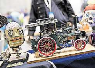
Von witzigen Gadgets bis hin zu nützlichen Erfindungen gibt es viel zu entdecken.