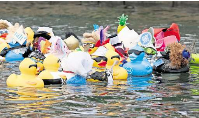
Die bunten „Big Ducks“ schwimmen auf dem Maschsee.

nkr-entenrennen-2024. Die Aus-gabe der Preise erfolgt nur gegen Vorlage der nummerierten „Race Duck“-Urkunde zwischen dem 20. August und 31. Dezember 2024. Eine Gewinnausgabe am Veranstaltungstag und eine Barauszahlung der Gewinne sind nicht möglich. Das Entenrennen wird technisch und praktisch von den Jo-hannitern, der Feuerwehr Han-nover, der Freiwilligen Feuer-wehr Misburg, der Maschsee-aufsicht der Landeshauptstadt Hannover und zahlreichen wei-teren Helfern unterstützt.