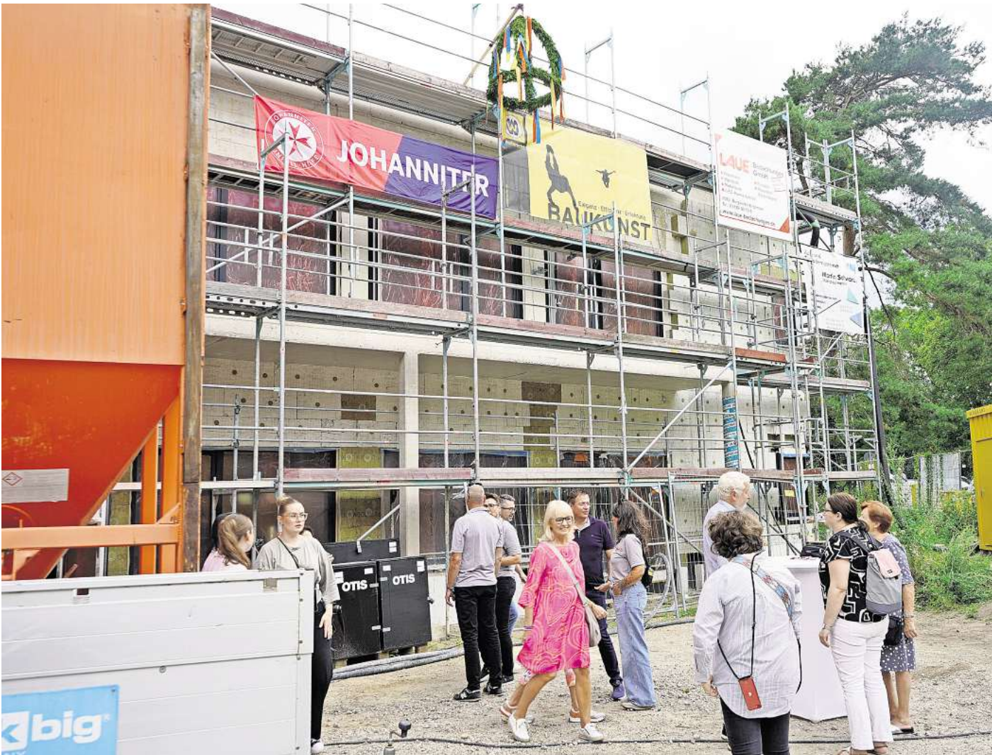
Die neue Kita Uferzeile in Hannover-Misburg: 80 Kinder sollen hier ab August kommenden Jahres einen kreativen Ort zum Spielen und Wachsen finden.

Telefon KundenServiceCenter: 0800 / 0 01 92 14 (kostenfrei)