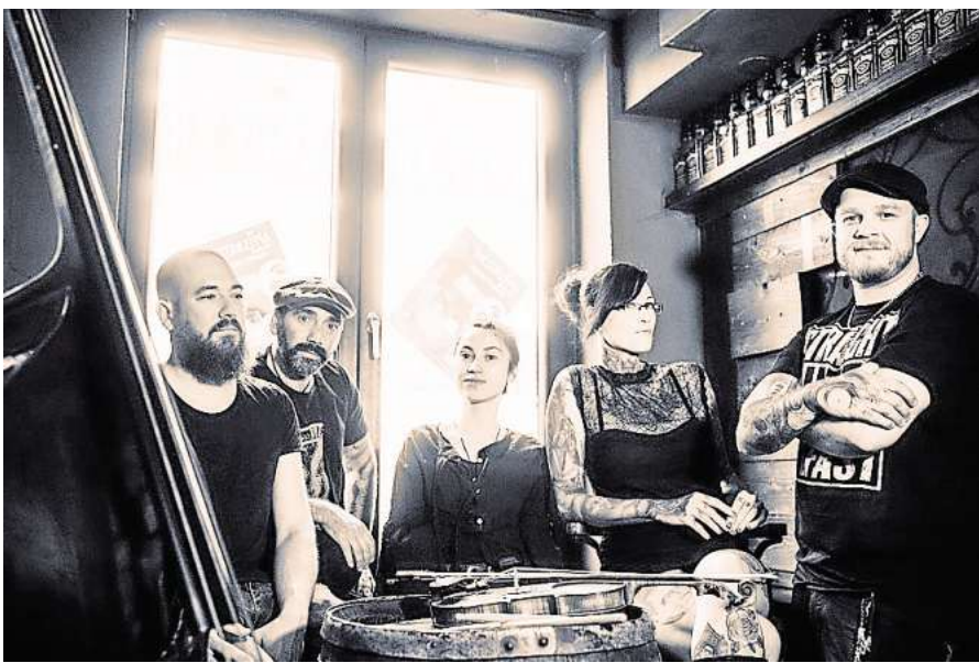
Feinster Pub Rock mit The Hoochigans am 23. August.

Los geht es am Freitag um 15 Uhr. Ab 16 Uhr gibt es dann knackigen Indie-/Post-Punk von den Parting Gyfts. Ab 17.30 Uhr stehen Mad Minor aus Celle mit Rough & Speed Up Blues auf der Bühne. Eine ordentliche Portion Pub-Rock mit einer Mischung aus irischer Musik, Eigenkompositionen und den besten Kneipenhits der letzten 100 Jahre liefern Euch The Hoochigans im Anschluss ab 19 Uhr. Wer auf Punkrock steht, sollte spätestens um 20.30 Uhr mit einem frisch Gezapften vor der Bühne stehen, wenn Tickbreeder Songs von den Sex Pistols, Ramones, Dead Kennedys, The Clash, Peter and the Test Tube Babies, U.K. Subs, NOFX und eigene Stücke zum Besten geben. Am Sonnabend geht es schon um 14 Uhr los mit der Feierei. Ab 15 Uhr werden Euch The Javes mit Rockabilly für die Postmoderne erfreuen. Ab 19 Uhr gibt es feinsten Acoustic-Rock mit HartBerg. Herbert Hartmann (Gesang,