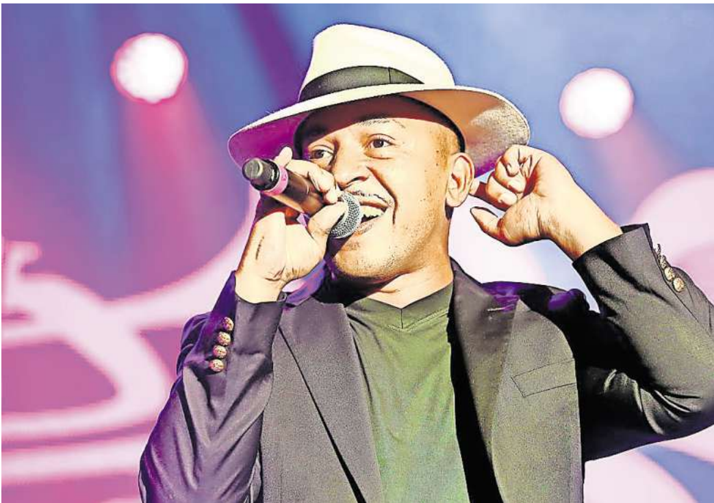
Sommerhit: „MamboNo. 5 (A Little Bit Of...)“ von Lou Bega aus dem Jahr 1999.

Dass die Vermutung allerdings, mit Sommerhits sei es vorbei, weil alles furchtbar individualisiert zugehe in der aktuellen Poplandschaft, nicht stimmt, hat sich im vorvergangenen Jahr erwiesen. Wer 2022 auch nur einen Meter vor die Tür ging, ganz gleich, ob vor die heimische oder vor eine Tür in einer Ferienregion, hörte diese ersten Synthesizer-Takte, in die sich eine Männerstimme mischte, die schwelgte, säuselte und irgendetwas sang von einer alten Zeit, man hatte das nicht ganz genau verstanden. Wichtig ist, dass man die Sommerhits nicht tiefgehend durchdringt, sondern sich auf all die Brocken Englisch seine eigenen Reime macht. Dieser Mann, der säuselte und schwelgte, hieß Harry Styles, sein Lied hatte den Namen „As It Was“, es klang sehr