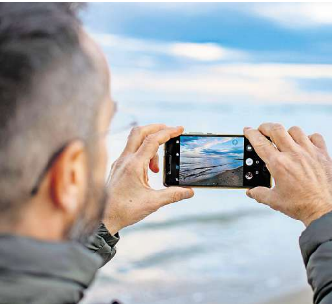
Kein Speicherplatz mehr für die Urlaubsfotos auf dem Handy? Die Cloud kann helfen, es gibt aber einiges zu beachten.