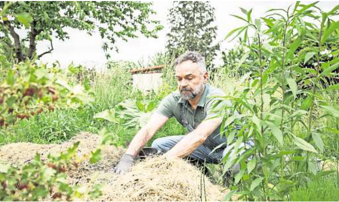
Exotische Pflanzen bereichern den Garten. Doch die Schädlinge, die sie vielleicht einschleppen, werden dem Ökosystem schnell gefährlich.

Nicht nur Mitbringsel aus Nicht-EU-Ländern sind laut den Experten des Bundesforschungsinstituts für Kulturpflanzen ungünstig. Auch innerhalb der EU sollte auf die Mitnahme von „Pflanzen oder Bodenmaterial“ verzichtet werden. Wer unbedingt Pflanzen mitnehmen möchte, sollte sich vorab bei dem Pflanzenschutzdienst seines Bundeslandes informieren. Mit einem Pflanzengesundheitszeugnis können Pflanzen und Pflanzenerzeugnisse aus Nicht-EU Ländern in der Regel legal und ohne Gefahr eingeführt werden. Seriöse Pflanzenhändler können ein solches Gesundheitszeugnis häufig mitliefern.