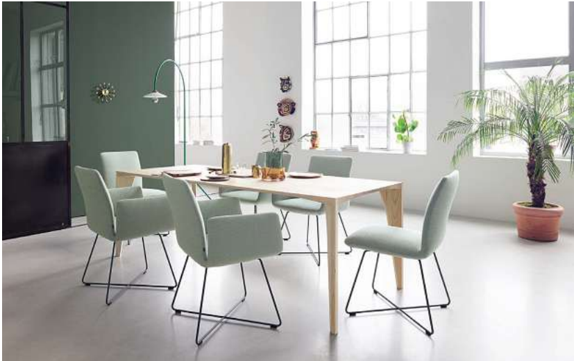
* Gültig auf die komplette Stuhlkollektion von COR

Warum entscheiden, wenn man das Beste aus zwei Welten haben kann? Alvo ist so weich, dass man in ihm schier endlos am Esstisch sitzen kann. Und weil es ihn außerdem in zig Variationen gibt, stellt er wirklich jeden Geschmack zufrieden.