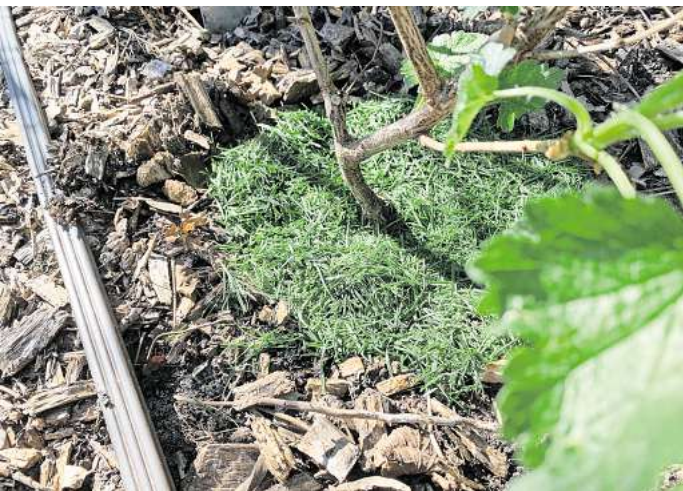
Für ein gutes Gartenklima: Mulch schützt den Boden vor Wetterextremen wie starker Sonne oder Regen.