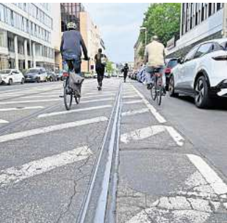
Eine der schlimmsten Holper-pisten in Hannovers Zentrum: Die Joachimstraße am Haupt-bahnhof.

zeit von 3,5 Jahren, also bis vor-aussichtlich Mitte 2028. In der Joachimstraße liegen, ebenso wie in der Prinzenstraße, noch die alten Straßenbahngleise, obwohl die Stadtbahn dort schon seit mehr als sieben Jah-ren nicht mehr fährt. Für die He-rausnahme der Gleise zahlt die Regionstochter Infra, weil es sich um Stadtbahninfrastruktur han-delt. Aber das ist in solchen Fäl-len Fluch und Segen zugleich. Denn normalerweise würde man die Gleise auf Kosten der In-fra herausnehmen und die Stra-ße wiederherstellen lassen. Die Stadt aber will, ähnlich wie frü-her bei der Hindenburgstraße (heute: Loebensteinstraße) den dafür fälligen Millionenbetrag augenscheinlich lieber dafür ver-wenden, die Straße dann auch gleich nach modernen Maßstä-ben schick zu machen. Bunte Bil-der zeigen sie bereits als begrün-te Trasse, die zudem verkehrsbe-ruhigt ist: Langfristig will die Stadt die Tunneldurchfahrt westlich vom Hauptbahnhof (Fennroder Straße) für Durch-gangs-Autoverkehr sperren. Dann gibt es in der Joachimstra-ße nur noch Anliegerverkehr, et-wa zur Tiefgarage Luisenstraße. Unter diesem Langzeitkon-zept leiden nun ausgerechnet die Radfahrenden. Denn wegen der alten Gleise ist die Joachim-straße vor allem in der Mitte eine Schlaglochlücke, während der Asphalt auf den Seitenspuren glatt ist. Dort aber parken beid-seitig Autos, Radfahrer schlin-gern mit Bussen und Autos ge-meinsam auf den Mittelspuren über Stahl und Asphalt. Und das jetzt offenkundig noch bis 2028.