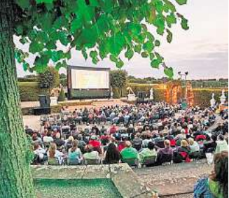
Kino unter freiem Himmel.

Am Sonnabend, 17. August, feiert „Bob Marley: One Love“ das Leben und die revolutionäre Musik der Reggae-Legende. Ab 20 Uhr gibt es Live-Musik, der Film läuft ab 21.30 Uhr. Von den Clubs in Camden zum Weltruhm, vom kometenhaften Aufstieg bis zum tiefen Absturz berührt die Biographie der Ausnahme-Sängerin und Musikerin Amy Winehouse in „Amy Winehouse: Back to Black“ am Sonntag, 18. August,