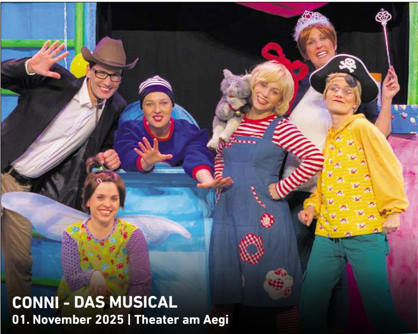
CONNI - DAS MUSICAL 01. November 2025 | Theater am Aegi

Ihr persönlicher Ticketservice der HAZ & NP