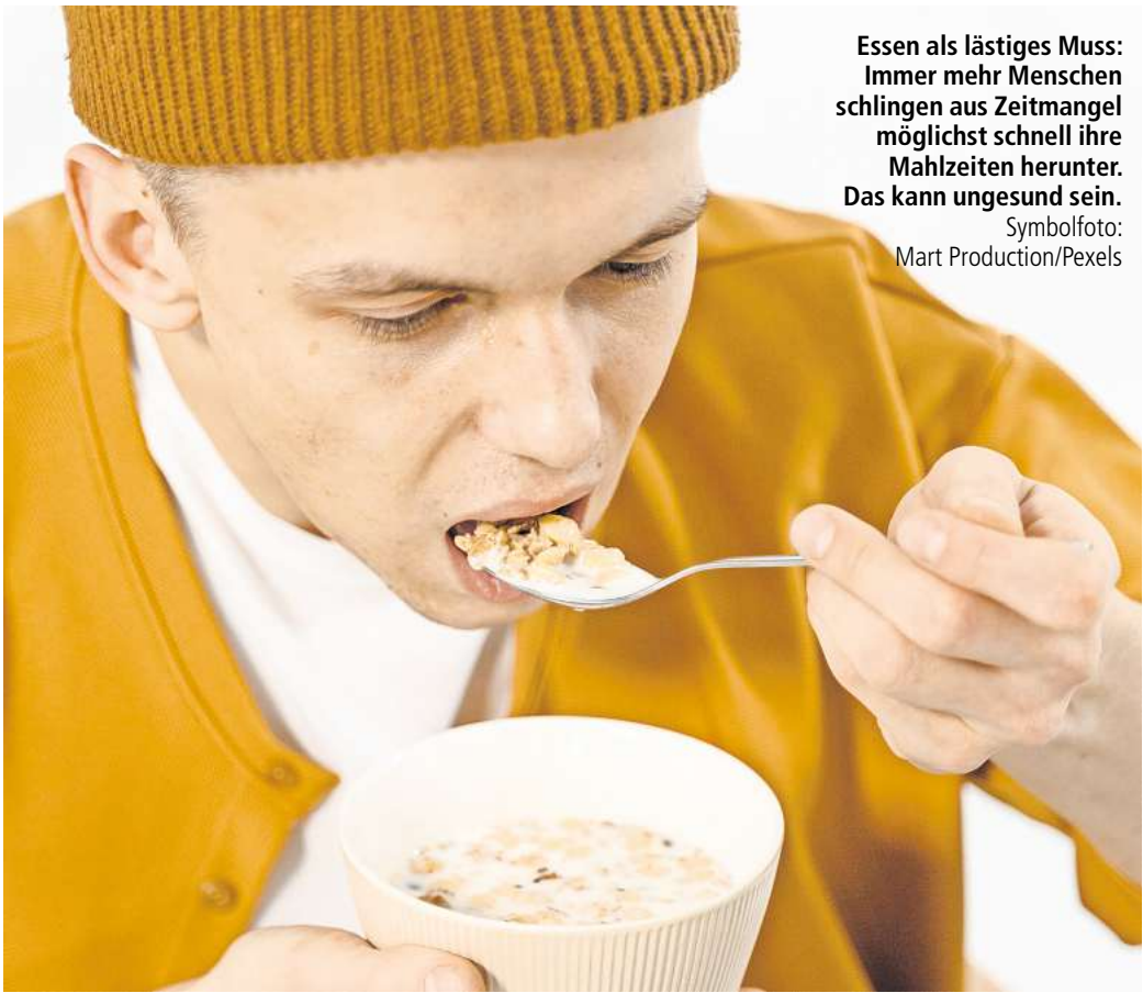
Essen als lästiges Muss: Immer mehr Menschen schlingen aus Zeitmangel möglichst schnell ihre Mahlzeiten herunter. Das kann ungesund sein.

Das Interessante ist, dass wir nicht einmal unbedingt länger essen, wenn wir mehr kauen – schließlich werden die Portionen dann auch kleiner. Unabhängig davon finde ich, dass es niemals das Ziel sein sollte, unbedingt als Erster beim Mittagessen fertig zu werden. Essen ist kein Leistungssport, sondern Genuss. Wenn ich den ganzen Geschmack mit allen Sinnen fühle, dann habe ich auch größere Freude am Essen. Sie werden schnell merken, dass das tatsächlich ein ganz neues Lebensgefühl ist.