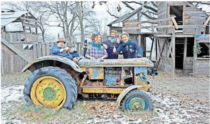
Egon und die Treckerfahrer kommen zum Open-Air in Vahrenwald.

Power Plush verbinden ab 20.30 Uhr Einschläge aus verschiedenen Jahrzehnten Popgeschichte, bewegen sich irgendwo zwischen Woodstock und College Rock, blumigem Indie, Post-Punk und Alternative aus der Zukunft – getrieben von federleichter Unmittelbarkeit, trotzdem voller Strom und immer mit dem Herzen voraus. RED