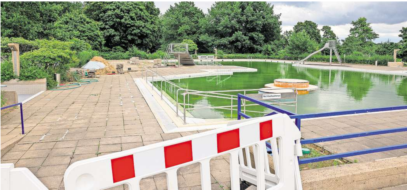
Leck und Rohrbruch: Im Lister Bad sind zwei Becken gesperrt.

Am kommenden Donnerstag, 8. August, legen Oberbürgermeister Belit Onay (Grüne) und Stadtkämmerer Axel von der Ohe (SPD) den neuen Doppelhaushalt für die Jahre 2025 und 2026 vor. Laufende Einnahmen und Ausgaben für die beiden Jahre werden darin ebenso festgeschrieben wie außerordentliche Investitionen. Noch ist unklar, wofür genau die Stadt künftig Geld ausgeben will, doch deutet sich an, dass sie Bäder und Sportstätten erneuern will. Nach Informationen dieser Redaktion hat die Stadt im neuen Doppelhaushalt rund 10 Millionen Euro für die Bäderrückbau vorgesehen. Das Geld wird