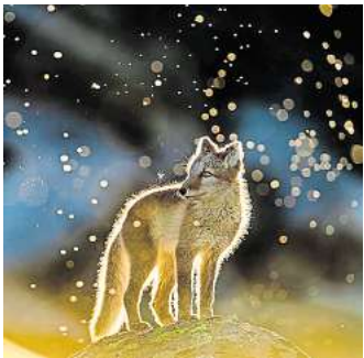
Foto-Beitrag von Arnfinn Johansen: Polarfuchs in einem Mückenschwarm. Foto: Arnfinn Johansen

HANNOVER. Der Verein Fotografie & Kommunikation präsentiert vom 3. August bis zum 10. Oktober die Fotoausstellung „GDT Europäischer Naturfotograf des Jahres 2021“ im Kunstgang der MHH, Carl-Neuberg-Straße 1. Präsentiert werden eindrucksvolle Fotos von Amateur- und Profifotografinnen und