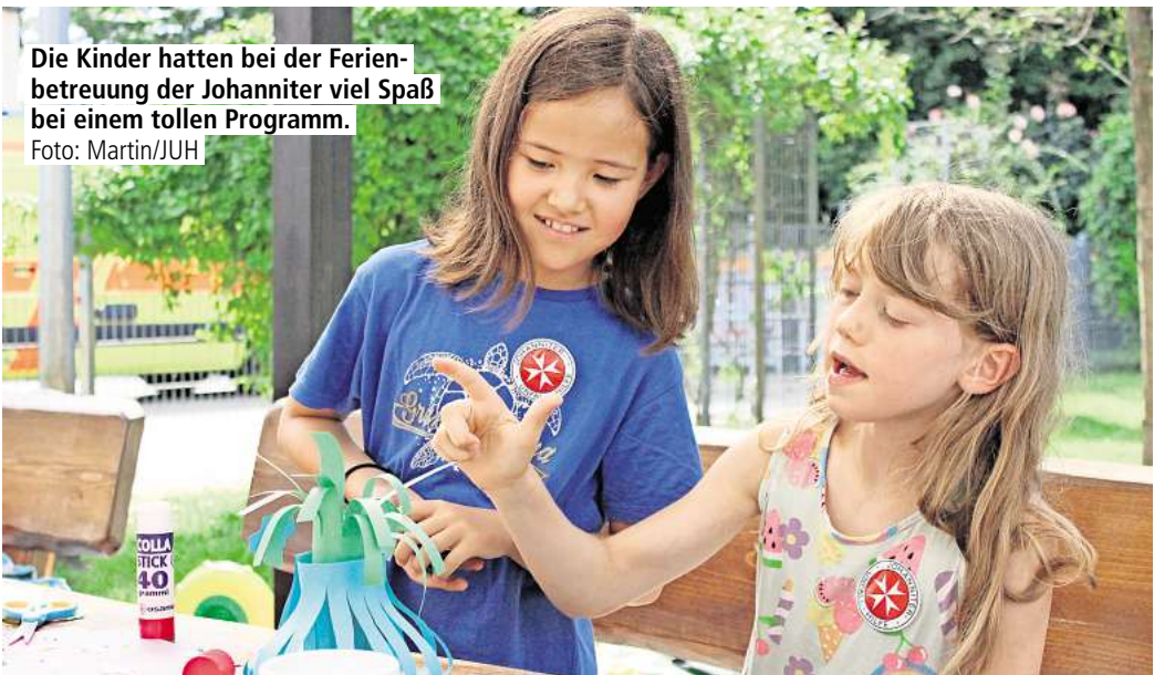
Die Kinder hatten bei der Ferienbetreuung der Johanniter viel Spaß bei einem tollen Programm.