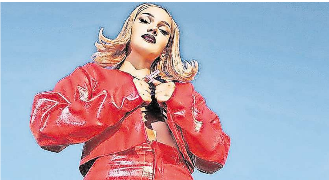
Gehört zu den Headlinern: Die Rapperin Shirin David kommt nach Hannover.

Beide stehen für eine neue feministische Grundeinstellung in der Musikindustrie: Shirin David ließ jüngst Thomas Gottschalk auflaufen, als sie darstellte, dass auch Frauen mit künstlichen Fingernägeln