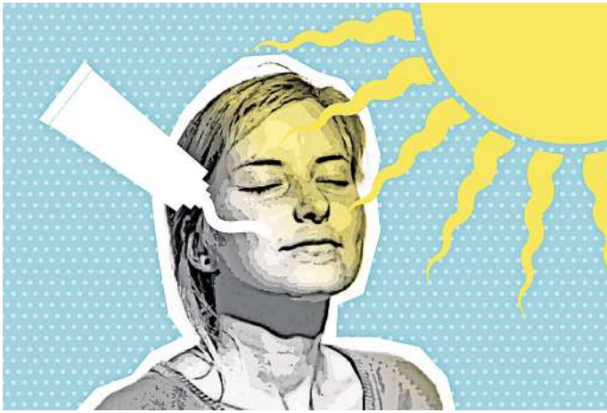
Sonne-Creme-VitD Die Sonne hilft dabei, Vitamin D zu bilden. Die Sonne kann aber auch Hautkrebs auslösen.

Wird dann gar kein Vitamin D mehr gebildet? Der Sonnenschutz verlängere zwar den Zeitraum, erklärt Baldermann, doch: „Kein Sonnenschutz kann komplett verhindern, dass UV-B-Strahlung die Haut trifft. Die Vitamin-D-Produktion wird immer angetriggert.“ Einen Sonnenbrand vermeiden, das sei wirklich das Allerwichtigste. Denn die Haut vergisst nicht.