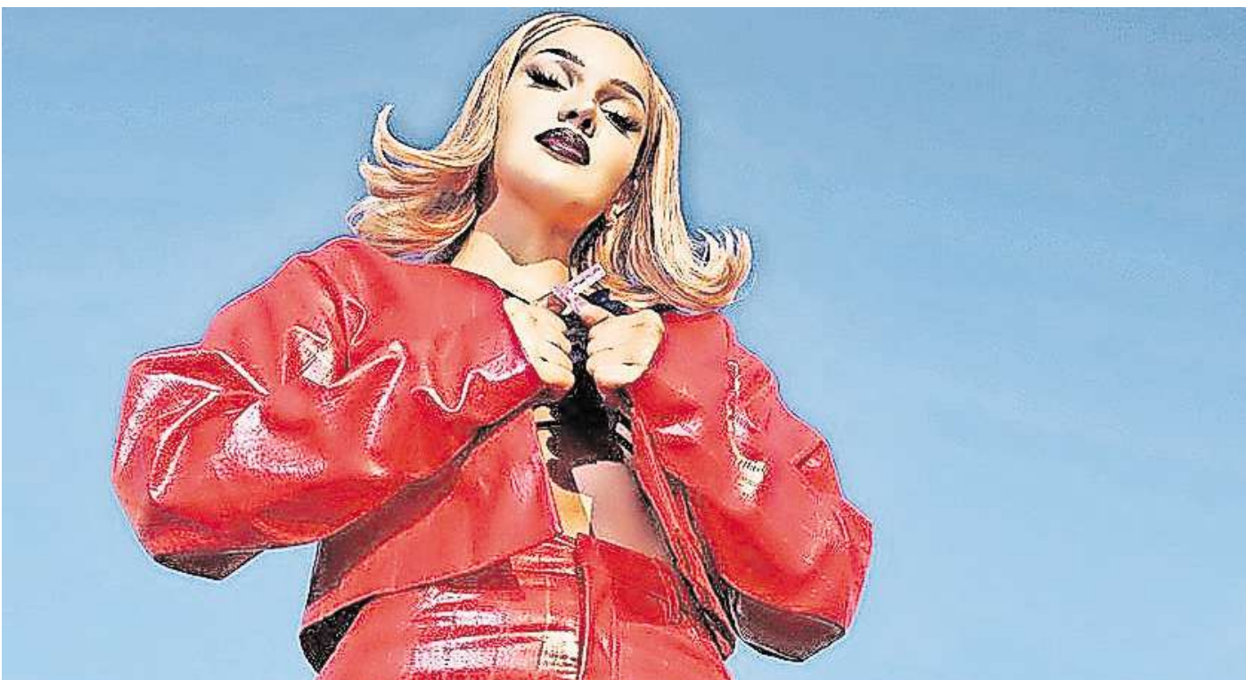
Gehört zu den Headlinern: Die Rapperin Shirin David kommt nach Hannover.

Opernkenntnisse haben können. Badmómzjay bringt ein ewig vernachlässigtes queeres Element in die Deutschrapp-Industrie, vertritt lange unterdrückte Identitäten in ihren Texten. In jüngeren Songs, Auftritten und Testimonials beider Künstlerinnen schwang allerdings ein unangenehmer Kommerz-Vibe mit, und die feministische Message drohte, in Müdigkeit und Promogeschäften zu verwässern. Ob der Hunger wieder da ist, wird man beim Heroes sehen. Mit Ufo361 und Reezy stehen zwei Helden der Cloud-Rap-Bewegung auf der Bühne.