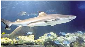
Im SEA LIFE Hannover erwartet die Besucher und Besucherinnen spektakuläre visuelle Erlebnisse in der Unterwasserwelt.

Limitierte Tickets nicht nur für das Sea Life Hannover sind beim Erlebnissommer der HAZ und NP unter www.erlebnissommer-tickets.de (zzgl. Gebühren und Versandkosten) zu bekommen. Hier warten auch Angebote mit bis zu 50 Prozent Rabatt beim Eintrittspreis von großartigen Attraktionen in Niedersachsen auf Sie. Alle Tickets sind auch in den Ticketshops und Geschäftsstellen der HAZ und NP erhältlich.