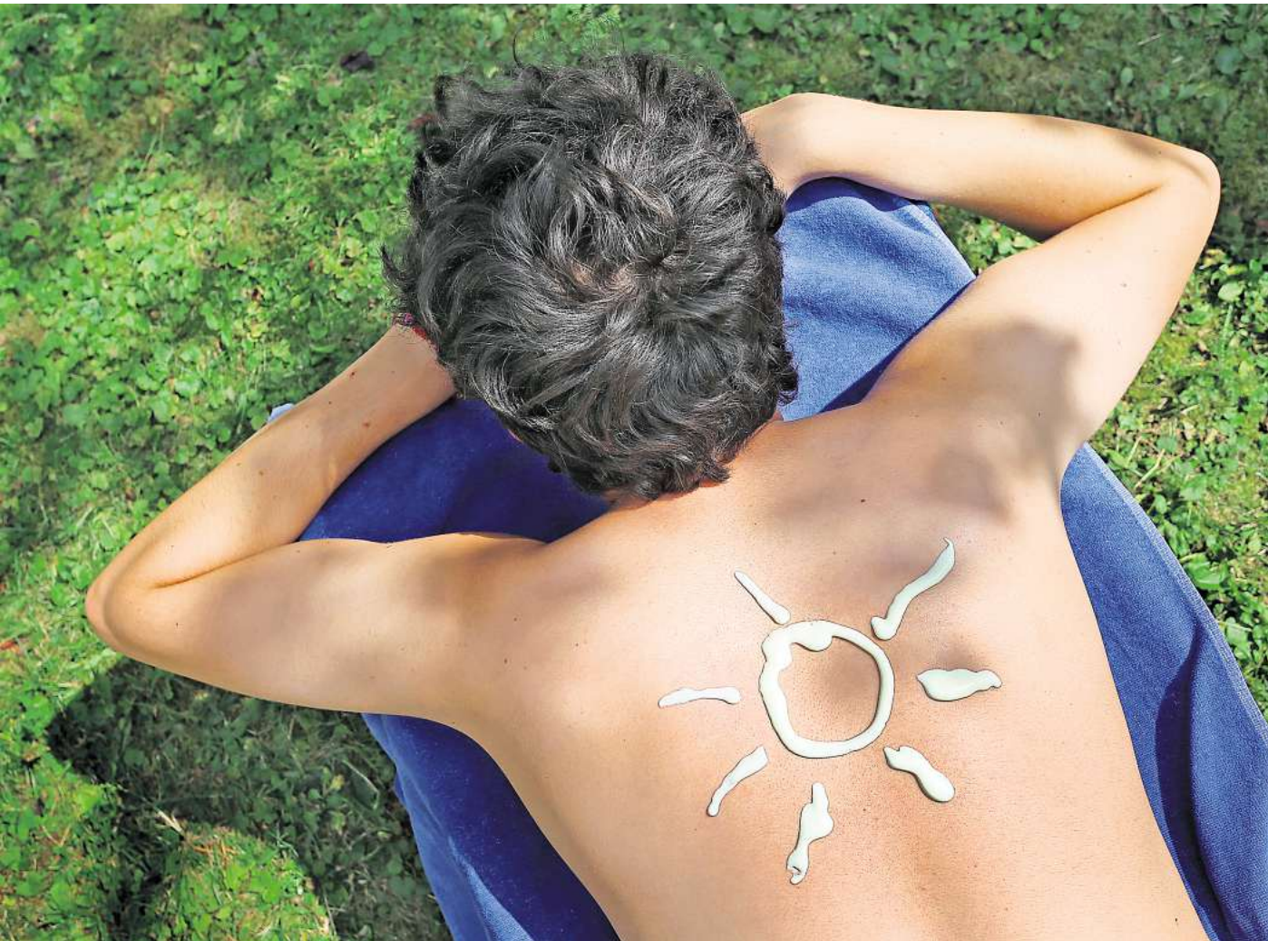
Gut gecremt heißt gut geschützt – nicht nur vor Sonnenbrand, sondern langfristig auch vor Hautkrebs.

Besonders Kinder sind gefährdet. Haben sie häufig Sonnenbrände, steigt das Risiko, im Laufe des Lebens schwarzen Haut-