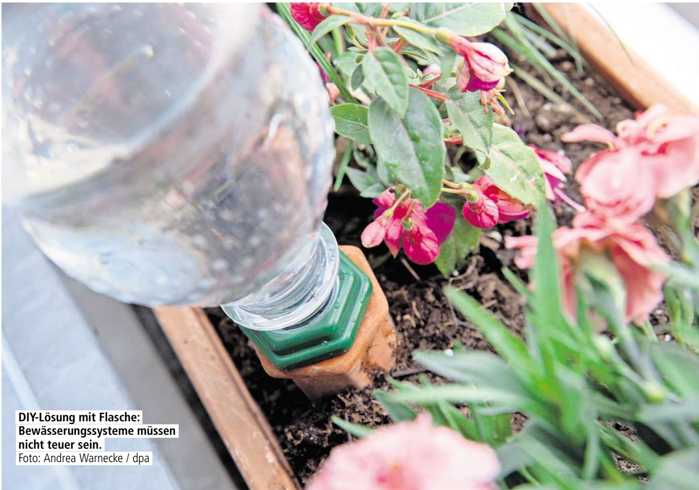
DIY-Lösung mit Flasche: Bewässerungssysteme müssen nicht teuer sein.

Auf dem Balkon sind den Wurzeln durch die Enge und geringe Tiefe der Pflanzgefäße allerdings Grenzen gesetzt. „Deshalb trocknen sie schneller aus. Balkonpflanzen müssen in der Regel öfter gegossen werden als Gartenpflanzen“, sagt Breidbach. Damit die obere Bodenschicht nicht so schnell austrocknet, empfiehlt es sich, eine drei bis vier Zentimeter starke Schicht aus Mulch oder Grasschnitt aufzubringen. Ein weiterer Tipp, um die Verdunstung zu