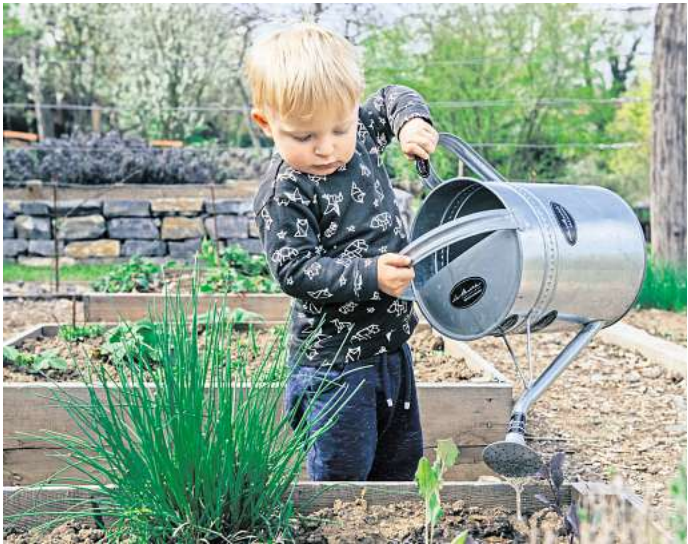
Die beste Zeit zum Gießen ist morgens.

Und noch ein Tipp, der Wasser und Arbeit – nämlich Rasenmähen – spart: Bleibt der Rasen etwas länger, wird Wasser besser gespeichert und verdunstet nicht so schnell. Hat man einen elektrischen Rasenmäher, spart man durch das seltenere Mähen zusätzlich noch Energie.