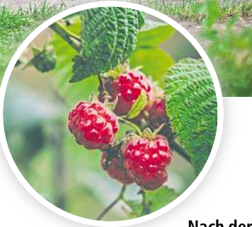
Nach der Himbeer-Ernte sollte man sich ans Zurückschneiden machen.

Sie werden im nächsten Jahr Früchte liefern. Wenn auch nach diesem Rückschnitt noch mehr als sieben bis acht Pflanzen pro Meter übrig bleiben, lichten Sie die Himbeeren etwas aus und entfernen sie überzählige Pflanzen. Die einzelnen Triebe, die