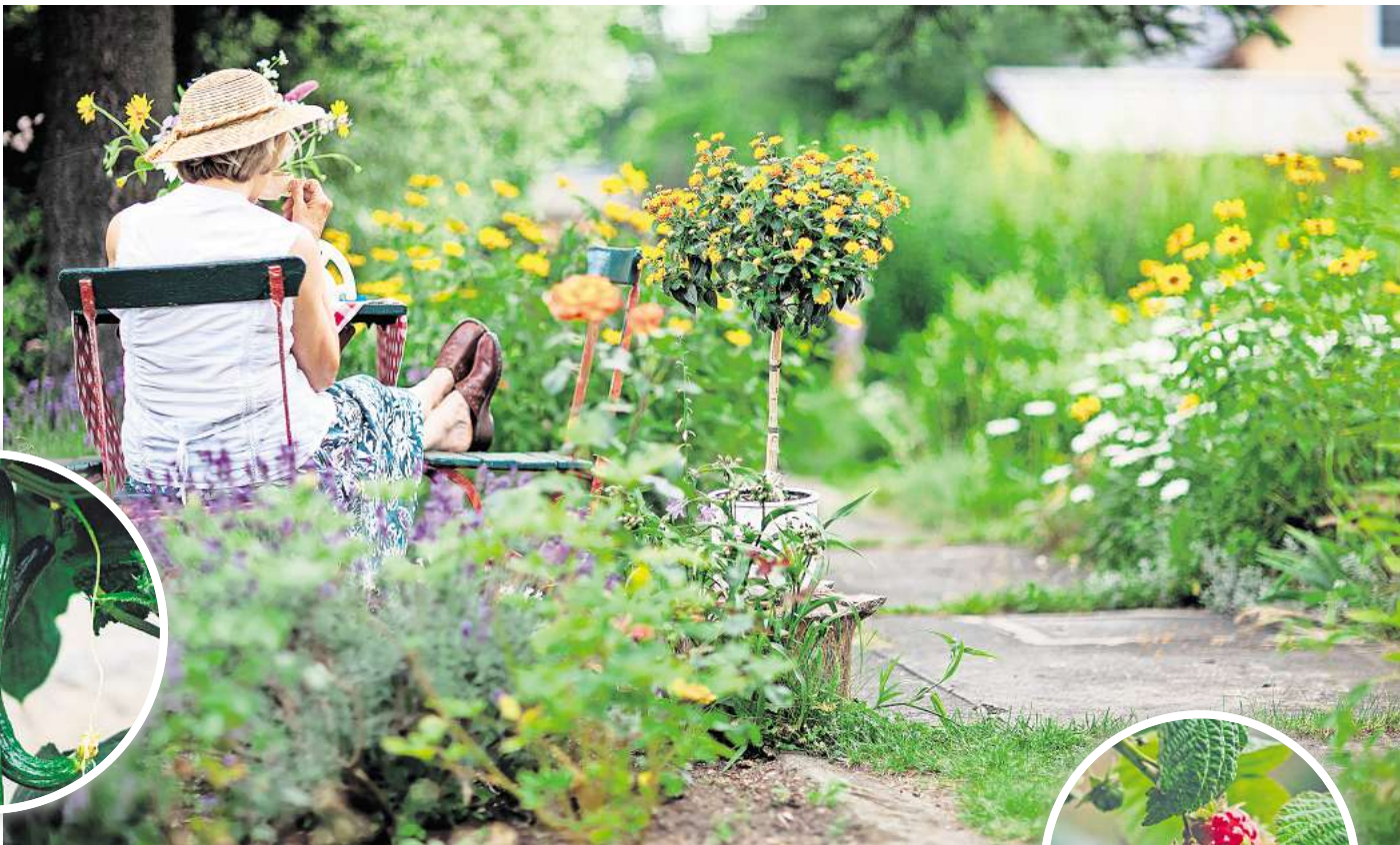
Schattenplätzchen gesucht: An warmen Juli-Tagen sollte man tagsüber lieber den Platz unter Bäumen genießen.

Bienenweide. Zur Blütezeit ist meist ein Brummen und Summen rund um die Pflanze zu hören. Ist der Steppen-Salbei verblüht, lohnt sich ein beherzter Griff zur Schere. Das radikal anmutende Einkürzen der Pflanze auf rund eine Handbreite über den Boden belohnt die Pflanze mit einer Nachblüte im Spätsommer. Wer noch keinen Steppen-Salbei im Garten hat und ihm einen vollsonnigen Standort