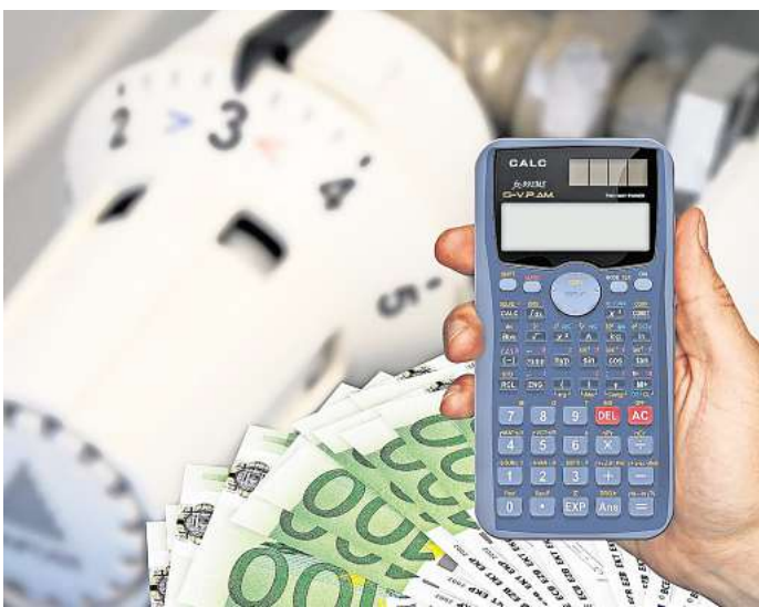
Bei der Heizkostenabrechnung für 2023 wird es für viele Haushalte zu hohen Nachzahlungen kommen.

einer Erhebung der Vergleichsplattform Check24 geht hervor, dass Gaskunden im Vergleich zum April 2021 aktuell 84 Prozent mehr zahlen. Etwas weniger heftig fiel die Steigerung beim Heizöl aus. Neben dem Ukraine-Krieg bringen die politisch gesetzten CO2-Preise Aufschläge: 2021 waren es 25 Euro pro Tonne Kohlendioxid, heute sind es 45 Euro. Rechnerisch sind damit die jährlichen CO2-Kosten in den drei Jahren von 108 auf 194 Euro gestiegen. Dieser Posten wird nach Check24-Berechnungen auf rund 280 Euro steigen, wenn die Bundesregierung wie geplant die CO2-Preise erhöht. Beim Heizöl würde dieser Posten im Musterhaushalt von derzeit 287 Euro sogar auf 414 Euro steigen.