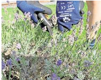
Zur Ernte die ganzen Stiele des Lavendel abschneiden.