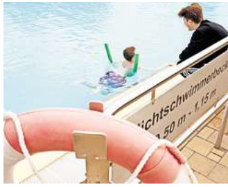
Einzeltraining: Für Kinder ohne Wassererfahrung nehmen sich die Trainer besonders viel Zeit.

Kinder lernen schnell in einem solchen Schwimmkursus, wenn Eltern ihren Nachwuchs früh an Wasser gewöhnen, mit ihnen