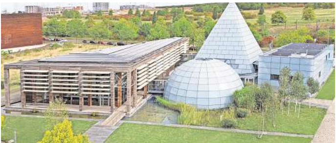
Inzwischen ein Energie-Plus-Haus: Der umgebaute Pavillon von Dänemark im Expo-Park Hannover.

Im Sommer wird die gewonnene Sonnenwärme vom Dach seines Büros in die Grundwasserblase zurückgeleitet, aus der er im Winter die Heizwärme gewinnt. So bleibt das Grundwasser auf Temperatur. Der Pavillon ist, obwohl er zusätzlich acht Ladesäulen für Stromaautos speist, bilanziell ein Energie-Plus-Haus. Dieses erzeugt mehr Energie als mit ihm verbraucht wird. „Langfristig müssen wir zu solchen Lösungen kommen, wenn wir unsere Klima- und Energieprobleme bewältigen wollen“, sagt Grobe.