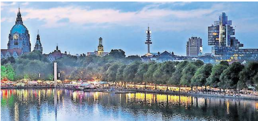
Blick auf Hannovers Skyline beim Maschseefest: Bei der Seesause wird der Bereich am Geibeltreff jetzt neu geordnet.

Gastronomisch bietet das Maschseefest 2024 auf insgesamt 20.000 Quadratmetern Internationales von orientalisch über mexikanisch, asiatisch, amerikanisch, skandinavisch bis zu hanseatisch-norddeutsch in den Klassifizierungen exklusiv, exotisch, gutbürgerlich und „auf die Hand“. Mehr als 4000 Sitzplätze gibt es am See. „Die Gastro-Fläche am See haben wir nicht erhöht. Nach dem Wetterdesaster im vergangenen Jahr hoffen wir jetzt darauf, dass die Besucher und Besucherinnen an allen Tagen wieder lustwandeln können am Maschsee“, so HVG-Chef Hans Nolte.