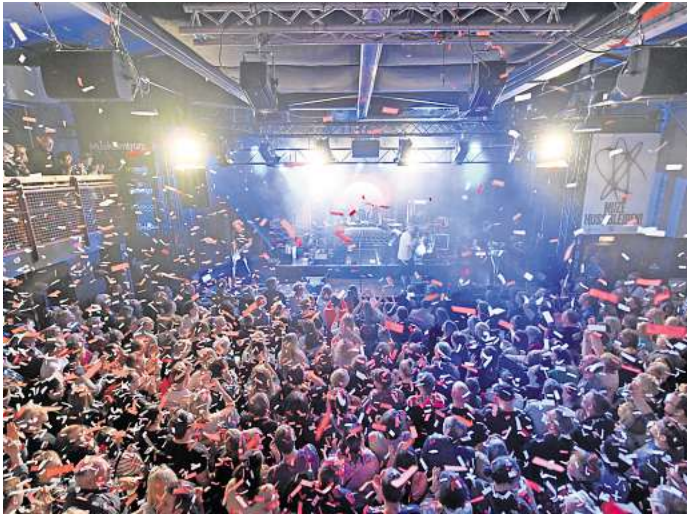
Das Musikzentrum bleibt für Konzerte bestehen.