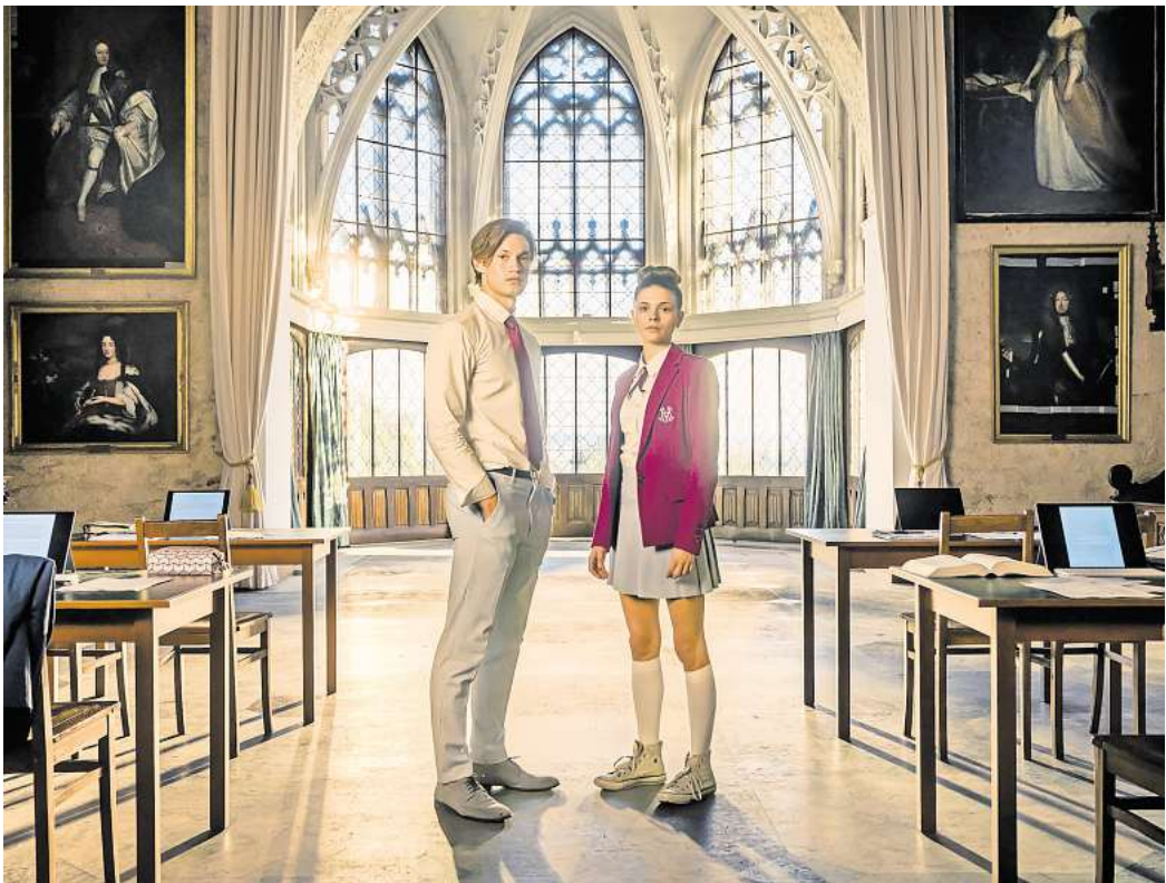
James Beaufort (Damian Hardung) und Ruby Bell (Harriet Herbig-Matten) in der Kulisse der Amazon-Serie „Maxton Hall“ auf Schloss Marienburg in Hannover.

► Die Zufahrt Ruby stammt aus einfachen Verhältnissen und muss im Gegensatz zu ihren Mitschülern und Mitschülerinnen mit dem Bus zur Schule fahren. Innerhalb der Serie tauchen deshalb auf Rubys Busfahrt oft die Landstraße zum Schloss Marienburg und die Zufahrt auf. In Folge vier holt James Ruby in der Zufahrt von der Bushaltestelle ab, und beide gehen zusammen zur Schule.