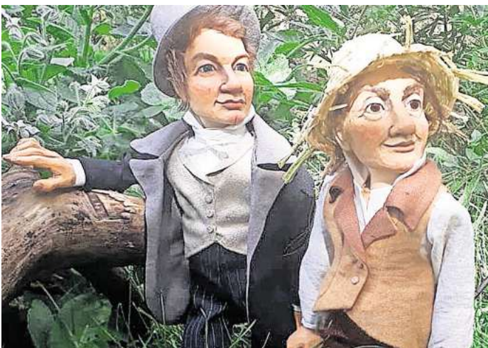
Auf Humboldts Spuren mit dem Figurentheater Neumond.