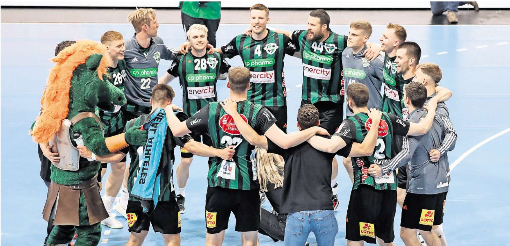
Tanzen noch einmal im Kreis: Die Recken nach dem Sieg am finalen Bundesliga-Spieltag gegen den HC Erlangen.

Saisonfazit der Handball-RECKEN: Fans und Nationalspieler in den Hauptrollen / Sie wollen zurück nach Europa