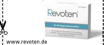
Abbildung Betroffenen nachempfunden REVOTEN. Wirkstoffe: Acidum silicicum Trit. D4, Calcium carbonicum Hahnemannii Trit. D4. Die Anwendungsgebiete entsprechen den homöopathischen Arzneimittelbildern. Dazu gehört: Bindegewebsschwäche. www.revoten.de • Zu Risiken und Nebenwirkungen lesen Sie die Packungsbeilage und fragen Sie Ihre Ärztin, Ihren Arzt oder in Ihrer Apotheke. • Remitan GmbH, 82166 Gräfelfing

Für Ihre Apotheke: Revoten Tabletten (PZN 18405588)