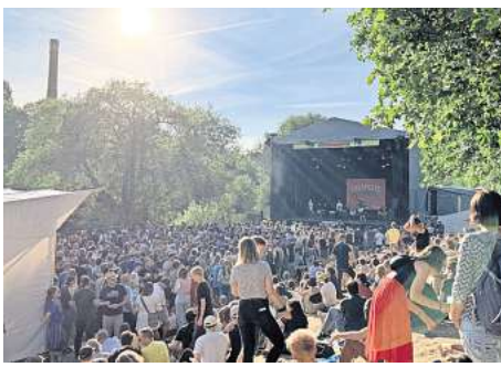
Feiern unter Sonnensonne: Die Fährmannsfestmacher hoffen in diesem Jahr auf besseres Wetter als im vergangenen Jahr, als das Programm für den Sonntag wegen Starkregens abgesagt werden musste.