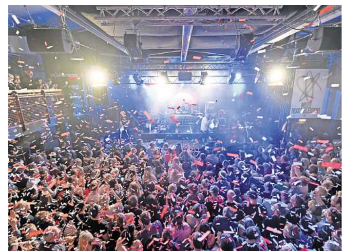
Das Musikzentrum bleibt für Konzerte bestehen.