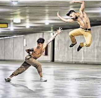
Choreographie „Meaningless“ von Diego de la Rosa

Tickets und Teilnehmende: choreography-hannover.de