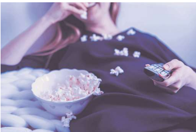
Zeit mit Unterhaltungssendungen verbringen, die man eigentlich gar nicht mag: „Hate Watching“ wird für manche Menschen zur Gewohnheit.