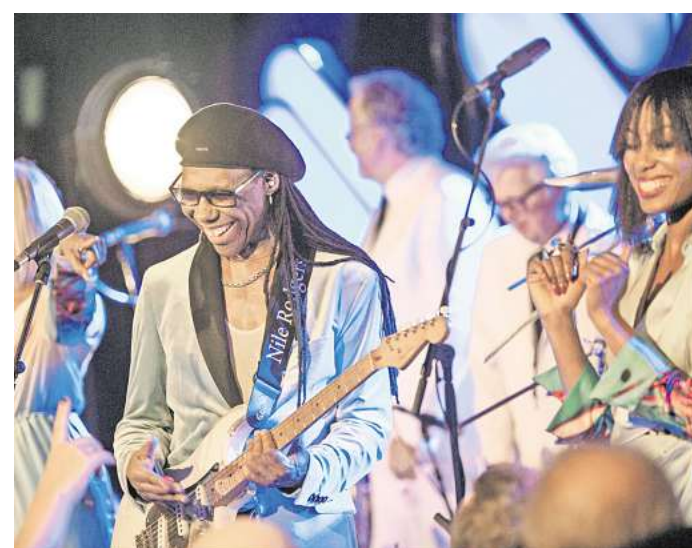
Nile Rodgers gastiert mit Chic auf der Gilde Parkbühne.

Am Sonntag, 30. Juni, ab 20 Uhr, gastiert Nile Rodgers mit Chic auf der Gilde Parkbühne. Tickets gibt es ab 71,25 Euro plus Gebühren an den bekannten VVK-Stellen sowie unter www.hannover-concerts.de oder www.myticket.de