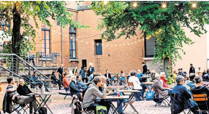
Schöner Schauplatz: Der Innenhof des Schauspielhauses und Kommunalen Kinos im Künstlerhaus (KoKi).

Der Raschplatz gilt als schwieriger Ort, da er bis vor Kurzem Treffpunkt von Drogen- und Dealerszene war. Im vergangenen Jahr hatte die Stadt zahlreiche Sport- und Musikangebote auf dem Platz eingerichtet und dadurch die Szene vertrieben. So soll es weitergehen. Nach der EM will die HVG zusammen mit dem Turn Klubb zu Hannover (TKH) ein Sportprogramm auf die Beine stellen. Ein Basketballfeld sowie ein Soccercourt – beides erfreute sich bei Jugendlichen großer Beliebtheit – sollen wieder aufgebaut werden. „Das kostenlose Sportprogramm, das über die Website ‚raschplatz-openair‘ gebucht werden kann, ist vom 18. Juli bis zum 20. September geplant“, heißt es in der Verwaltungsvorlage.