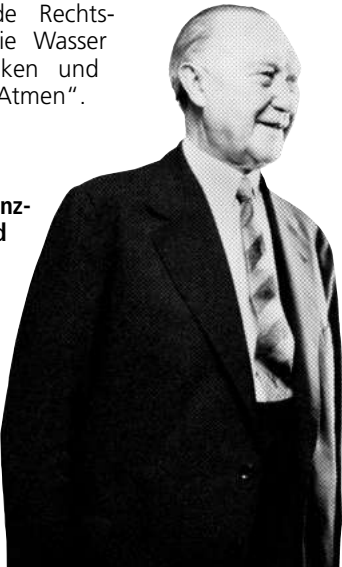
Der erste Bundeskanzler Konrad Adenauer im Jahre 1958.

Das Grundgesetz hat den Durchbruch zum Rechtsstaat geschafft: mit klaren Regeln, einem starken Verfassungsgericht – und dem Verzicht auf Klimbim. Die Verfassung der DDR versprach noch wehevoll „die Erhöhung des materiellen und kulturellen Lebensniveaus des Volkes“. Solche bloßen Programmsätze, schön schaumig, aber nicht einklagbar, nützen in Wahrheit niemandem.