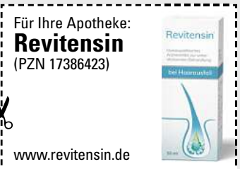
Abbildung Betroffenen nachempfunden. REVITENSIN. Wirkstoffe: Acidum hydrofluoricum D12, Graphites D12, Pelletariae D12, Selenium D12, D12, Thallium metallicum D12, D12. Homöopathisches Arzneimittel zur unterstützenden Behandlung bei Haarausfall. www.revitensin.de • Zu Risiken und Nebenwirkungen lesen Sie die Packungsbeilage und fragen Sie Ihre Ärztin, Ihren Arzt oder in Ihrer Apotheke. • PharmaSGP GmbH, 82166 Gräfelfing

Egal in welchem Alter oder Lebensphase: Wir Frauen stylen uns gerne, um unsere Haare in Form zu bringen. Aber wenn wir merken, dass die Haare zunehmend ausfallen , ist das erschreckend! Dabei ist uns schönes Haar doch so wichtig! Immer mehr Anwenderinnen vertrauen inzwischen auf das rezeptfreie Revitensin (Apotheke), das verschiedene Formen von Haarausfall von innen bekämpfen kann. Bei Revitensin ist keine äußere Anwendung erforderlich, sodass die Frisur nicht darunter leidet. Die natürlichen Arzneistoffe werden einfach mit einem Glas Wasser eingenommen. Neben- oder Wechselwirkungen sind nicht bekannt. Aufgrund der Wachstumsphase der Haare empfiehlt der Hersteller eine Einnahme von mindestens 12 Wochen.