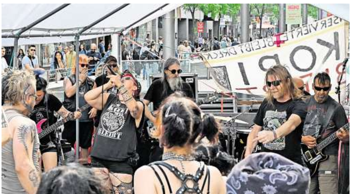
Musikalische Unterstützung: Die Band „Unwucht“ unterstützt den Protest gegen die Schließung des Punkertreffs „Kopi“ in Hannovers Nordstadt.

Jahr 2022 auf derzeit etwa 170 gewachsen. Viele Jahre habe der Treff bestanden und sei eine wichtige Anlaufstelle für junge Menschen gewesen, betont Sandra. Beide Frauen bedauern vor allem, dass Jugendliche künftig möglicherweise darauf verzichten müssen. Ihnen selbst habe der Treff sehr geholfen. Sie hätten mittlerweile in ein Berufsleben gefunden und Familien gegründet. Sandra sieht die Situation durchaus realistisch – finanzielle Hilfe von der Stadt sei wohl nicht zu erwarten, sagt sie und drückt