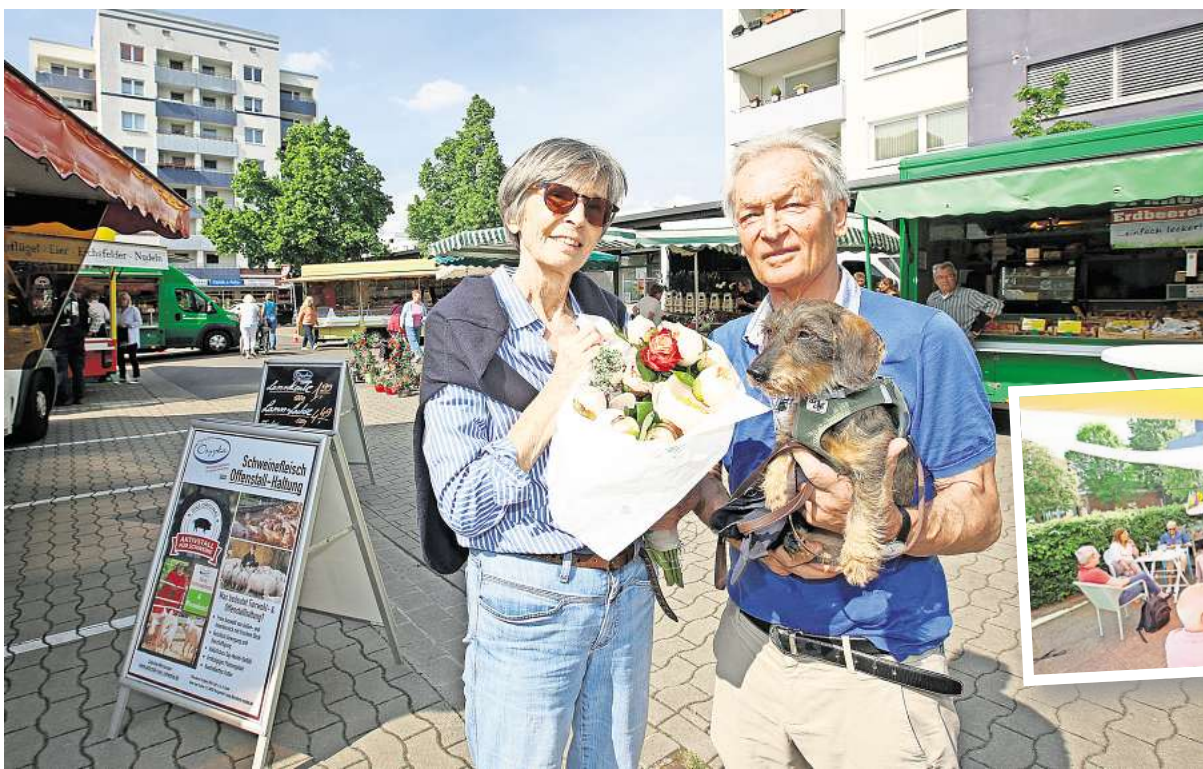
Willkommen auf dem Wochenmarkt: Das Heideviertel hat sich bei unserer großen Stadtteilumfrage als beliebtestes Quartier Hannovers erwiesen.

„Wir unterstützen uns“, sagt Detlef Lenger von der Bundespolizei. Eine gemischte Streife aber scheitert allein an rechtlichen Fragen, beispielsweise dem Datenschutz: „Als Polizei können wir ganz andere Daten abfragen oder erfassen als private Sicherheitsdienste“, sagt er. Daran ändere auch die Fußball-EM nichts – wenn möglicherweise mehr Beamte im Einsatz sein werden, um Fans zu betreuen und Reisenden ein Gefühl von mehr Sicherheit zu vermitteln.