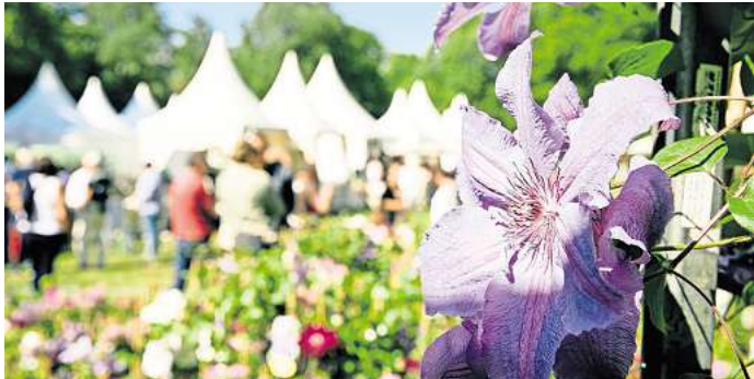
Schlendern, stöbern und schlemmen: Das Gartenfestival Herrenhausen lädt zum Flanieren ein.

schem Spargel, Kaffee und Kuchen oder erfrischenden Cocktails lässt sich wunderbar die Atmosphäre genießen. Das Gartenfestival Herrenhausen in den Herrenhäuser Gärten, Herrenhäuser Straße 1, ist noch bis 20. Mai geöffnet, am Sonnabend und Sonntag jeweils von 10 bis 19 Uhr, sowie am Montag von 10 bis 18 Uhr. Der Eintritt kostet an den Tageskassen vor Ort 12 Euro, ermäßigt 9 Euro, Kinder bis 17 Jahren haben freien Eintritt. Für den Jubiläumstag am Sonnabend: 9 Euro, Tickets im Vorverkauf auf der Homepage vergünstigt.