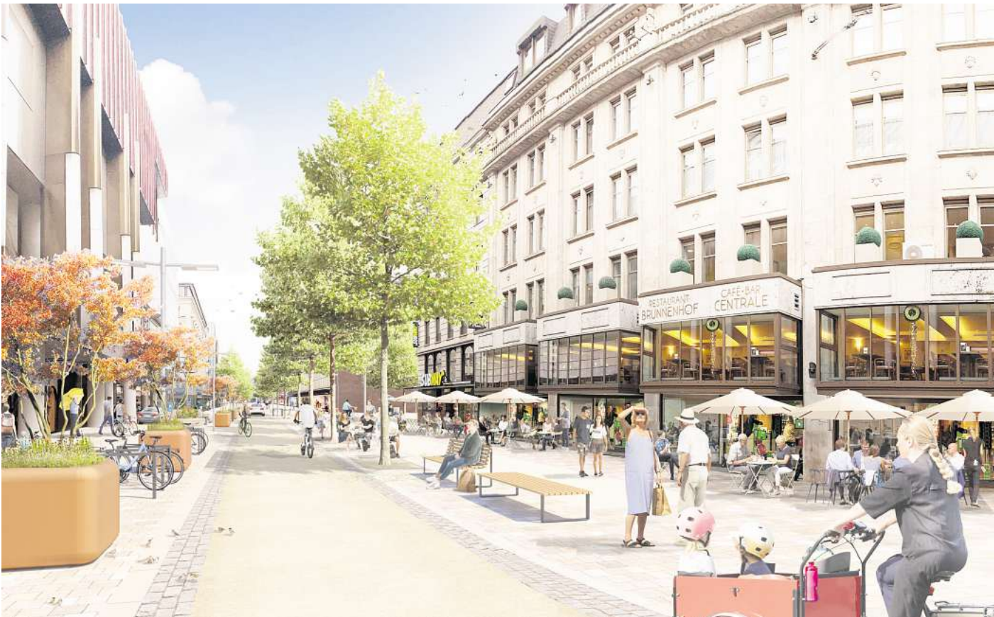
Die Visualisierung zeigt die Pläne von vor zwei Jahren. Der aktuelle Entwurf dürfte ähnlich aussehen, jedoch mit Parkplätzen an den Straßenseiten.

Die Entwürfe verschwanden in der Schublade. Dass die Schillerstraße attraktiver werden soll, ist in weiten Teilen des Rates unstrittig. Dem Vernehmen nach unterscheiden sich die neuen Umbaupläne nicht wesentlich