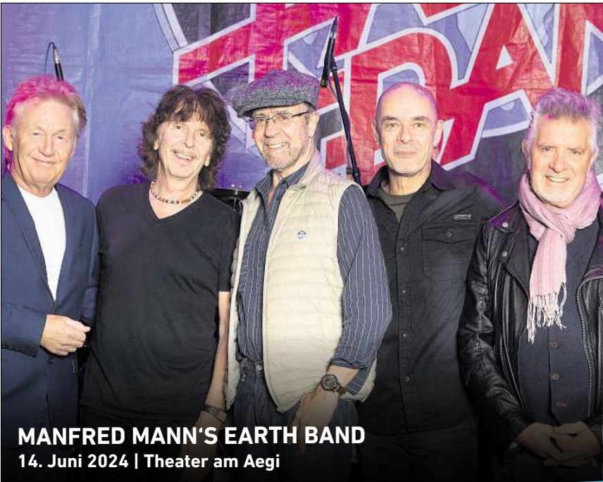
MANFRED MANN'S EARTH BAND 14. Juni 2024 | Theater am Aegi

Ihr persönlicher Ticketservice der HAZ & NP