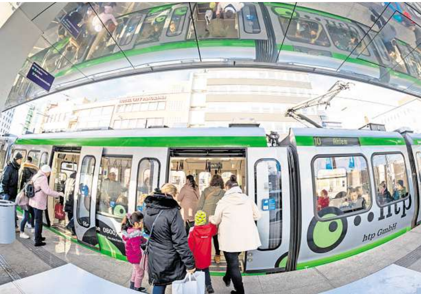
Abgerechnet wird erst am Ende: Die Üstra führt einen neuen eTarif ein, der über die Üstra-App bargeldlos online abgerechnet wird.

Fährt man mehrmals am selben Tag oder in derselben Woche, werden die Einzeltickets zu Tages- oder Wochenkarten gebündelt. Damit der Weg des Fahrgastes nachvollzogen werden kann, erkennen die an CiBo teilnehmenden Smartphones die Geodaten und übertragen sie an das Backend-System. Bei Fahrzeugen und Haltestellen mit Sendern, den sogenannten Beacons auf Basis von Bluetooth, wird die Entfernung des Smartphones zum Beacon-Signal ausgewertet. Ist die Entfernung zu groß, wird das als Verlassen des Fahrzeuges gewertet. Sofern