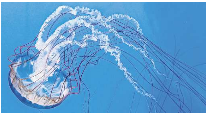
Unterwasserwesen: die Kompassqualle.