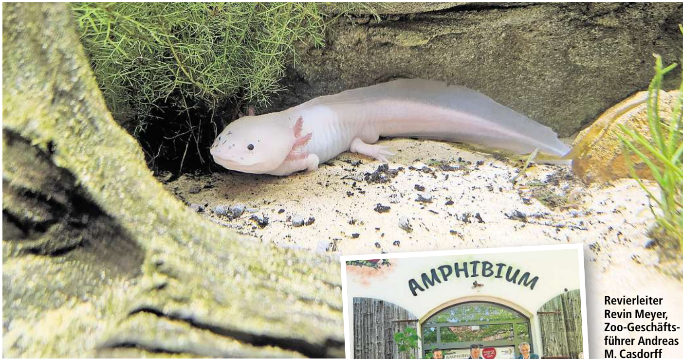
Stammen aus Mexiko: die Axolotl.

Besuchende haben das Ohr am Teich, wenn sie selbst zu Freilandforschenden werden und spielerisch versuchen, die Anzahl der quakenden Frösche zu ermitteln oder den Bestand der