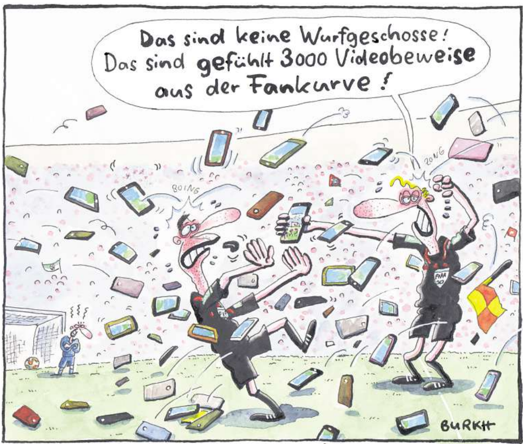
BURKH: „Videobeweis ist keine Lösung“

Courtesy of the artist / Museum Wilhelm Busch (2)