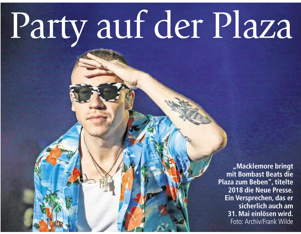
„Macklemore bringt mit Bombast Beats die Plaza zum Beben“, titelte 2018 die Neue Presse. Ein Versprechen, das er sicherlich auch am 31. Mai einlösen wird.

„Summer Of 69“, „Everything I Do“, „Cuts Like a Knife“, „Run to You“, „Have You Ever Really Loved A Woman“, „Here I Am“ oder „So Happy It Hurts“ sowie einer energiegeladenen Performance. Tagestickets für die N-JOY Starshow und das NDR 2 Plaza Festival sind jeweils für 59 Euro bei Hannover Concerts (0511/12 12 33 33, hannover-concerts.de), www.eventim.de und an allen bekannten Vorverkaufsstellen zu haben. Kombitickets kosten 109 Euro. Je nach Art der Ticketbestellung (VVK-Stelle, Telefon, Internet) können zusätzliche Gebühren für Bearbeitung und Versand hinzukommen. Kinder bis sechs Jahre haben jeweils freien Eintritt. Die Tickets berechtigen zur Nutzung der öffentlichen Verkehrsmittel an den Veranstaltungstagen im Bereich des Großraum-Verkehrs Hannover (GVH).