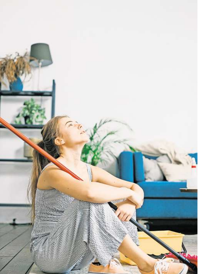
„Mein Mann war das schwierigste Kind“ – Immer mehr Frauen haben angeblich keine Lust mehr auf Partnerschaften, in denen sie sich neben ihrem Job alleine um Mann, Kinder, Haushalt und Familienmanagement kümmern müssen.