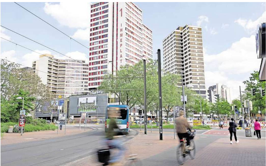
Unfreiwillig zur Kasse gebeten: Im Ikme-Zentrum müssen wegen der Insolvenz der Windhorst-Tochtergesellschaft Nebenkosten in großem Stil auf alle umgelegt werden.

Die Eigentümerversammlung bestätigte ihre Verwaltungsbeiräte Jürgen Oppermann und Erika Obenhaus mit großer Stimmenmehrheit im Amt und brachte zudem Pläne für große Photovoltaikanlagen auf den Weg. Tausende Quadratmeter Dachflächen könnten mit Modulen belegt werden. Allerdings sollen Gutachten zunächst Fragen von Statik und Winddruck klären.