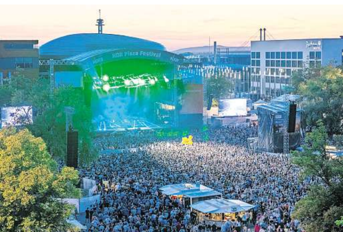
Am 1. Juni bebt die Plaza.