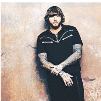
James Arthur

Tagetickets für die N-Joy Starshow und das NDR 2 Plaza Festival gibt es jeweils für 59 Euro bei Hannover Concerts unter der Hotline (0511) 12 12 33 33, unter hannover-concerts.de und an den bekannten Vorverkaufsstellen. Kombitickets kosten 109 Euro. Je nach Art der Ticketbestellung können zusätzliche Gebühren hinzukommen. Kinder bis sechs Jahre haben freien Eintritt. Die Tickets berechtigen zur Nutzung der öffentlichen Verkehrsmittel an den Veranstaltungstagen im Bereich des GVH.