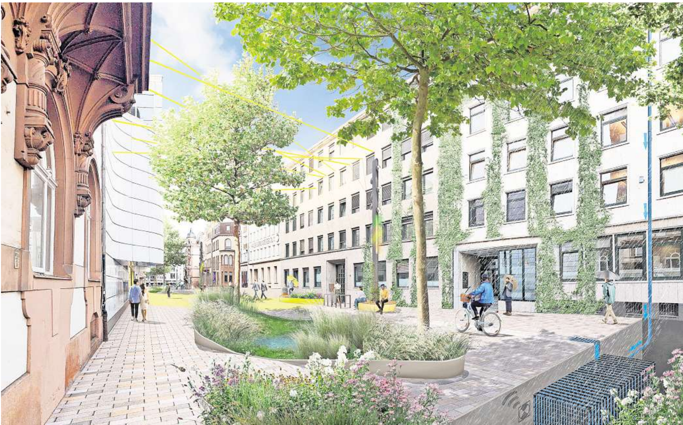
Beete, Bäume, Wasserspeicher: So stellt sich die Stadt Hannover die an den Klimawandel angepasste Prinzenstraße vor.