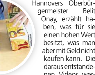
Puzzlespiel rund um Banknoten

Zudem haben Kinderreporterinnen und -reporter aus dem Zinnober Interviews geführt, in denen sowohl Kinder als auch Erwachsene, unter ihnen Hannovers Oberbürgermeister Belit Onay, erzählt haben, was für sie einen hohen Wert besitzt, was man aber mit Geld nicht kaufen kann. Die daraus entstandenen Videos werden als Teil der Ausstellung „Geld Geschichten“ gezeigt.