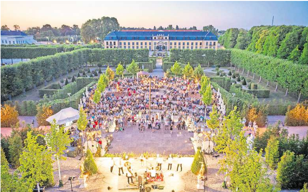
Die Sommernächte im Gartentheater sorgen wieder für Kulturgenuß in stimmungsvoller Open-Air-Kulisse.

„Macht Worte!“ präsentiert auch in diesem Jahr wieder zwei