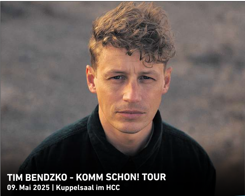
TIM BENDZKO - KOMM SCHON! TOUR 09. Mai 2025 | Kuppelsaal im HCC