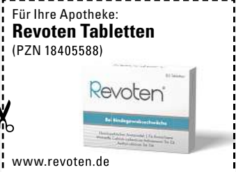
Abbildung Betroffenen nachempfunden. REVOTEN. Wirkstoffe: Acidum silicicum Trit. D4, Calcium carbonicum Hahnemannii Trit. D4. Die Anwendungsgebiete entsprechen den homöopathischen Arzneimittelbildern. Dazu gehört: Bindegewebsschwäche. www.revoten.de • Zu Risiken und Nebenwirkungen lesen Sie die Packungsbeilage und fragen Sie Ihre Ärztin, Ihren Arzt oder in Ihrer Apotheke. • Remitan GmbH, 82166 Gräfelfing

So können unschöne Anzeichen von Bindegewebsschwäche wie schlaffe Haut und Cellulite natürlich von innen bekämpft werden.