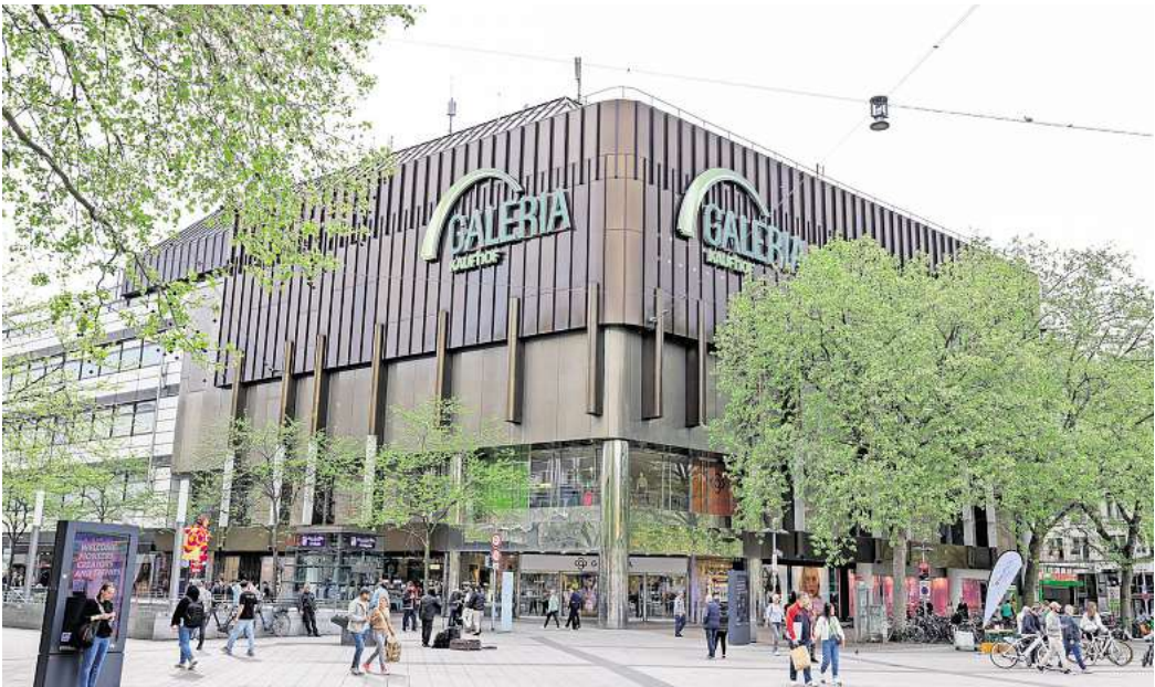
Die Galeria Kaufhof-Filiale am Hauptbahnhof muss nicht schließen.