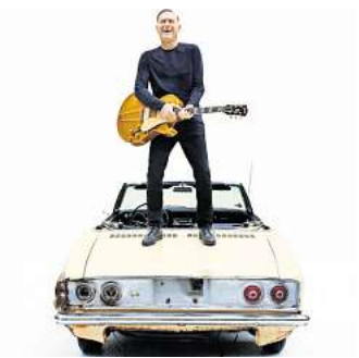
Bryan Adams

In nicht einmal mehr vier Wochen bebt wieder der Platz zwischen Deutschem Pavillon und ZAG Arena wenn N-Joy und NDR 2 zum Plazafestival laden. Los geht es am Freitag, 31. Mai, ausnahmsweise mit der N-Joy Starshow (sie ist traditionell eigentlich am Sonnabend), am Sonnabend, 1. Juni, folgt das NDR 2 Plaza Festival. Beide Tage sind picknackepackevoll mit Musik. Am Freitag stehen neben Headliner Macklemore auch Robin Schulz, Jess Glynne, Ray Dalton und Alle Farben auf der Bühne. Alle Farben eröffnet auch am Sonnabend, 1. Juni, das NDR 2-Programm. Die Mannheimer Elektro-Pop-Band ClockClock übernimmt den Staffeltab vom Opener. Bevor Kanadas Superstar Bryan Adams das Musikwochenende beendet, stehen mit Clueso und James Arthur zwei weitere Top-Acts auf der Bühne.