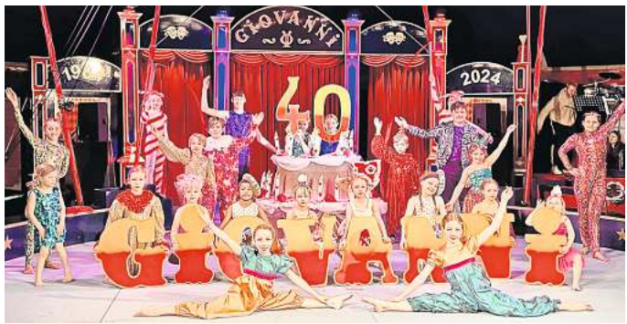
40 Jahre Kinderzirkus Giovanni.

Alle Termine und Tickets: kinderzirkus-giovanni.de