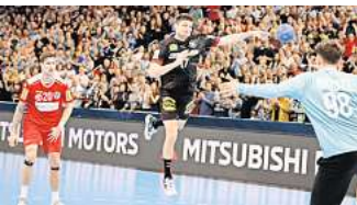
Das Spiel Deutschland gegen Österreich bei der Olympia-Qualifikation 2024 in Hannover.

den. Was den Ausschlag gegeben habe, will sie nicht verraten. Zu Details äußere man sich nicht, sagt die Sprecherin. Stadt und Region Hannover hatten ihre Bewerbung fristgerecht eingereicht. Aus Karlsruhe lag bis zum 2. April, dem Ende der Bewerbungsfrist, noch keine offizielle Bewerbung beim DOSB vor. Das bestätigte die Stadt Karlsruhe kürzlich auf Nachfrage dieser Redaktion. Selbst ein politischer Beschluss steht in Karlsruhe noch aus. Erst am 23. April soll der Gemeinderat eine Entscheidung über die Bewerbung fällen. Das geht aus Verwaltungsunterlagen der Stadt Karlsruhe hervor, die dieser Redaktion vorliegen. Das bedeutet: Der DOSB hat Karlsruhe grünes Licht gegeben, obwohl das höchste Entscheidungsgremium der Stadt noch nicht einmal über eine Bewerbung entschieden hat. Funktionäre des Deutschen Olympischen Sportbunds waren aber im vergangenen Jahr an Vertreter der Stadt Karlsruhe herangetreten und hatten sie gefragt, ob sie die World Games ausrichten wollten. Danach ließ man sich in Karlsruhe offenbar Zeit, eine offizielle Bewerbungsmappe zusammenzustellen. Anfang des Jahres entschied sich Hannover, ebenfalls die World Games ausrichten zu wollen. Im Rathaus Hannovers ist der Unmut über die Entscheidung des DOSB groß. Dennoch halten sich Oberbürgermeister Belit Onay (Grüne) und Regionspräsident Steffen Krach (SPD) mit kritischen Statements zurück. Man wünsche der Stadt Karlsruhe viel Erfolg für die Vorbereitung des Events, sagen Onay und Krach gleichlautend.