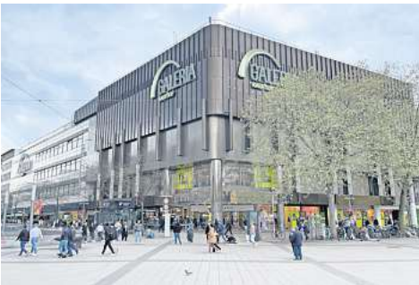
Zukunft mal wieder ungewiss - aber alles andere als hoffnungslos: Das Gebäude von Galeria Karstadt-Kaufhof in Hannover am Ernst-August-Platz / Ecke Bahnhofstraße, Foto: Conrad von Meding

Auch das ehemalige Bettenhaus Schillerstraße steht leer. Der ehemalige Kaufhof in der Altstadt wird seit gut einem Jahr als „Aufhof“-Projekt mit einem Kultur- und Kreativprogramm sowie von den Hochschulen bespielt. Signa hatte es kurz vor dem Insolvenzverfahren noch abgegeben.