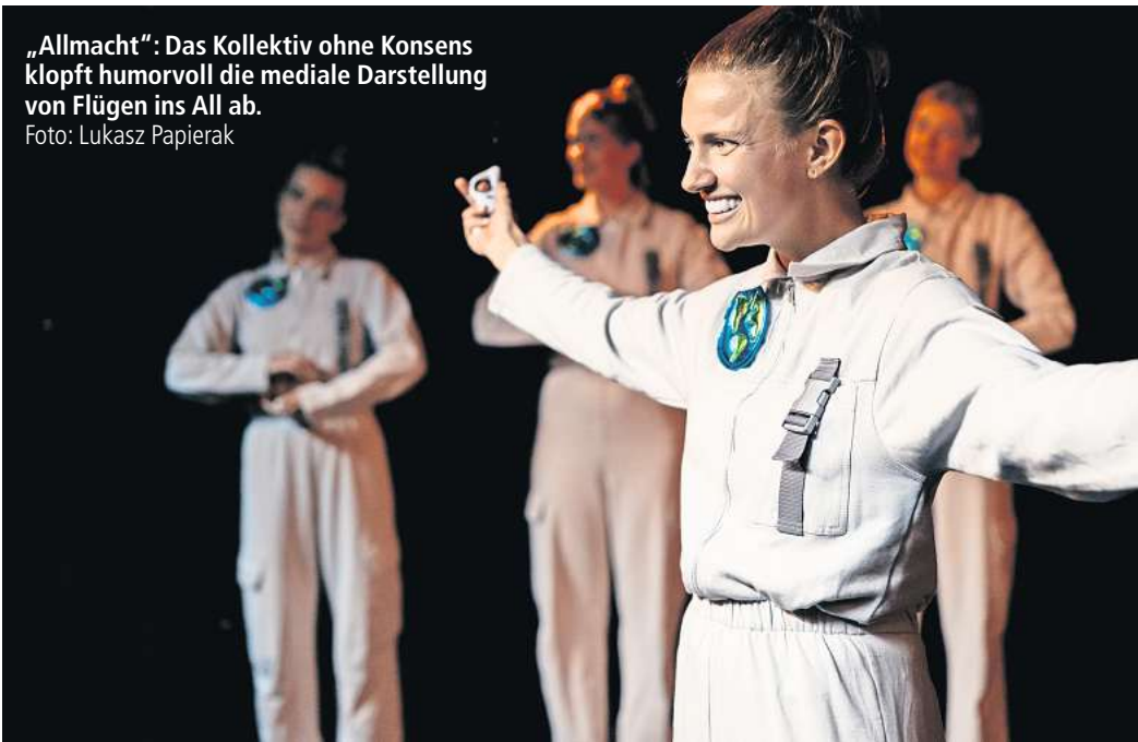
„Allmacht“: Das Kollektiv ohne Konsens klopft humorvoll die mediale Darstellung von Flügen ins All ab.

Blick auf die eigenen Körper anzu-zeigen und Körper als wertneut-ral zu inszenieren: „Fragmentez“ von rio&dio productions verbинdet Körper und Live-Videobilder zu einer mystisch-utopischen Welt ab 14 Uhr auf Bühne 1.