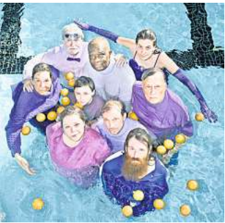
Stranden: Operation Wolf Haul.

Eine Performance ohne Spra-che wagt den Versuch, sich den