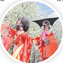
Hanami mit Walkacts

Kinder der Südstadt-schule singen, eine Taiko-Trommelperformance von Na-nami Daiko sorgt für mitreißende Rhythmen und der charmante Hoch-stelzen-Walkact mit der Compag-nie Millelieux ver-zaubert die Gäste vor Ort. Kreatives zum Mitmachen gibt es mit Kalligrafie: Shodo, die Kunst des Schönschreibens, außerdem wird die Papierfalt-kunst Origami gezeigt und ver-mittelt und Barbara Gschwendt-ner bemalt mit Kindern Keramik. Wer entspannt beim Shiatsu mit-machen oder das Go-Spiel ken-nenlernen möchte, hat dazu