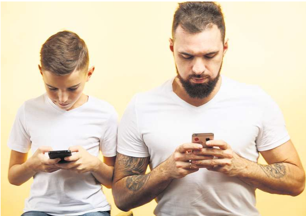
Durchaus herausfordernd: Für Eltern ist es oft gar nicht so einfach, in Sachen digitaler Mediennutzung ein Vorbild für die Kinder zu sein.

„Kinder sehen ständig, wie ihre Eltern mit dem Handy beschäftigt sind, und sie denken sich: Das ist ganz normal, das ist Teil der Kommunikation.“ Auch