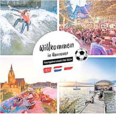
Willkommen: Hannover trägt zwar kein EM-Spiel aus, dafür aber gastieren drei Teams in der Stadt oder in der Nähe. Deswegen startet die HMTG jetzt eine Besucherkampagne für Fußball-Fans aus diesen Ländern.

hat die Hannover Marketing und Tourismus GmbH (HMTG) jetzt eine Besucherkampagne gestartet, damit Hotellerie und Gastronomie, aber auch touristische Einrichtungen wie der Erlebnis Zoo oder die Herrenhäuser Gärten von diesem sportlichen Großereignis im Sommer profitieren – auch ohne EM-Spiel in der Heinz-von-Heiden-Arena. „Das Turnier ist mehr als ein sportliches Großereignis. Es ist ein globales Kulturphänomen und vereint Millionen von Menschen. Daher ehrt es uns sehr, dass Hannover als Landeshauptstadt Niedersachsens als zentraler Gastgeber zur EM 2024 die inter-