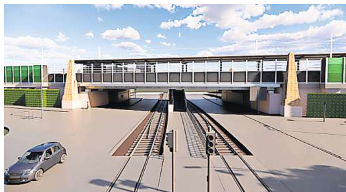
Gleiswechsel: Der Bau der S-Bahn Station Waldhausen soll im Jahr 2026 beginnen. Visualisierung: Bahn AG

Pläne für einen S-Bahn-Halt am Braunschweiger Platz hat die Region schon länger, sie sind aber nach wie vor in einem frühen Stadium. Kernthema ist, ob Fahrgäste aus der S-Bahn mit einem Fahrstuhl direkt in die U-