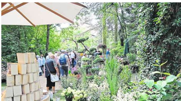
Alles rund um Garten und Genießen gibt es bei der Blumen & Ambiente.