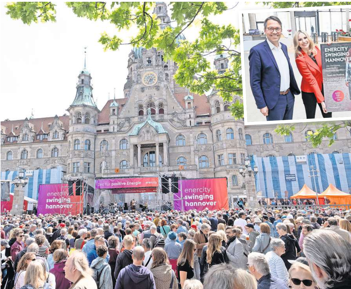
Bei Enercity Swinging Hannover am 9. Mai vor dem Rathaus werden wieder 40.000 Menschen erwartet; hier ist zu sehen, wie voll es im vergangenen Jahr war.

Was es in diesem Jahr nicht gibt, ist die Jazz-Night am Vorabend im HCC, früher bekannt