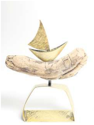
Objekt „Unterwegs“ von Meike Kröger.

70er-Jahre und setzt diese zeitgemäß um in einer Kollektion aus naturbelassenen Leinen, die sie im Siebdruckverfahren mit Blumenmotiven ziert. Daraus entstehen dann Mäntel und Hosenskleider. Während wird das