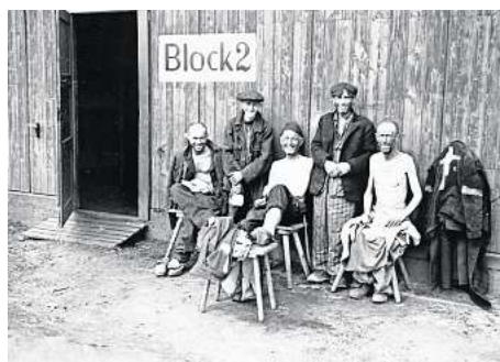
Befreite Häftlinge: US-Aufnahmen zeigen Gefangene des KZ Ahlem 1945.

„In Ahlem sollten die Häftlinge unter anderem für den Rüstungsbetrieb Continental bombensichere unterirdische Produktionsstätten schaffen“, sagt Geyer. Unter unmenschlichen Bedingungen mussten die Inhaftierten in den alten Asphaltstollen schuften. Zu essen bekamen sie nur Hungerrationen.