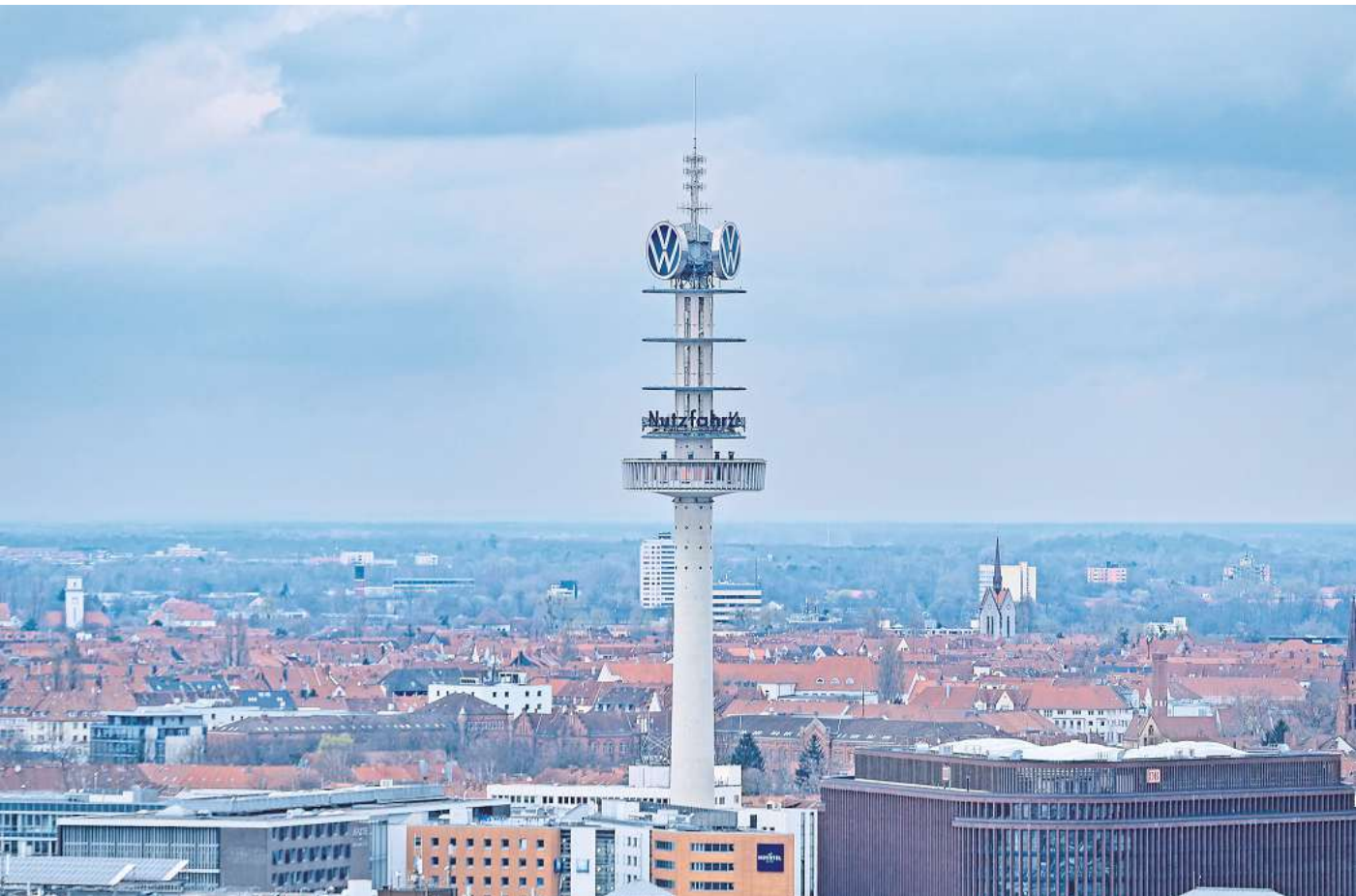
Was wird aus dem Telemoritz? Seine Zukunft ist ungewiss.

Dennoch werden schon bald sichtbare Arbeiten am Telemoritz beginnen. „Die Demontage der Werbung und des Stahlbaus wird kurzfristig geplant und umgesetzt, um die Sicherheit weiter zu erhöhen“, teilte VVN-Vorstandsmitglied Josef Baumert mit. Denn auf das am Sanierungsbedürftigen Turm befestigte VW-Logo wirken