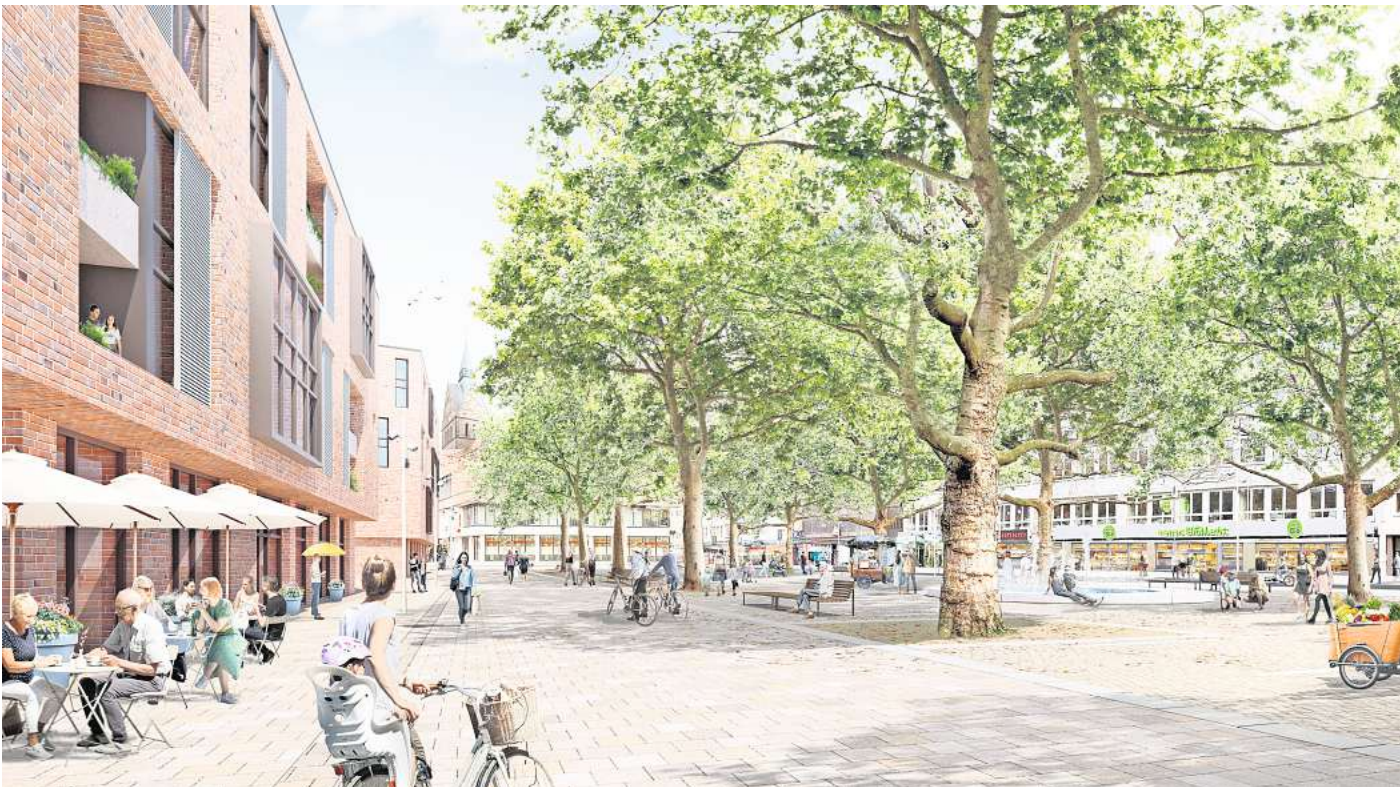
Grüne Vision: So könnte der Köbelinger Markt nach dem Umbau der Innenstadt aussehen. Wird dieses Projekt nun gekippt?

Auch für FDP-Fraktionschef Wilfried Engelke ist „der Abbau von Parkplätzen die rote Linie“. Allerdings sei es „der richtige Weg“, dass die Stadt nun projektweise um Kompromisse und die Zustimmung für ihre Vorhaben werben wolle, anstatt das komplette Paket durchdrücken zu wollen. Gute Chancen sieht Engelke für den klimagerechten Umbau der Prinzenstraße, für die die Stadt bereits Pläne vorgelegt hat.