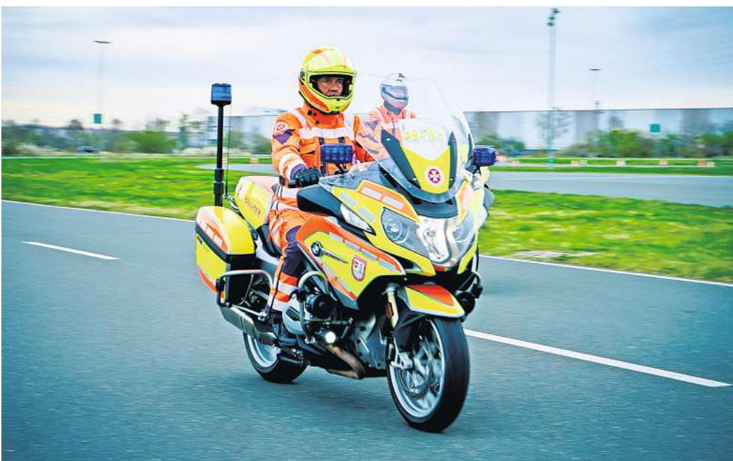
Sind wieder im Einsatz: Die Johanniter-Motorradstaffeln sind in die Saison gestartet.

Die Motorräder sind entlang der Bundesautobahnen 1, 2 und 7, im Bereich des Autobahnkreuzes der Autobahnen 7 und 2 und bis hin zur A 27, A 28 und A 29 unterwegs, um im Notfall zu helfen und die Autobahnpolizei zu unterstützen. Die ehrenamtlichen Fahrerinnen und Fahrer kümmern sich in diesem Rahmen um Reisende, die Erste Hilfe benötigen oder mit ihrem Fahrzeug liegen geblieben sind. Sie gewährleisten die schnelle Absicherung von Unfallstellen oder die Organisation des Abschleppdienstes. Auch Hinweise zu Umleitungen oder die tatkräftige Unterstützung zur schnellen Bildung von Rettungsgassen gehören dazu. Außerdem werden staugeplagte Familien mit Erfrischungen und Kinderspielzeug versorgt. Johanniter-Landesvorstand Stefan Radmacher verwies auf die besondere Bedeutung des Ehrenamtes: „Die Bilanz in der letzten Saison zeichnet sich durch rund 4.700 ehrenamtliche Einsatzstunden, mehr als 145.000 gefahrene Kilometer und gut 1.100 Hilfsleistungen aus. Das ist schon ein besondere