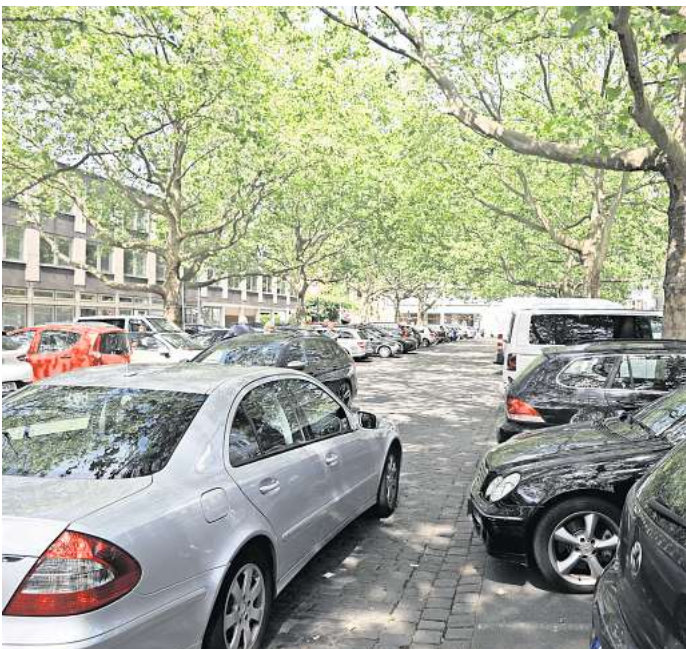
Umstritten: die Zukunft des Köbelinger Marktes. SPD, CDU und FDP wollen einen Großteil der Parkplätze erhalten. Aus Sicht der großen Automobilclubs ist das nicht notwendig.