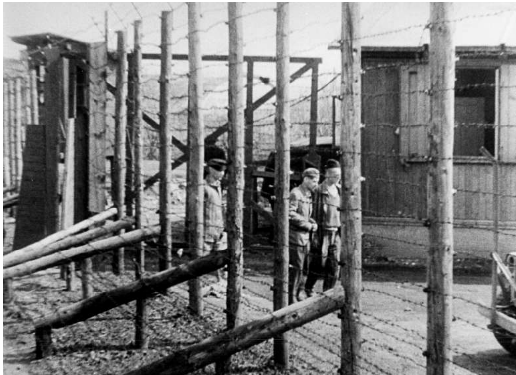
Beklemmende Bilder: US-Kamerateams hielten Szenen aus dem KZ Ahlem nach der Befreiung am 10. April 1945 fest.

Auch zur Machtübernahme der Nazis in der Stadt und zur Pogromnacht vom 9. November 1938 hat der frühere Marketingberater historisch fundierte Kurzfilme produziert. Er erzählt in diesen Videos das dunkelste Kapitel der deutschen Geschichte konsequent aus hannover-