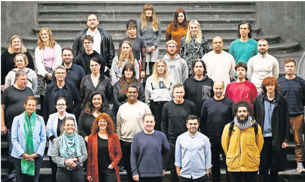
Expertinnen und Experten für die Kultur zu später Stunde: Der Nachrat hat sich jetzt konstituiert, will das nächtliche Leben in der Stadt mitgestalten und perspektivisch weiterentwickeln – zum Beispiel mit neuen Veranstaltungsformaten.

Es gibt bereits Überlegungen, die Partyreihe „Nacht der Nächte“ in den Clubs der Stadt wieder aufleben zu lassen, die vor 20 Jahren eingestellt wurde. Damals konnten Nachtschwärmer eine Vielzahl von Clubs besuchen und mussten nur einmal Eintritt zahlen. Das Clubhopping durch die Nacht genoss seinerzeit Kultstatus in Hannover.