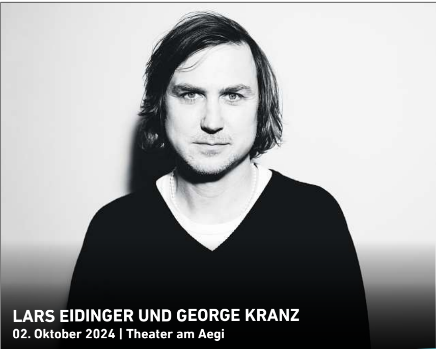
LARS EIDINGER UND GEORGE KRANZ 02. Oktober 2024 | Theater am Aegi

Geöffnet ist die Ausstellung in der Handwerksform, Berliner Allee 17, von Dienstag bis Freitag von 12 bis 19 Uhr sowie Sonnabend von 12 bis 17 Uhr. HR