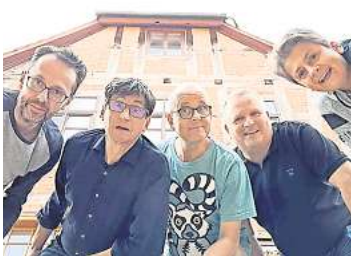
Kabarett Störfall

HANNOVER. Das Kabarett Störfall ist am 24. und 25. Februar mit dem Programm „Durch uns die Sintflut!“ im Lindener Kultladen Feinkost Lampe, Eleonorenstraße 18, zu Gast. Beginn ist jeweils um 20 Uhr. Das „Balkonkraftwerk unter den Boomer-Kabaretts“ liefert laborierte Pointen zur Erotik