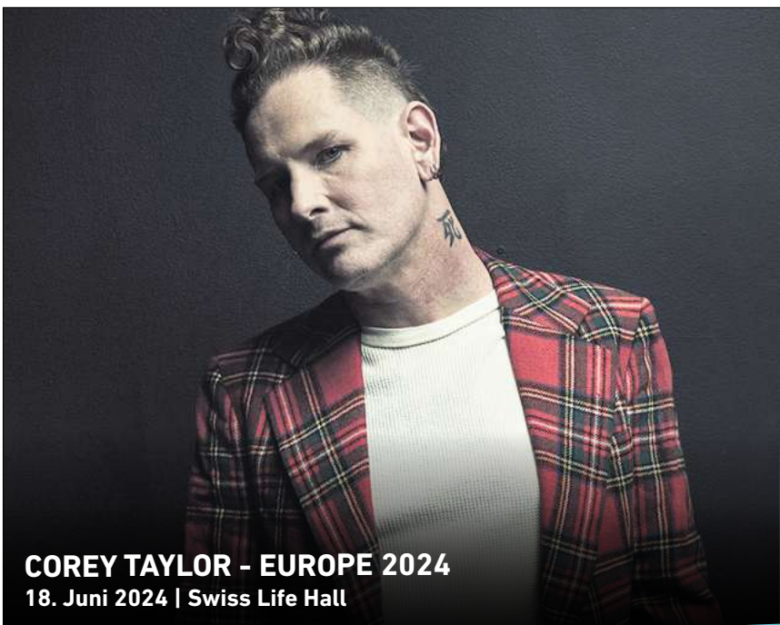
COREY TAYLOR - EUROPE 2024 18. Juni 2024 | Swiss Life Hall

Ihr persönlicher Ticketservice der HAZ & NP