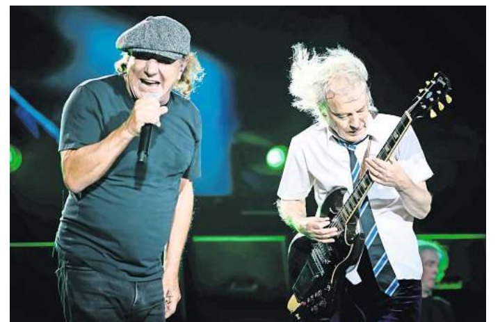
Legendäres Duo: Brian Johnson (links) und Angus Young bei einem AC/DC-Konzert im Oktober 2023.

black“, „Demon fire“, „Shot down in flames“, „Thunderstruck“, „Have a drink on me“, „Hell's bells“, „Shot in the dark“, „Stiff upper lip“, „Dirty deeds done dirt cheap“, „Shoot to thrill“, „Sin city“, „Givin the dog a bone“, „Rock'n'Roll Train“, „You shook me all night long“, „Dog eat dog“, „High voltage“, „Hell ain't a bad place to be“, „Riff raff“, „Highway to hell“, „Whole lotta rosie“ und „Let there be rock“ sowie als Zugaben „T.N.T.“ und „For those about to rock (We salute you)“.