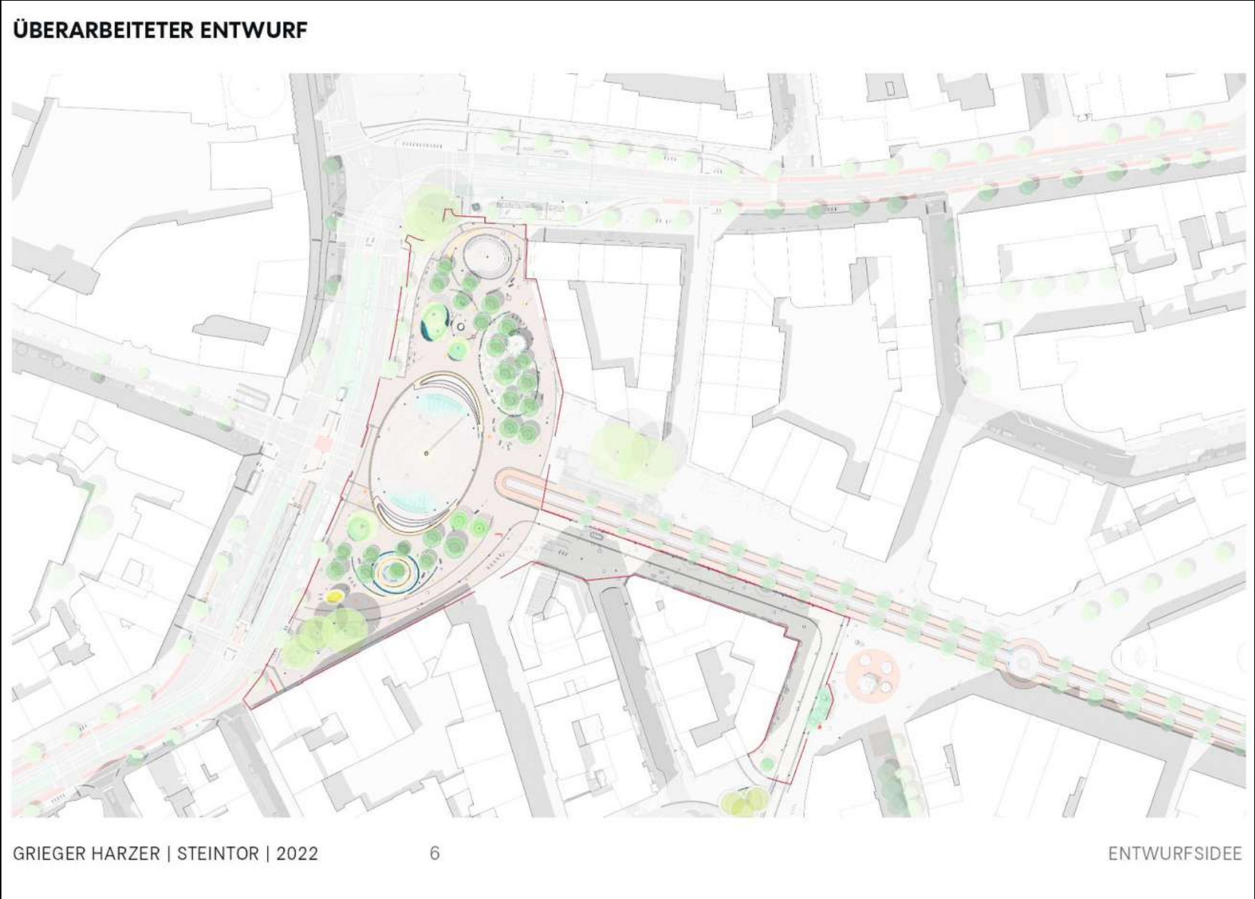
Das sind die Pläne des Büros Grieger Harzer Landschaftsarchitekten aus Berlin für den umgebauten Steintorplatz in Hannover. Visualisierung: Grieger Harzer

Halbrund der Bäume, die bestehen bleiben und ergänzt werden, entsteht eine 30 Meter hohe illuminierte Stele, gesäumt von zwei Wasserspielen und rundherum locker verteilten Freizeit-, Spiel- und Sportflächen. Die Wettbewerbssieger, das Berliner Büro Grieger Harzer, hat es sogar hinbekommen, dass weiterhin Platz sein soll etwa für die beliebten Stoffmärkte und für Demonstrationen. Weil der Umbau inklusive einer Brunnen-Versetzung mit etwa 8,62 Millionen Euro veranschlagt ist, waren zuletzt Zweifel an der Umsetzung gewachsen. CDU und FDP hatten vorgeschlagen, das Projekt um Jahre zu verschieben. Seit aber im Herbst die Rathausmehrheit aus Grünen und SPD zerbrochen ist,