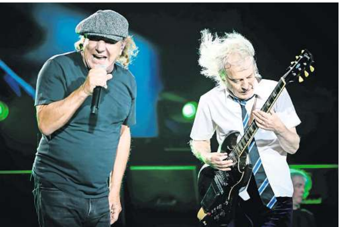
Legendäres Duo: Brian Johnson (links) und Angus Young bei einem AC/DC-Konzert im Oktober 2023.

black“, „Demon fire“, „Shot down in flames“, „Thunderstruck“, „Have a drink on me“, „Hell's bells“, „Shot in the dark“, „Stiff upper lip“, „Dirty deeds done dirt cheap“, „Shoot to thrill“, „Sin city“, „Givin the dog a bone“, „Rock'n'Roll Train“, „You shook me all night long“, „Dog eat dog“, „High voltage“, „Hell ain't a bad place to be“, „Riff raff“, „Highway to hell“, „Whole lotta rosie“ und „Let there be rock“ sowie als Zugaben „T.N.T.“ und „For those about to rock (We salute you)“.