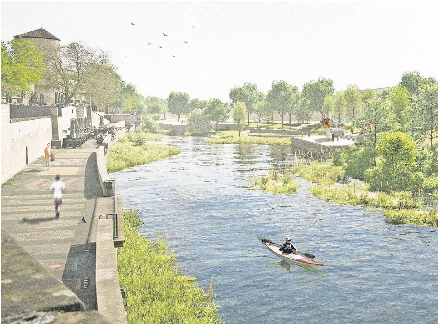
Zukunftsvision: So großflächig und grün könnte Hannovers Leineufer sein.