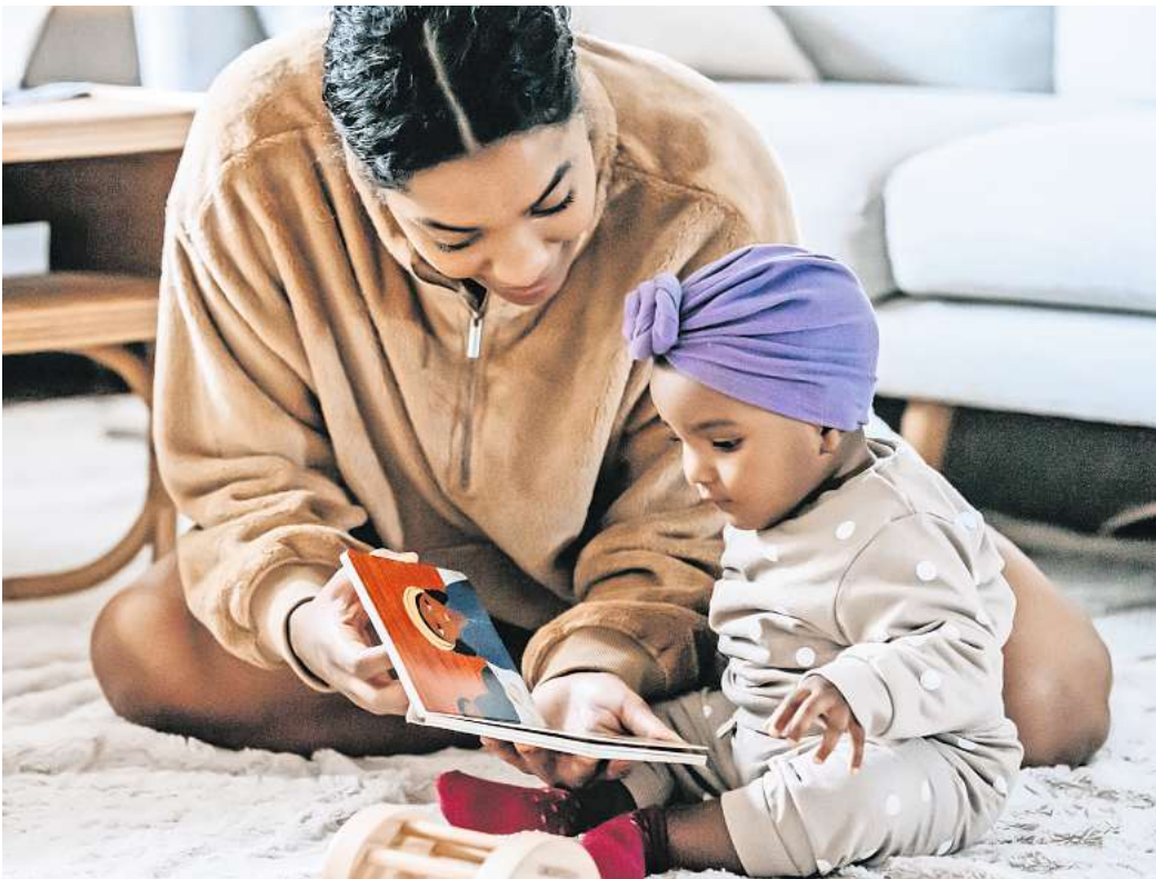
Spaß mit Bilderbüchern: Die Partner des Lesenetzwerks geben viele Anregungen zum Singen, Vorlesen und zur spielerischen Sprachförderung mit Unterstützung durch ein Bilderbuch.