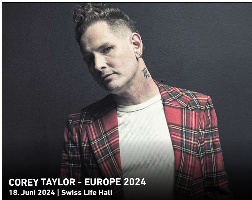
COREY TAYLOR - EUROPE 2024 18. Juni 2024 | Swiss Life Hall

Ihr persönlicher Ticketservice der HAZ & NP