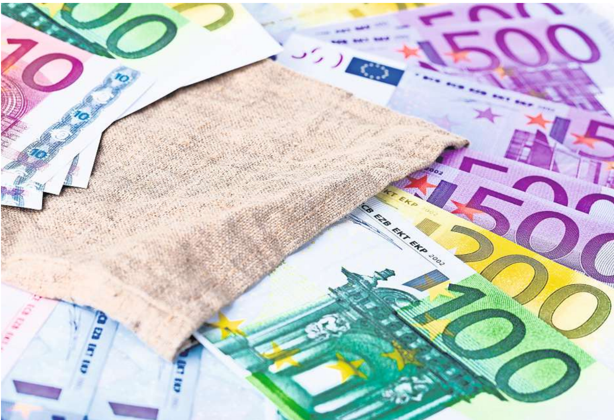
Bei einem Großteil der Falschgeldscheine sind diese recht einfach von echten Banknoten zu unterscheiden.

Die Euro-Währungshüter tüfteln bereits an neuen Sicherheitsmerkmalen, um es Kriminellen noch schwerer zu ma-