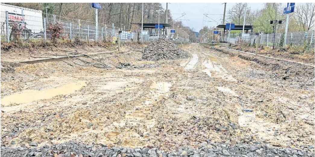
Tiefe Furchen: Auf diesem matschigen Boden kommen die schweren Baumaschinen nicht vorwärts. Eine Baustraße aus Kunststoffmatten soll nun helfen.

Diese Projekte laufen auch im Jahr 2024 und darüber hinaus weiter. Regions-Verkehrsdezernent Ulf-Birger Franz sagt deshalb: „Das Schienennetz in Deutschland wurde 30 Jahre lang vernachlässigt und ist in einem desaströsen Zustand.“ Es werde einige Jahre dauern, bis diese Versäumnisse aufgeholt seien werden. Er gehe deshalb auch in den nächsten Jahren von einer großen Störungsanfälligkeit des Netzes aus und rechne mit Einschränkungen wegen geplanter Baustellen, aber auch wegen ungeplanter Störungen, teilt Franz mit. Aktuell gibt es vor allem Behinderungen durch eine Baustelle zwischen Barsinghausen und Egestorf, deren Arbeiten schon längst beendet sein sollten. Denn eigentlich sollen Arbeiter die dortigen Gleise erneuern – vom 18. November bis zum 4. Dezember. Doch es gab und gibt immer neue Verzögerungen. Inzwischen steht fest: