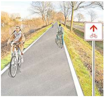
Viel Raum fürs Radfahren: Der Bund und die Region erweitern und sanieren den Radweg am Mittellandkanal auf 54 Kilometern.