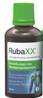
Rubaxx Tropfen (PZN 13588561)