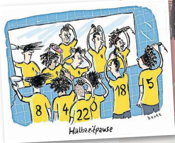
„Halbzeitpause“: Die Illustration von Bettina Bexte ist in der Ausstellung „Anpiff!“ zu sehen. Quelle: Bettina Bexte / Wilhelm-Busch-Museum

Im Westflügel ist bereits ein Gästezimmer für kleinere Ausstellungen entstanden. Daneben liegt das neue Kinderzim-