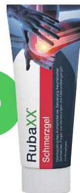
Rubaxx Schmerzgel (PZN 18709526)