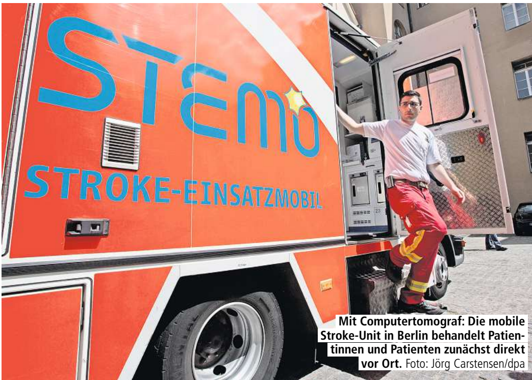
Mit Computertomograf: Die mobile Stroke-Unit in Berlin behandelt Patientinnen und Patienten zunächst direkt vor Ort.

Telefon KundenServiceCenter: 0800 / 0 01 92 14 (kostenfrei)