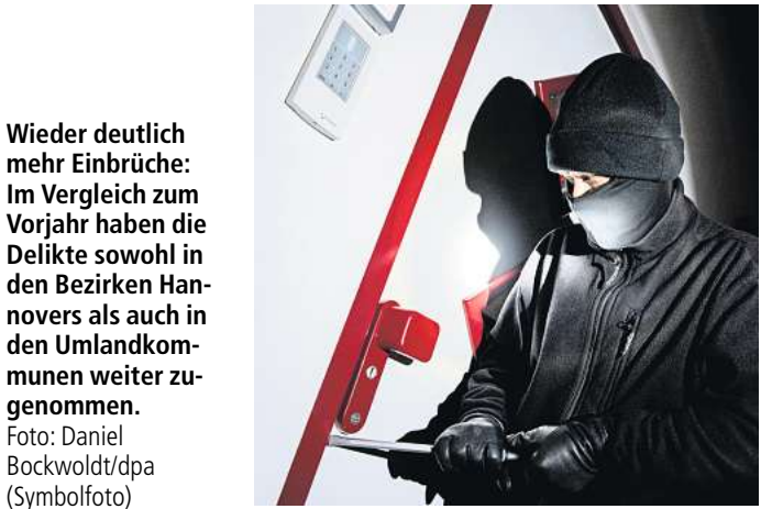
Wieder deutlich mehr Einbrüche: Im Vergleich zum Vorjahr haben die Delikte sowohl in den Bezirken Hannovers als auch in den Umlandkommunen weiter zugenommen. Foto: Daniel Bockwoldt/dpa (Symbolfoto)

Immerhin: Dort reicht der aktuelle Wert von 6,6 Taten immer noch für den dritten Platz (2022: 7,9). Zwischen Springe und Pattensen drängt sich in diesem Jahr allerdings Laatzen: Die Kommune verzeichnet 2023 bloß 6,1 Einbrüche je 10.000 Einwohner. Im Vorjahr lag der Wert mit 10,7 Delikten noch deutlich höher.