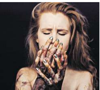
Sängerin Joules the Fox veröffentlicht das EP-Album „If Time Is“.

Elo alias Hertzcasper ist eine der starken Stimmen in Hannovers aktuellem Soundtrack. Es gibt auf Streaming-Plattformen erst vier Songs – wie „Die letzte Zigarette“ –, aber noch kein Album. Trotzdem bemühen sich viele Bühnen der Stadt um Hertzcasper-Konzerte. Die Mischung aus Hip-Hop-, Soul- und Funk-Grooves mit Liedern über alles zwischen Kopf- und Herzschmerz ist eben kein Internet-, aber definitiv ein Bühnenphänomen.