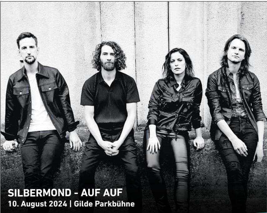
SILBERMOND - AUF AUF 10. August 2024 | Gilde Parkbühne

Ihr persönlicher Ticketservice der HAZ & NP