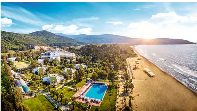
Zu gewinnen gibt es eine zehntägige Flugreise für zwei Personen in die Türkei.