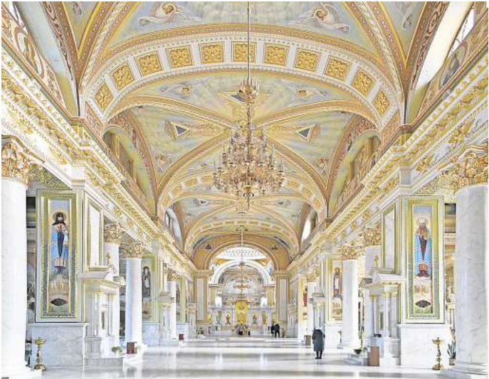
Fotografiert vor der Zerstörung: Die Verklärungskathedrale in Odessa wurde im Sommer bei einem russischen Angriff schwer beschädigt.

mentieren Kirchen, Stadtpaläste, aber auch moderne Wohngebäude aus dem 20. Jahrhundert. Konzentriert sich das Projekt auf bestimmte Regionen?