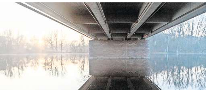
Rodung für Januar geplant: Unter anderem neben der Schnellwegbrücke über den Großen Ricklinger Teich sollen alle Bäume fallen, um die Erneuerung der Brücke vorzubereiten.

Bei Klimaaktivisten und Ausbaugesnern herrscht schon länger der Verdacht, dass das Land die Rodungen vorzieht, um Fakten zu schaffen. Konkret geht es um ein großes Baufeld rund um die Leinebrücke des Südschnellwegs und die benachbarte Leineflutbrücke über den Großen Ricklinger Teich. Beide erreichen laut Einschätzung der Behörde in Kürze das Ende ihrer Lebensdauer, sind bereits notabilisiert und sollen komplett ersetzt werden.