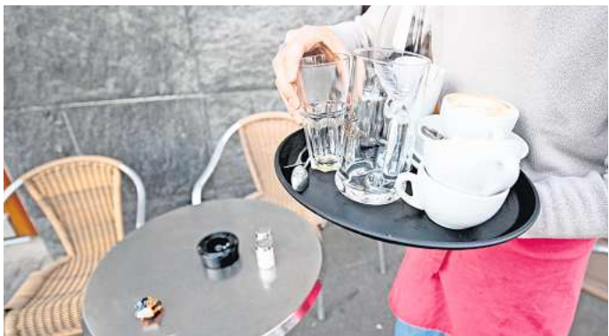
Die Gastronomie muss Erhöhungen bei Mehrwertsteuer und Mindestlohn ausgleichen.

Beitragsbemessungsgrenze steigt Gutverdiener zahlen wegen der regelmäßigen Erhöhung der Beitragsbemessungsgrenze höhere Sozialabgaben. In der gesetzlichen Renten- und der Arbeitslosenversicherung werden Beiträge nun bis zu einem Einkommen von monatlich 7550 Euro im Westen und 7450 Euro im Osten fällig. Die Grenze für die gesetzliche Kranken- und Pflegeversicherung steigt auf 5175 Euro.