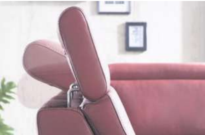
Kopfteilverstellung gegen Mehrpreis