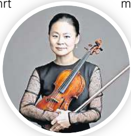
Violinvirtuosin Midori tritt bei Konzerten im NDR-Funkhaus auf.

Vorverkauf: ndr.de/orchester_chor/radiophilharmonie