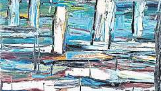
Giso Westing, o.T., 2021, Öl auf Leinwand

Die Galerie Kubus, Theodor-Lessing-Platz 2, ist geöffnet von Dienstag bis Sonntag bei freiem Eintritt. Immer sonntags bietet der „SonnTALK“ von 14 bis 15 Uhr einen Raum zum Sprechen und Nachdenken über Kunst.