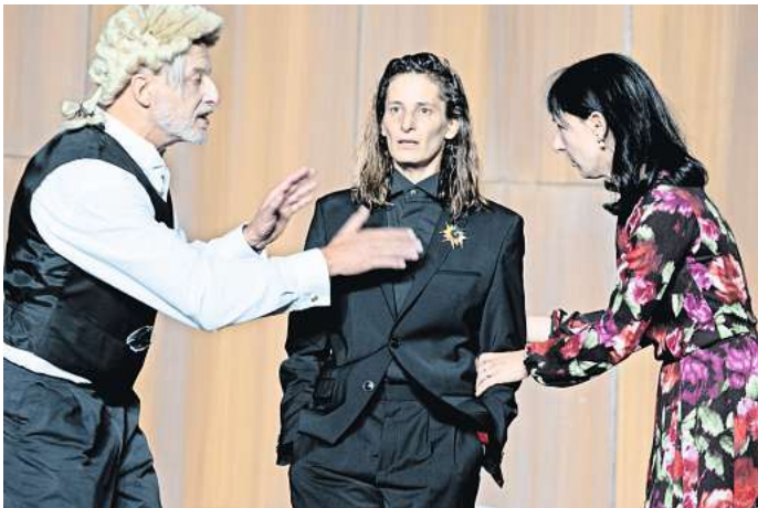
Schauspiel Hannover: „Richard III.“ nach William Shakespeare in einer Bearbeitung von Michel Decar.

HANNOVER. Im Bilderbuchkino der Stadtbibliothek Am Kronsberg / Krokus, Thie 6, wird am Dienstag, 9. Januar, ab 16 Uhr „Das Schneemannkind“ präsentiert. Die Geschichte von Jörg Hilbert ist für Kinder ab vier Jahren geeignet und erzählt von dem Braunbär Schoko, der als Eismann arbeitet. Es liegt noch Schnee, aber es riecht schon nach Frühling. In dieser interessanten Wetterlage rettet Schoko das Schneemannkind Flocke vor der Schmelze und macht es zu seinem Kompanion. Im Gefrierschrank der Eiskarre überlebt Flocke und gewinnt zunehmend Freude am Sommer, an der Welt der Farben, den Kindern, am Eisverkaufen und dem Gesang der Nachtigall.