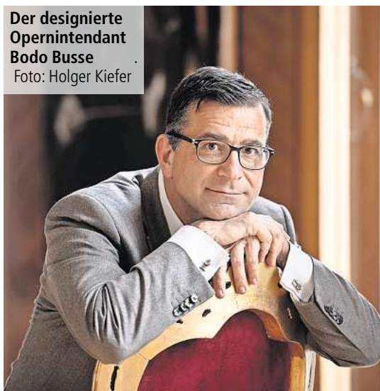
Der designierte Opernintendant Bodo Busse