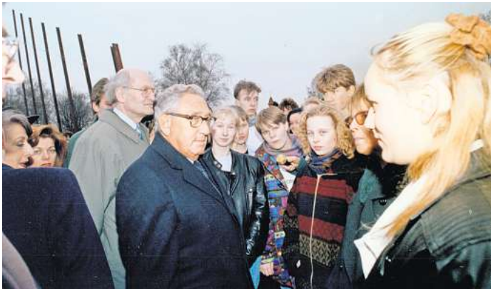
Der frühere US-Außenminister Henry Kissinger besucht am 3. März 1994 die Gedenkstätte im ehemaligen KZ Ahlem.