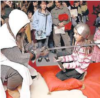
Ritterschlag? Gibt es im aufhof.

An zwei Terminen werden Siegel gegossen aus verschiedenem Material. Am 12. Dezember von 15 bis 18 Uhr entstehen in der Zeit von 15 bis 18 Uhr Seilsiegel und die Teilnehm-