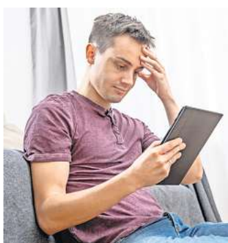
„Wie konnte ich da bloß drauf reinfallen?“ Manchmal sieht man den Betrug im Netz einfach nicht kommen.

2. KfW-Phishing: Betrüger missbrauchen den Namen der KfW-Förderbank und preisen in gefälschten Mails ein frei erfundenes „Sonder-Förderprogramm ISFP-01“ an, das angesichts der Inflation vor bevorstehenden Kostensteigerungen absichern können soll. Wer in der Mail auf den Button „Jetzt Antrag stellen“ klickt, gelangt auf eine professionell gestaltete Seite, die der KfW-Seite täuschend ähnlich sieht, warnt das Landeskriminalamt (LKA) Niedersachsen. Perfide: Viele Links auf der gefälschten Seite führen direkt zur echten KfW-Webseite, so etwa auch der Impressums-Link. Allerdings unterscheiden sich die Adressen der gefälschten (kfwfoerderprogramm-portal-