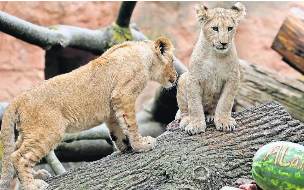
Namen für den Berber Löwennachwuchs: Die beiden Mädchen heißen Alani und Zuri, ihr Bruder Tayo.