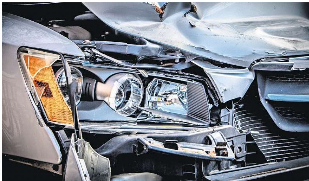
Wenn es gekracht hat, wird es teuer: Weil die Kosten für Autoreparaturen gestiegen sind, passen auch die Versicherer die Beiträge an.