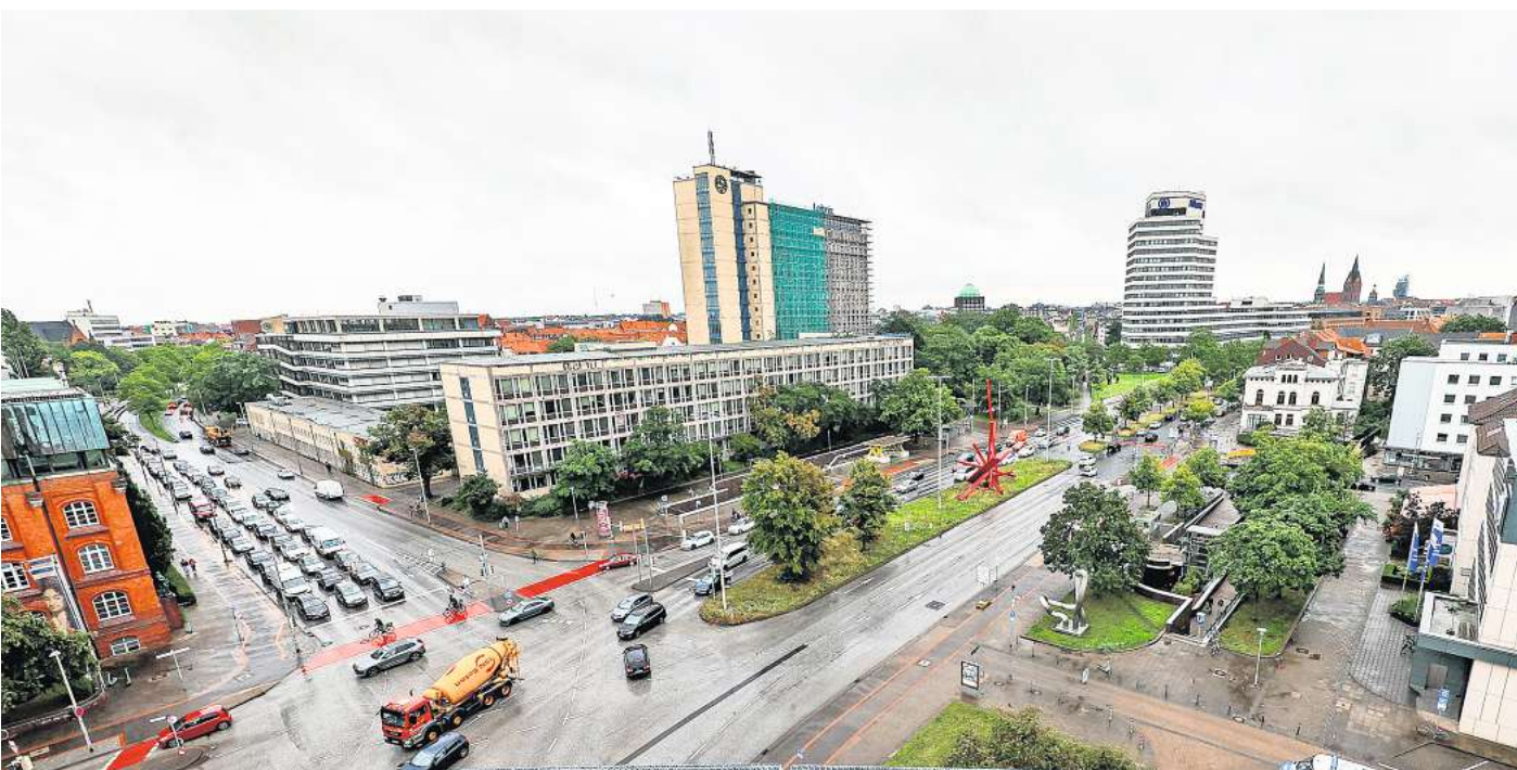
Gefahrenpunkt: Der Königsworther Platz.

HANNOVER. Mehr als 2000 Verkehrsunfälle mit Verletzten oder gar Getöteten hat es im vergangenen Jahr in Hannover gegeben. Das geht aus dem neuen Unfallatlas 2022 hervor. Die interaktive Karte der Statistischen Ämter des Bundes und der Länder zeigt alle Punkte auf Deutschlands Straßen, an denen mindestens ein Mensch zu Schaden kam. Welche waren die zehn gefährlichsten Kreuzungen in Hannover? ► Platz 1: Königsworther Platz Der Platz der gefährlichsten Kreuzungen in Hannover geht erneut an den Königsworther Platz. 2022 gab es 20 Unfälle, einer mehr als noch 2021. Mit 17 Zusammenstößen ereigneten sich dort auch die meisten Zusammenstöße mit Pkw-Beteiligung. Außerdem gab es acht Kollisionen mit Fahrrädern und drei mit Kraftfahrzeugen. Bei einem Unfall zwischen Auto und Radfahrer gab es einen Schwerverletzten, bei den restlichen 19 Kollisionen blieb es bei leichten Blessuren. Immerhin: Vom bisherigen Spitzenwert von 2017 mit 26 Unfällen ist der Königsworther Platz weit entfernt. ► Platz 2: Aegidientorplatz Auch der Aegidientorplatz hat sich verschlechtert. Mit jetzt 18 Unfällen (2021: 14) belegt die Kreuzung nun den zweiten Rang. Mit Blick auf die Radfahrerinnen und Radfahrer der Stadt ist der Aegi 2022 sogar der gefährlichste Bereich der Stadt gewesen. Insgesamt zwölf Kollisionen mit verletzten Radlern weist die Statistik auf, in neun Fällen waren Pkw mitbeteiligt – ein Unfall endete