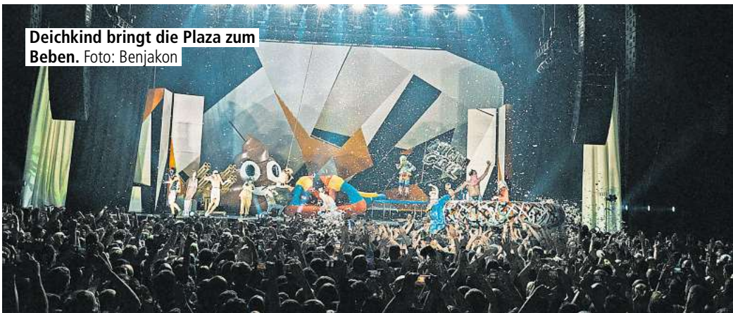
Deichkind bringt die Plaza zum Beben.

Galerie im Treppenhaus, Schlägerstraße 17. 12. und 18. und 19. August jeweils von 16 bis 21 Uhr, und nach Vereinbarung unter Telefon (0511) 35324555.