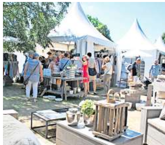
Ein buntes Angebot lädt zum Stöbern und Entdecken ein.

unter anderem mit dabei ist die Horus-Falknerei mit ihrer Greifvogelshow. Bei atemberaubenden Jagdflügen zeigen die Tiere ihr Tempo und ihre Geschicklichkeit, während sie sich schon im