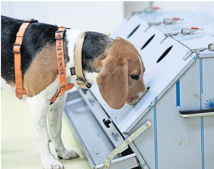
Trainiert an der Tierärztlichen Hochschule Hannover: Corona-Spürhunde erkennen Proben von Menschen mit Post-Covid.

Das könnte den Grundstein für eine zuverlässige Diagnose legen.