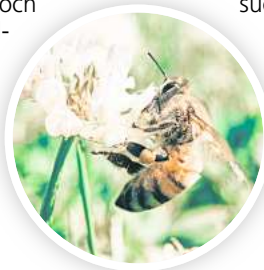
Beim Insektenommer wird wieder fleißig gezählt.

► Gemeldet werden die Beobachtungen per Online-Formular oder mit der kostenlosen Web-App „NABU Insektenommer“. Beide Meldewege sind unter insektenommer.de abrufbar, wo es auch gratis Informationsmaterial zum Herunterladen gibt.