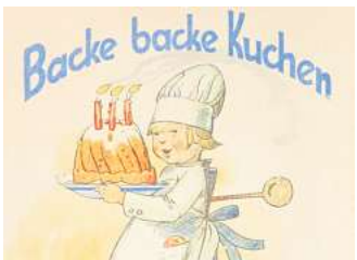
Kinderbuch-Illustrationen sind ein Teil der Mitmach-Ausstellung im aufhof.