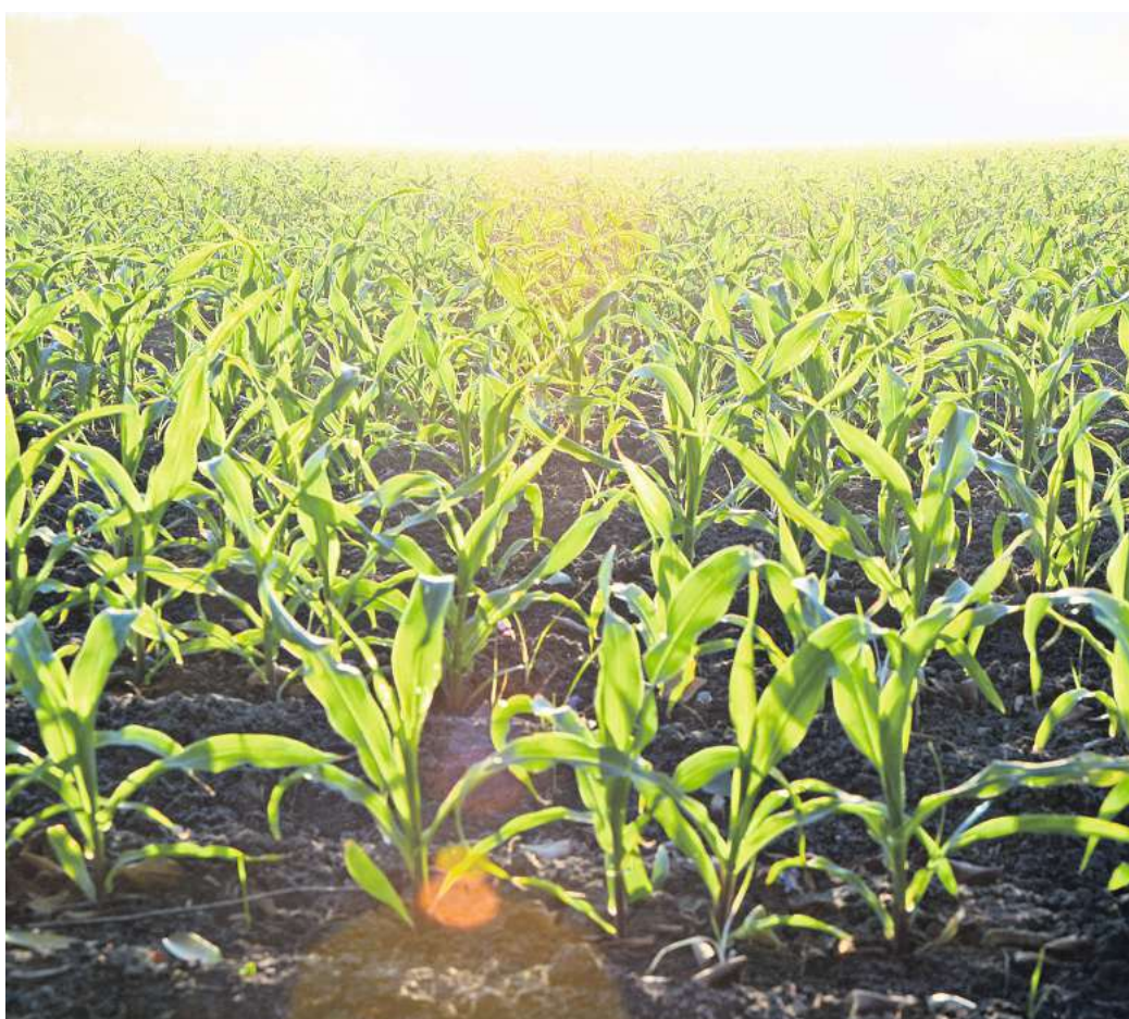
Nach dem Willen der EU-Kommission sollen gentechnisch veränderte Pflanzen und Saatgut im Freiland kultiviert werden – ohne Risikoprüfung und ohne dass eine Genehmigung erforderlich ist