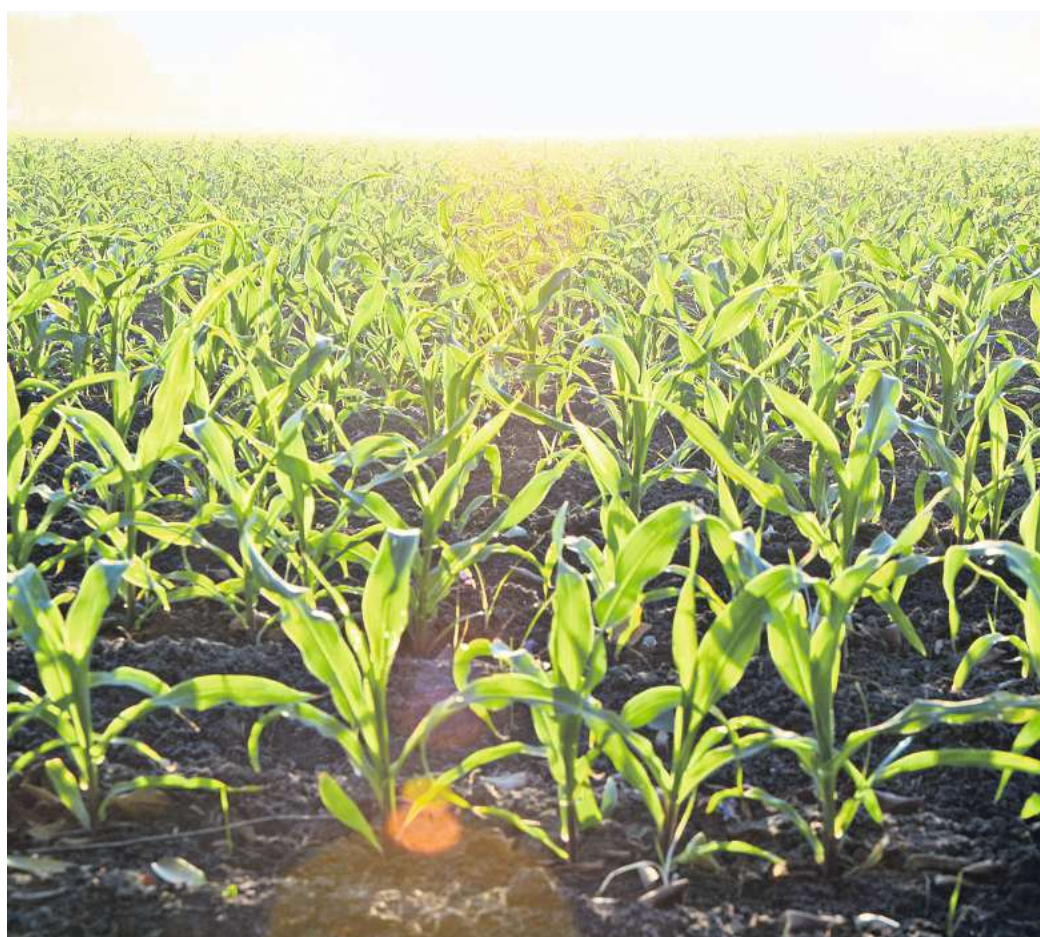
Nach dem Willen der EU-Kommission sollen gentechnisch veränderte Pflanzen und Saatgut im Freiland kultiviert werden – ohne Risikoprüfung und ohne dass eine Genehmigung erforderlich ist