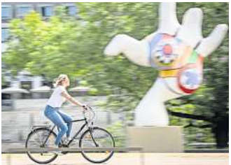
Fahrradfahren in Hannover.

Die Broschüre ist kostenlos erhältlich in der Hannover Tourist Information am Ernst-August-Platz 8 in Hannover, in Hotels, Kultur- und Freizeiteinrichtungen, in Fahrradverkaufsgeschäften und Zubeihörläden. Download: visit-hannover.com/radfahren