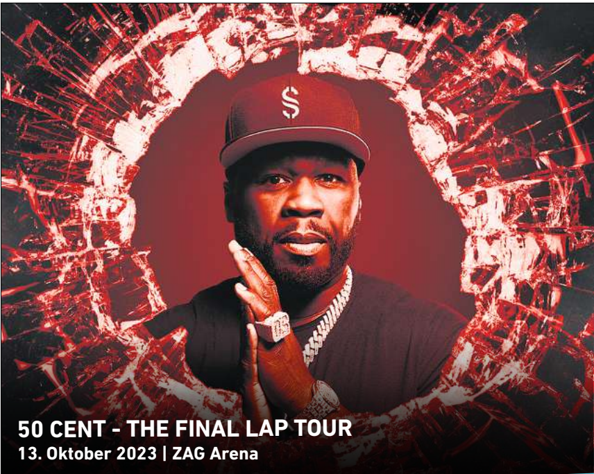
50 CENT - THE FINAL LAP TOUR 13. Oktober 2023 | ZAG Arena

Ihr persönlicher Ticketservice der HAZ & NP